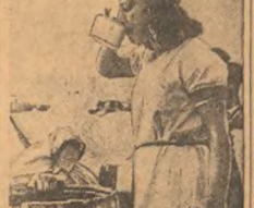
На снимке: комбайнеры Крыма прибыли в западную Сибирь.