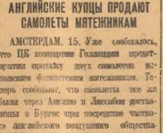
На снимке: английские купцы продают самолеты мятежникам.