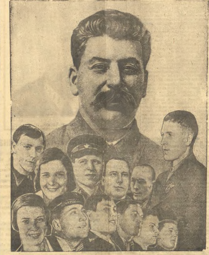
ПЕРВЫЕ СТАХАНОВЦЫ — СЛАВНЫЕ СТАЛИНСКИЕ ПИТОМЦЫ, ПОЛОЖИВШИЕ НАЧАЛО БОРЬБЕ ЗА НОВЫЕ СТАХАНОВСКИЕ НОРМЫ ПРОИЗВОДИТЕЛЬНОСТИ ТРУДА.

„Помочь стахановцам развернуть дальше стахановское движение и распространить его вширь и вглубь“. (Сталин)