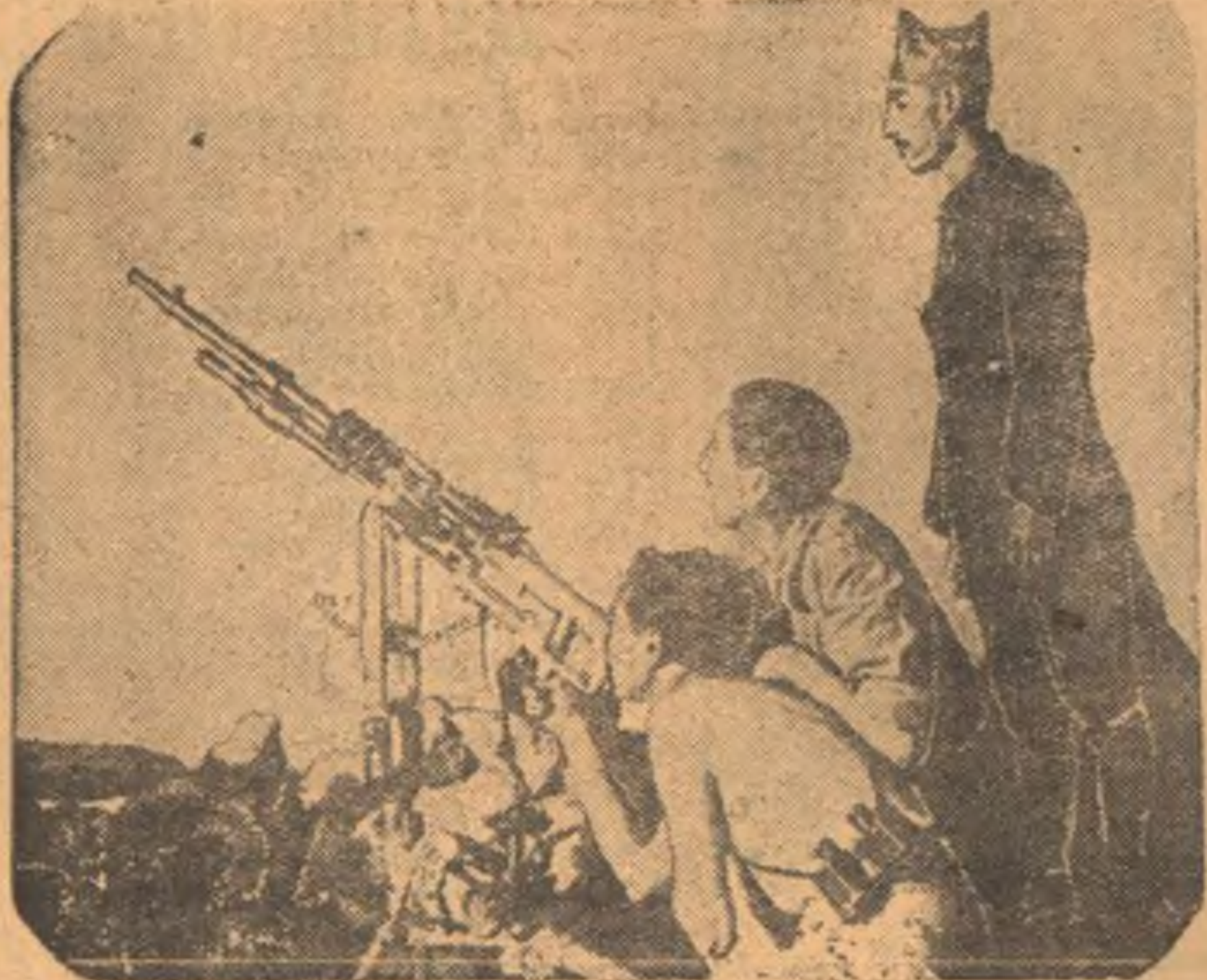
На снимке: передовой пост правительственных войск у зенитного пулемета на фронте Гвадаррама.