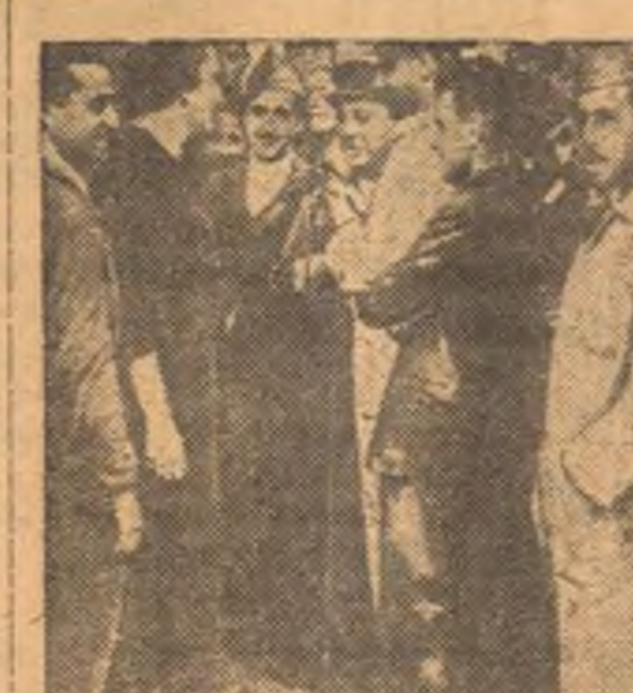
На снимке: известная коммунистическая деятельница, депутатка испанского парламента Долорес Ибаррури (Пассионари) беседует с республиканскими дружинниками на северном фронте.

В этой тяжелой обстановке... Мы ждем их от всего сердца. Не забывайте слова того волнения, с которым слышим мы за отчаянной героической борьбой испанского народа с порою кровавых фашистских насильников.