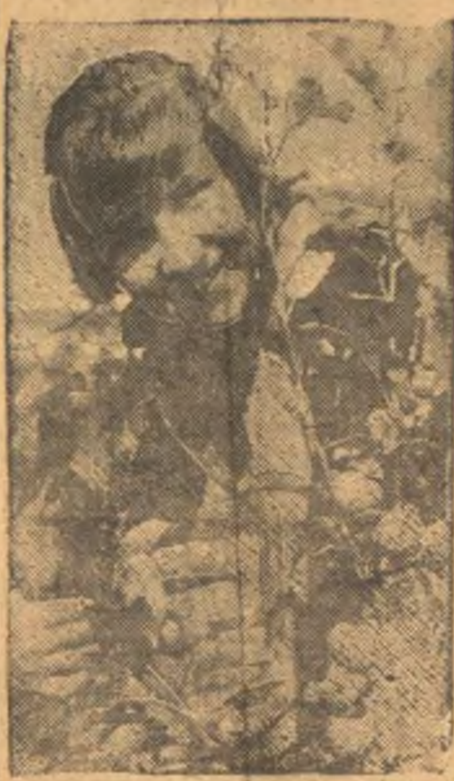
Школьница воспитанница школы-садовника для детей энтузиастов Кузнецова Ибра и обслуживающей его яблоки «белый палец», давней первый урожай (16 штук).

С этой целью в июле и августе сего года тов. Перов проведет двухдневные курсы, через которые пройдет 168 человек. Л. Давыдов.