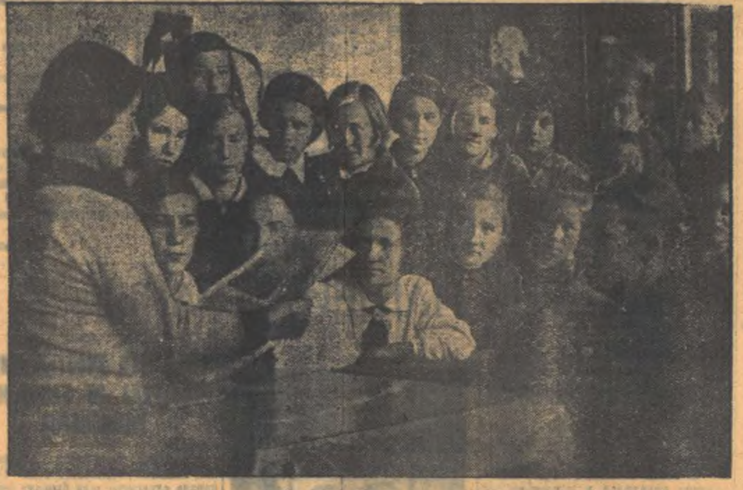
Почеры 6 образцовой школы за четной газет.

МОСКВА. 3. К работе по новым правилам технической эксплуатации уже подготовились все отделения, участки, депо железных дорог Советского Союза. С 1 октября вступает в силу. Поступают сообщения о многочисленных собраниях железнодорожников, встречающих правила с интересом и учащими новыми производственными обязательствами. С энтузиазмом обсуждают и подготавливают транспортники коллективные обязательства перед народом товарищу Сталину о безупречном выполнении новых правил. 1 октября, к вечеру, на Закавказской дороге состоялось 454 собрания. Коллективные обязательства подписали 32864 человека. Хорошо подготовились к работе по новым правилам станции Новорига, Борисоглеб, Россось, Кантемировка и многие другие станции Московско-Донбасской магистрали. Все секаторы, предпринимательские диксы, стрелочные и ручные фохары привезены в образцовый порядок. Все поезда отправлены по графику. Все по дороге сданы испытания по новым правилам 17786 работников, из них 4 тысячи по «отлично». (ТАСС).