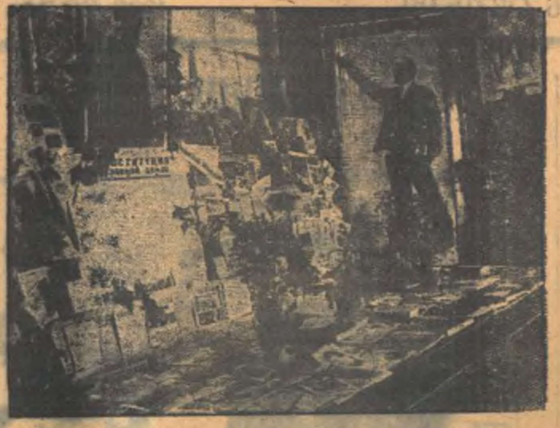
В выставочном зале университета организована выставка, посвященная во. присам Конституции СССР. На сцене: один из уголки выставки.

В газете «Красное Знамя» мы прочитали предложение, говорящее, что в статье 125, в словах «они права граждан обеспечиваются предоставлением трудящимся и их организациям типографий, запасов бумаги, общественных зданий, улиц, средств связи...» надо добавить: «и радиосвязи». Зачем добавлять «и радиосвязи», когда это понятие входит в понятие «средств связи»? 29 сентября в «Красное Знамя» было внесено предложение председателя завода имени Рухина статьи тов. Иванова и внесены в статью 121 слов о возрастных границах приема в высшие учебные заведения. Это совершенно не нужно писать в Конституцию, так как этот вопрос будет рассматриваться в соответствующих постановлениях правительства о приеме в вузы. Нет необходимости также и в дополнении тов. Ященко о том, что «каждый гражданин обязан бороться за повышение производительности труда». В статье 12 с достаточной ясностью говорится: «... В СССР осуществляется принцип социализма: «от каждого по его способности, каждому — по его труду». Эти слова совершенно четко говорят о том, что каждый гражданин обязан трудиться честно, а следовательно и повышать производительность своего труда. Конституция — это основной закон, содержащий в себе начала государственного устройства. На основании его будут издаваться другие законы и постановления, детализирующие Конституцию. Поэтому не следует загромождать проект Конституции лишними статьями. Студентки: Нефедова, Ермакова.