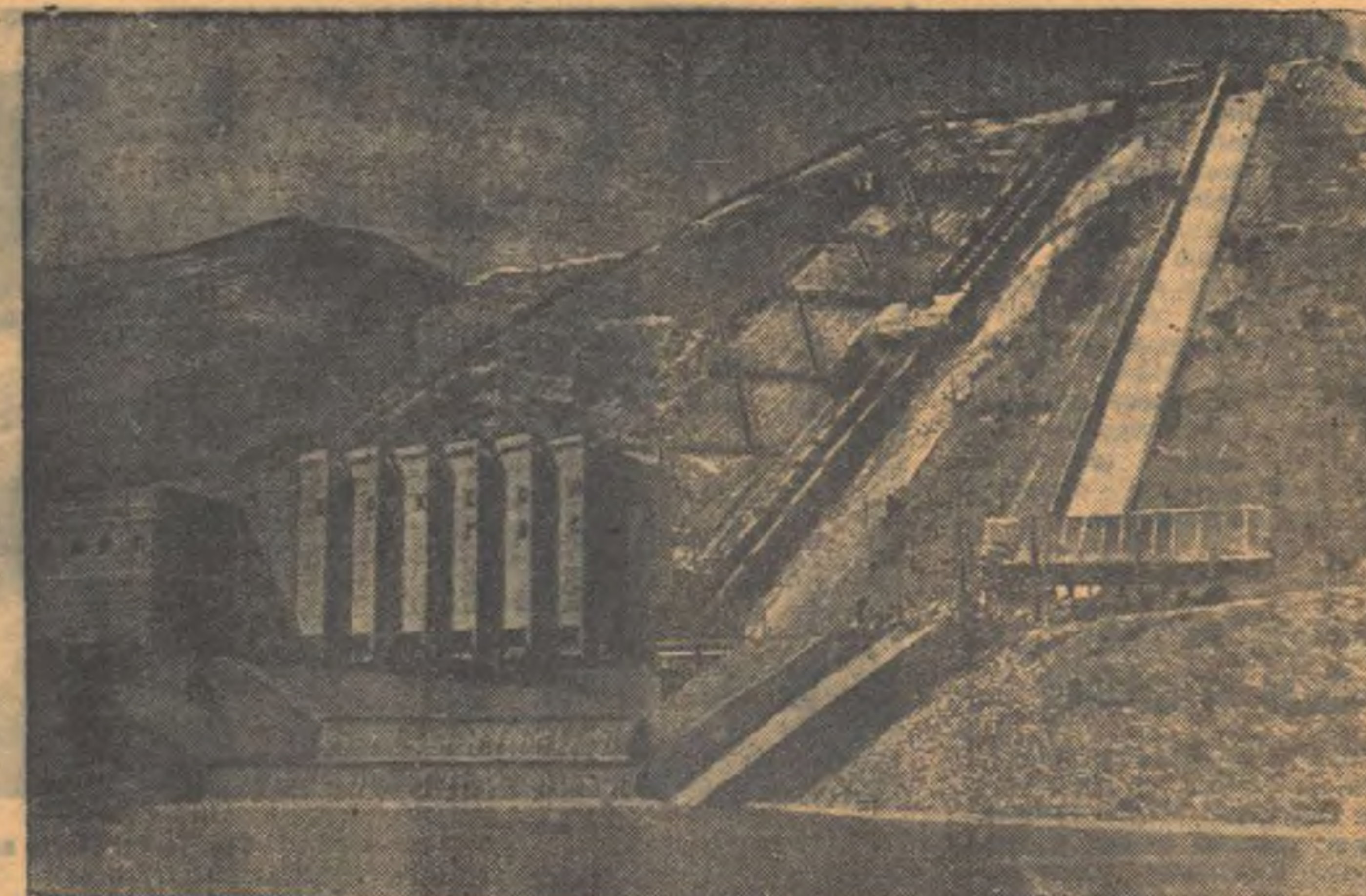
Наилучшее турбинного турки первой очереди Банасанской гидроэлектростанции. На снмке: общий вид Банасанской гидроэлектростанции, напорного трубопровода и водосброса.