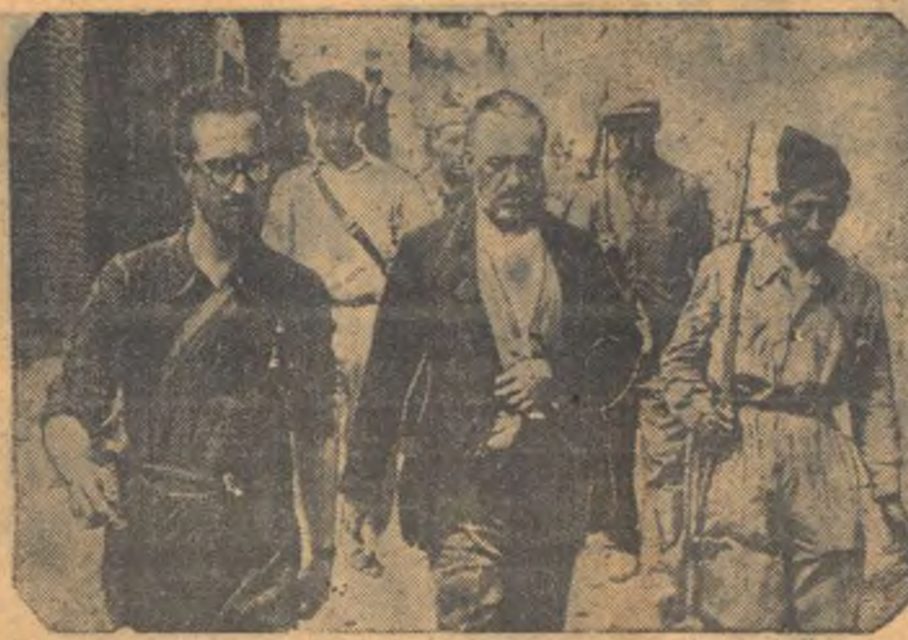
Члены рабочей милиции Испании ведут на допрос фашистского шпиона, арестованного после взятия Сиетамы, на фронте Уэски.

В ответ на оба эти предложения выступил товарищ Литвинов, указавший, что уже имеются обширные материалы относительно этого вопроса, ответы правительства на запросы секретариата Лиги наций, обзор отчета составленного секретариатом. Незадолго до этого товарищ Литвинов предложил, чтобы правительства, которые до настоящего времени не высказывались ни в каком-либо отношении на пленуме Лиги, выступили сейчас. Если нет желающих высказаться, то можно считать документацию исчерпанной, можно сейчас же назначить комитет для дальнейшей разработки и