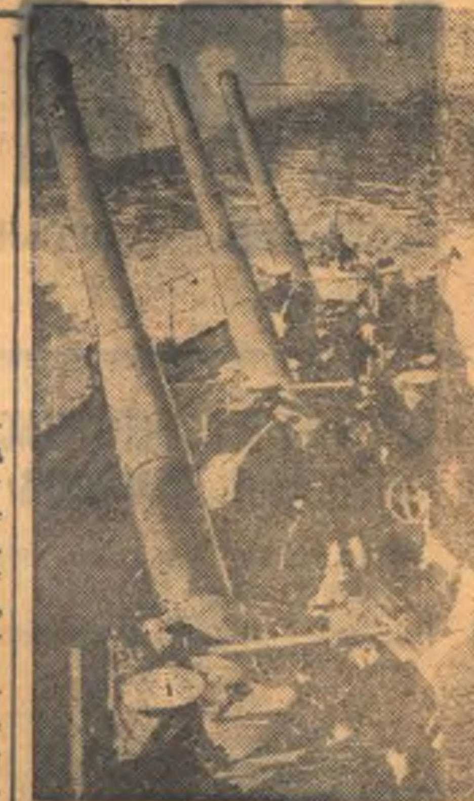
Осенние тактические учения краснознаменного Балтийского флота. На снимке: батарея минометов «Лиса Свердлов» готова к бою.