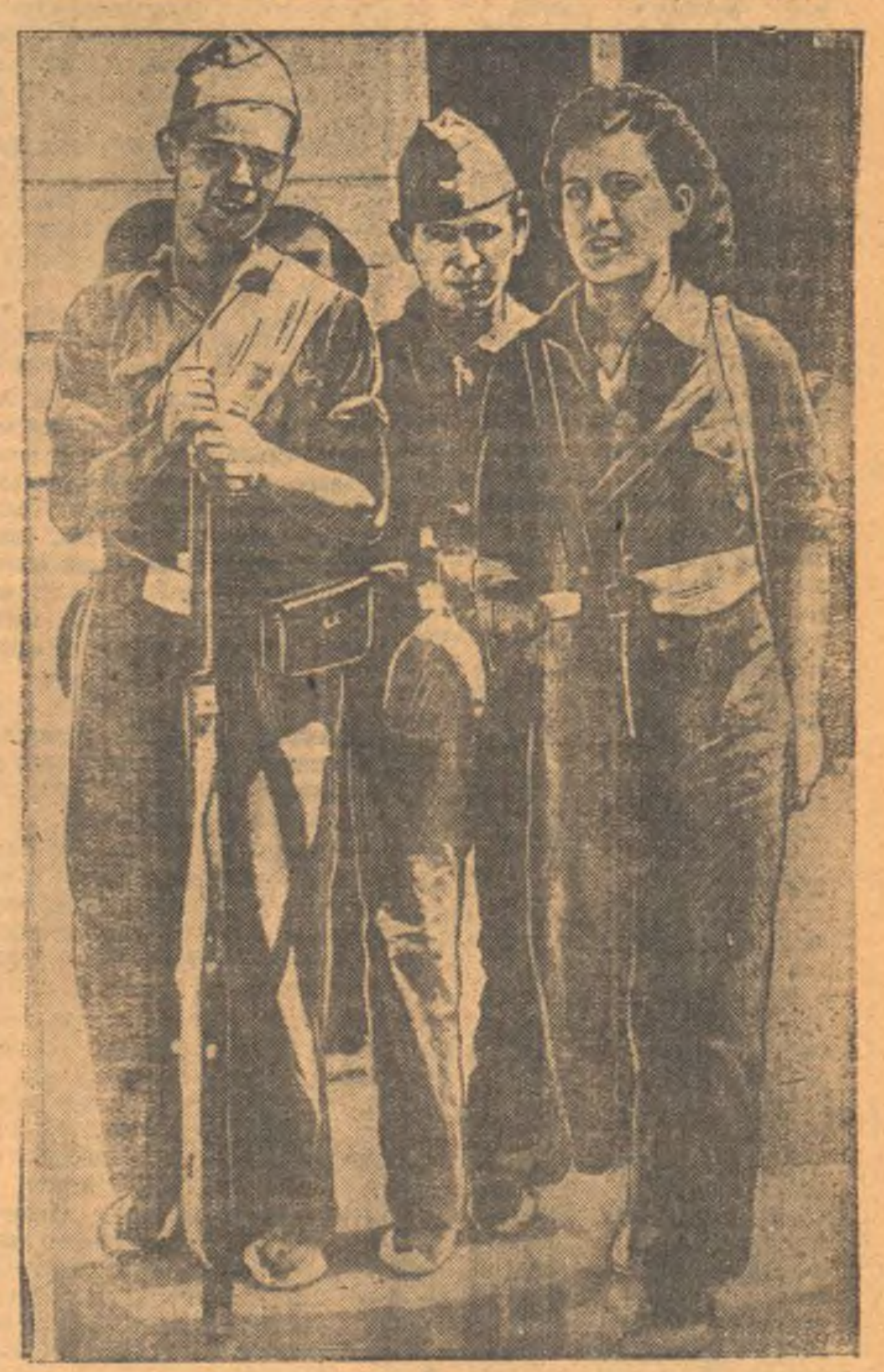
Молодежь — бойцы рабочей милиции на улице Мадрида. (Совзэфото).