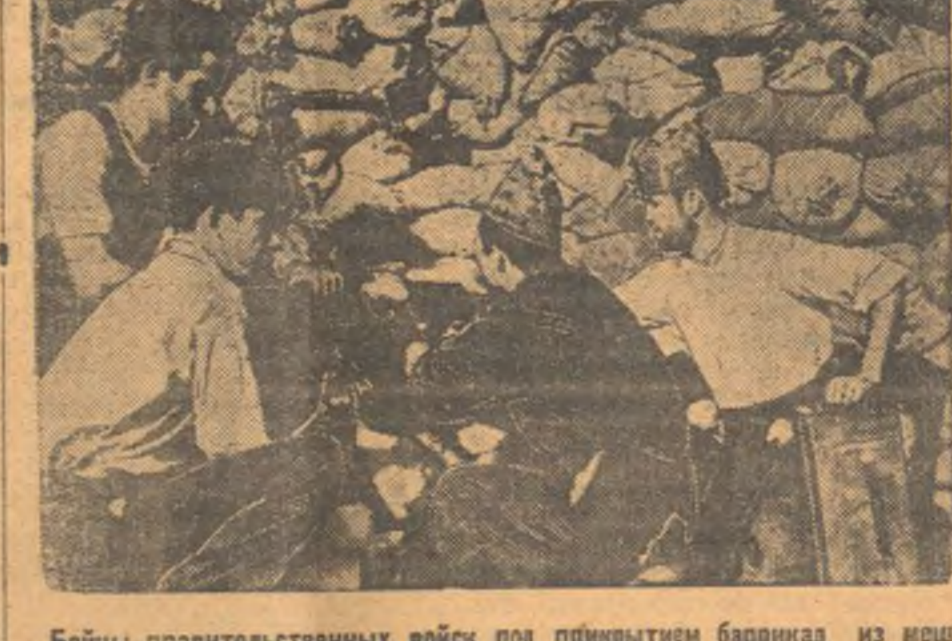
Бойцы правительственных войск под прикрытием баррикад из мешков с песком обстреливают из пулемета позиции мятежников на фронте Буйтраго.

Довольно хороших слов, красивые фразы коммюне на раскладывании взаимных обид. СССР — это есть сто сорок миллионов людей, воодушевленных той же верой, что и мы, верой в социализм — открыто становится на нашу сторону. Меньшего мы и не ждали, большего нам не надо». (ТАСС).