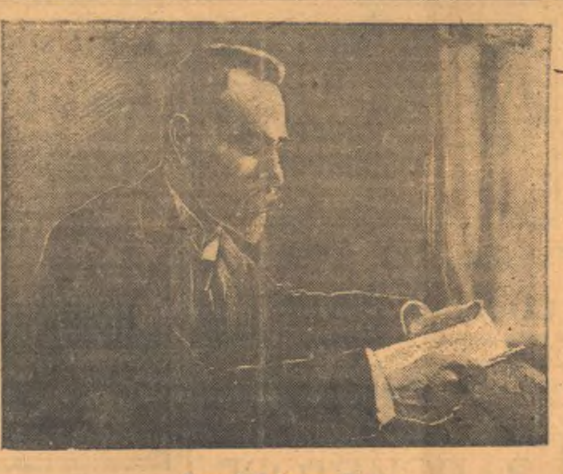
Валерий Яковлевич Брюсов.

ником пролетарской идеологии. У него еще пробуждаются восты шовинизма и буржуазного национализма, которые особенно рельефно проявились в 1914 году. В 1916 году поэт еще не представляет ясно своего пути, не чувствует приближения Февральской буржуазно-демократической революции. Брюсов все же сознает, что он «чужой» вступил во мгу непер, где слышал грозный рев чудовищ, выходя из этих непер и слова шел в цветах, в лучах. Но быстро трюма поэта сошла «под черноту подземных свобод», и он говорит: «Смотрю назад, — во входа нет, Вперед, — во выхода не видно». Его одолевает грусть, бескорыстие и сомнения — найдет ли он дорогу из подземных свобод? «Мне повстречать ли свеча свет, Лунной дышать ли серпантинкой?» Такое сомнение не долго мучает поэта. Брюсов стремительно идет вперед в с бурным достоянием прива-