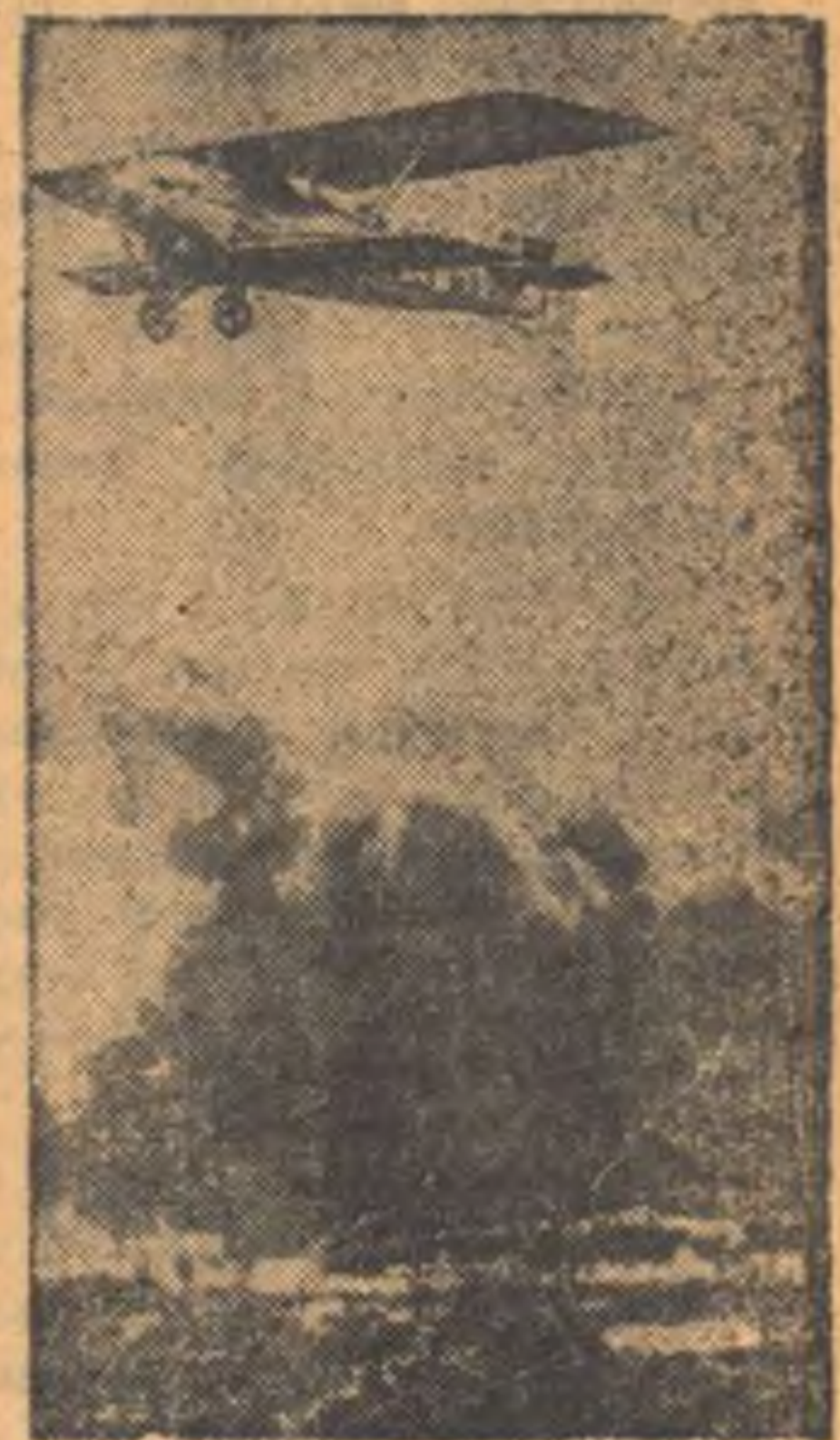
Самолет правительственной авиации бомбардирует позиции мятежников. (Созвездие).

В Мадриде в этот вечер в районе Бухаралос колонна мятежников в составе двух незначительных дивизионов и 500 каменщиков атаковала позиции правительственных войск.