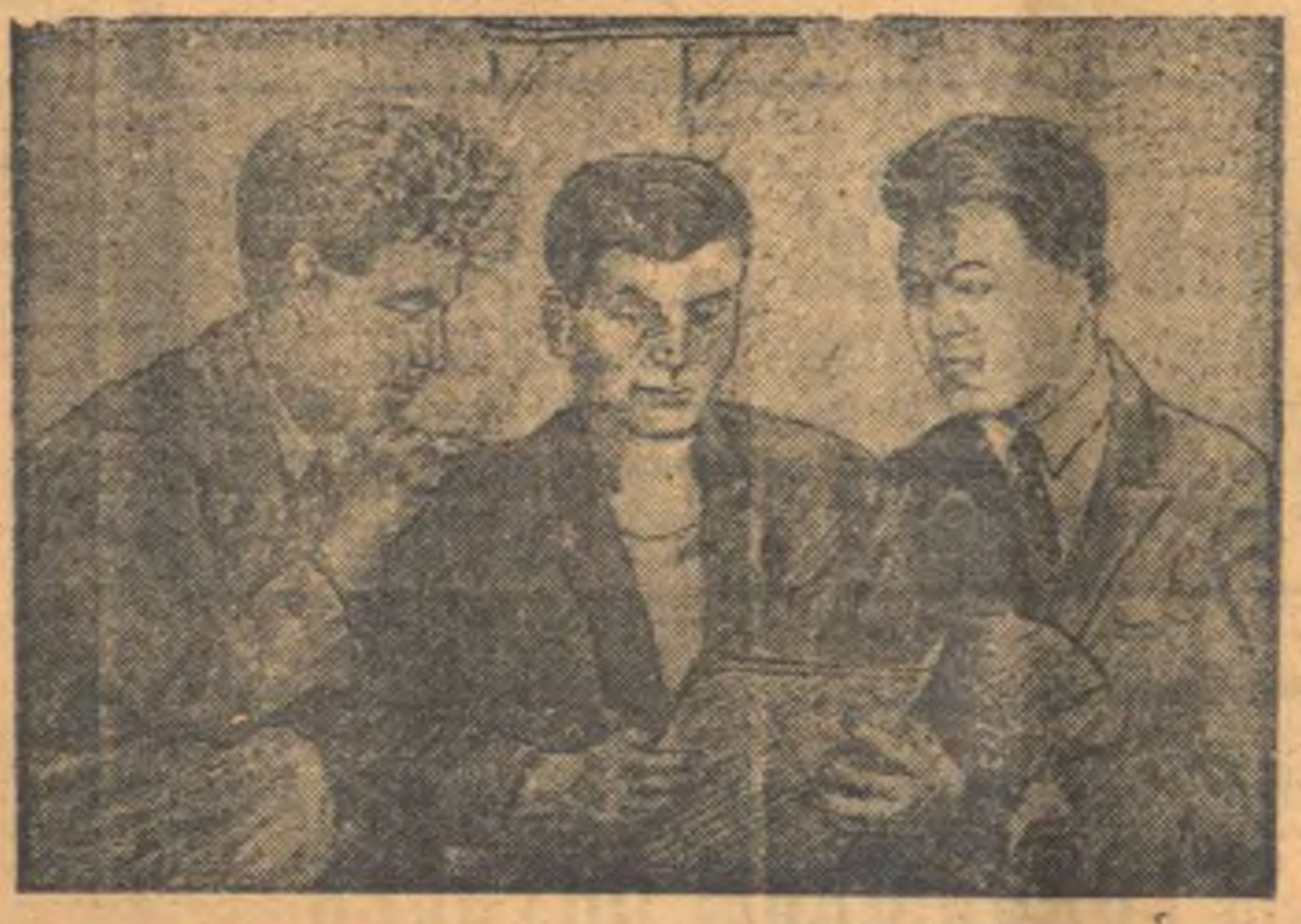
Студенты университета Григорьев, Ралькин и Овсянников знакомятся с отчетом геологической партии, работавшей по изучению Алтая. (Рис. студ. Прокофьева).