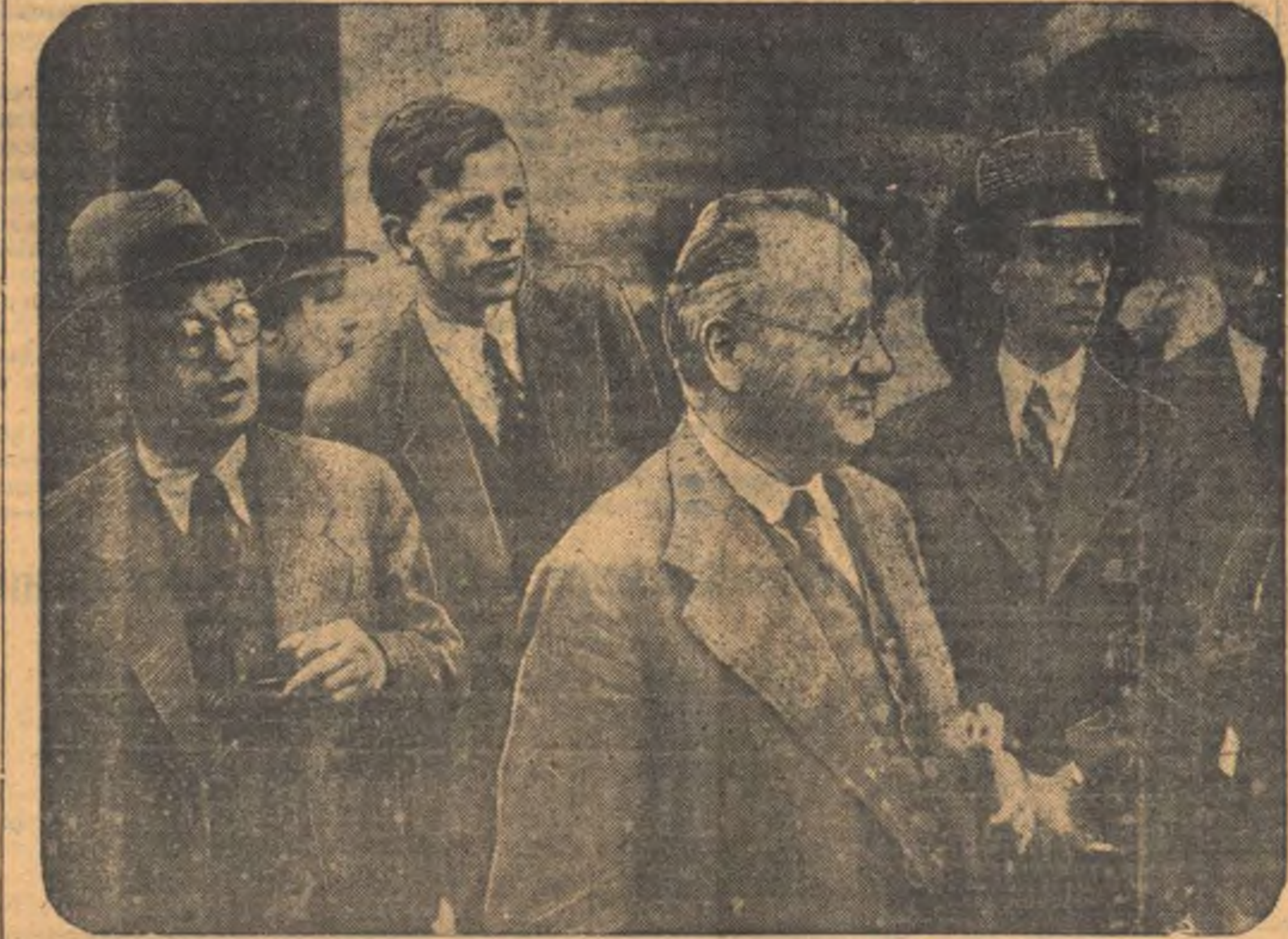
Советская делегация у выхода из здания Лиги наций в Женеве. В центре тов. Литвинов. (Созвездие).

«Юаните» указывает, что язык советского заявления должен быть ясным и простым, чтобы избежать двусмысленности, особенно французского правительства, ибо «гитлеризация Испании» непосредственно угрожает бы Франции.