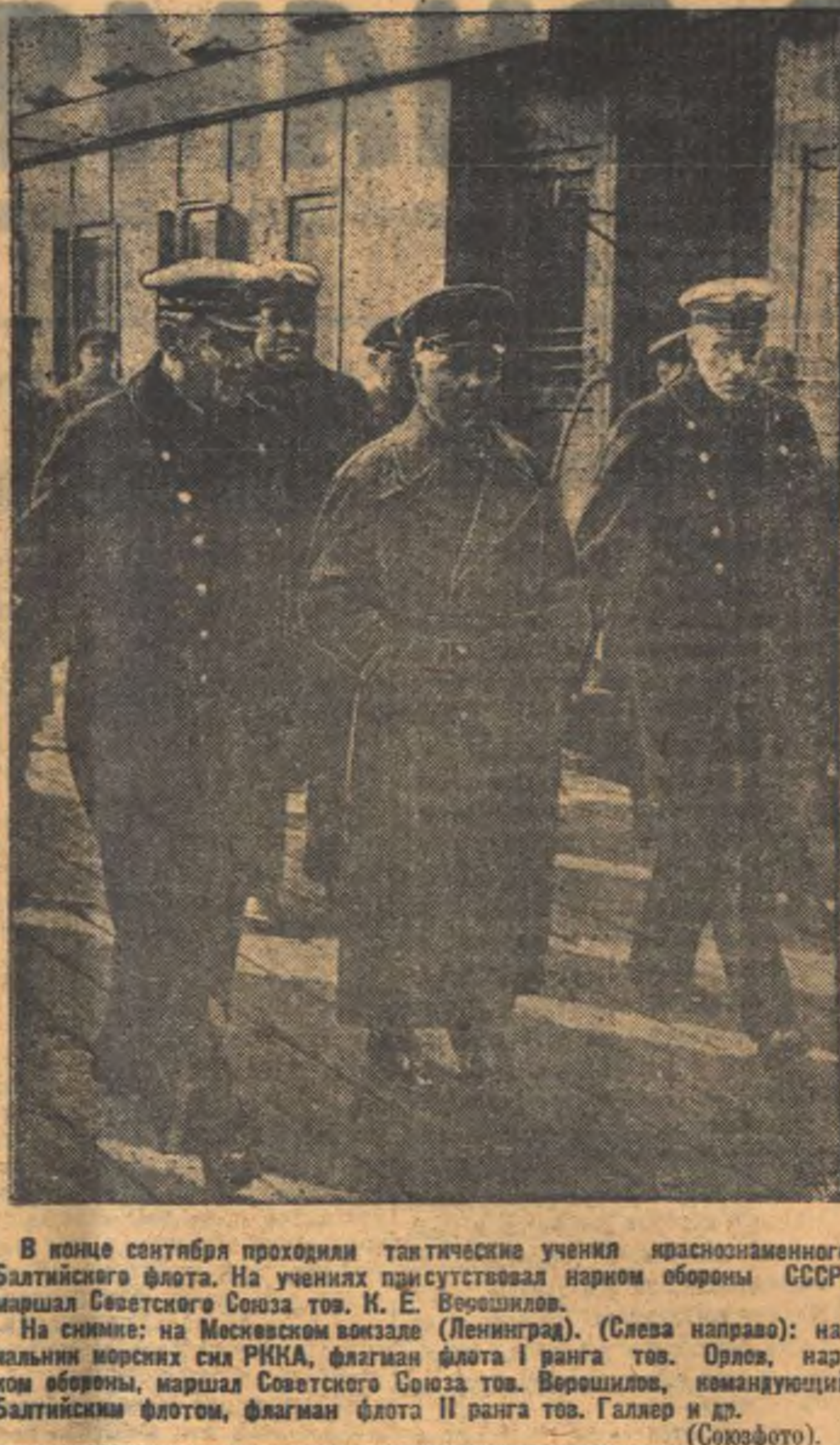
В конце сентября проходили тактические учения красноморского Балтийского флота. На учениях присутствовал нарком обороны СССР, маршал Советского Союза тов. К. Е. Ворошилов.

На снимке: на Московском вокзале (Ленинград). (Слева направо): начальник морских сил РККА, флагман флота I ранга тов. Орлов, нарком обороны, маршал Советского Союза тов. Ворошилов, командующий Балтийским флотом, флагман флота II ранга тов. Галлер и др.