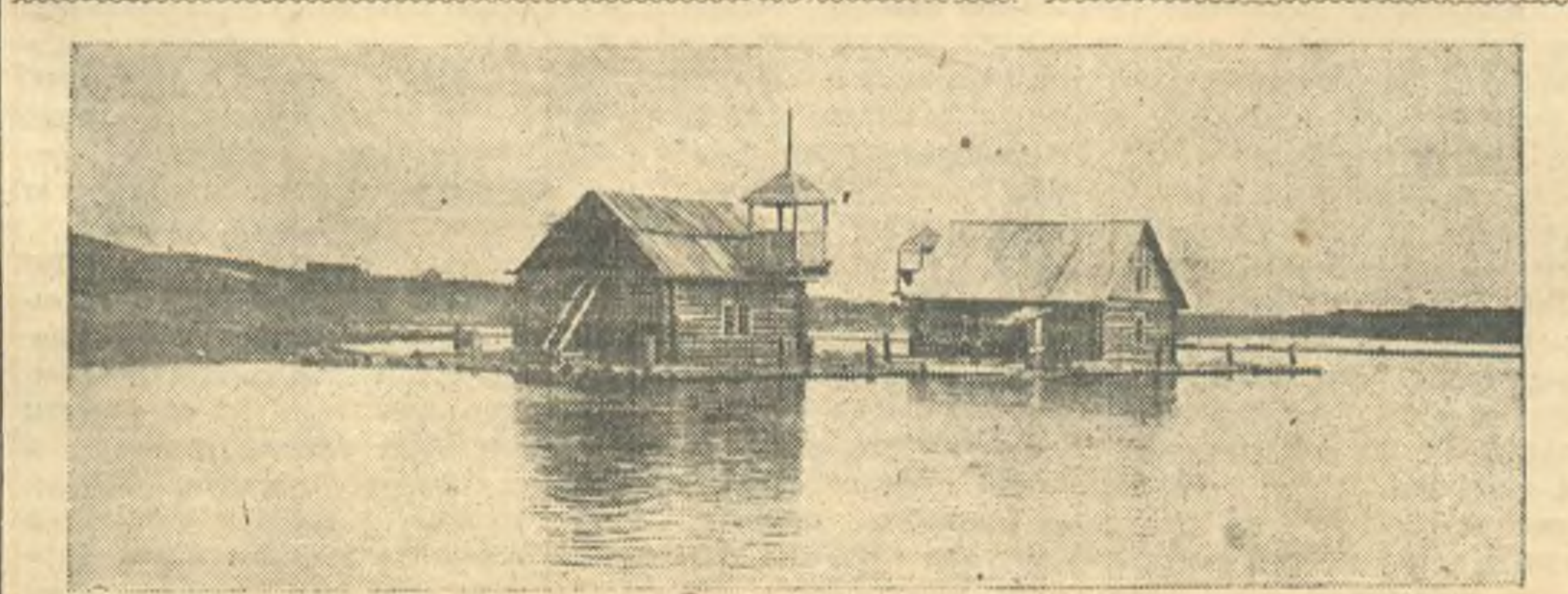
За годы Советской власти на далеком Севере, на безлюдном берегу р. Енисей, вырос новый город и порт Игарка (Красноярский край). На снимке: стандартные сборные домики, отправляемые на плотах из Игарки на остров Диксон для зимовщиков.

Да здравствует наш горячо любимый вождь, учитель и друг товарищ Сталин!