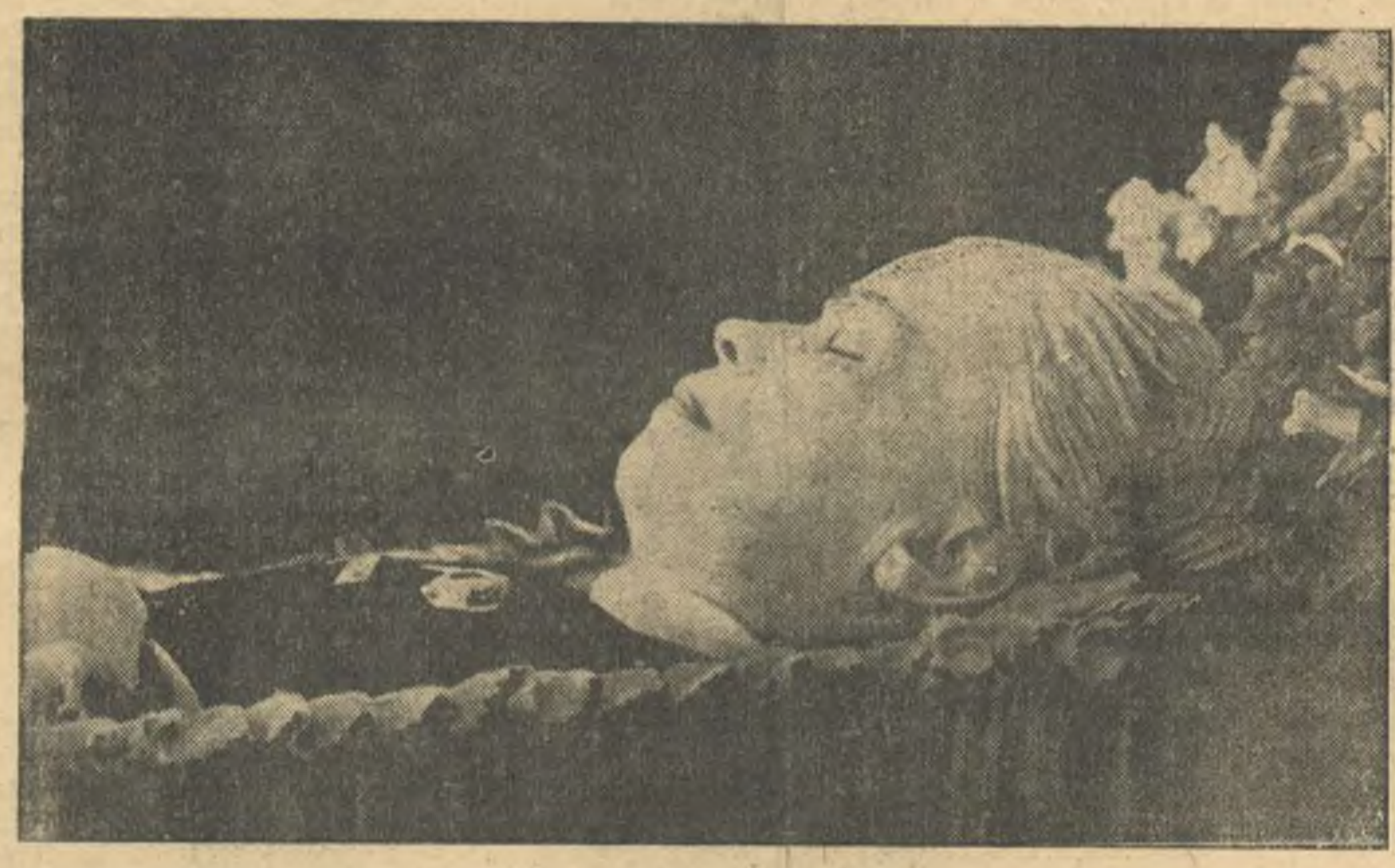
Мария Ильинична Ульянова в гробу.