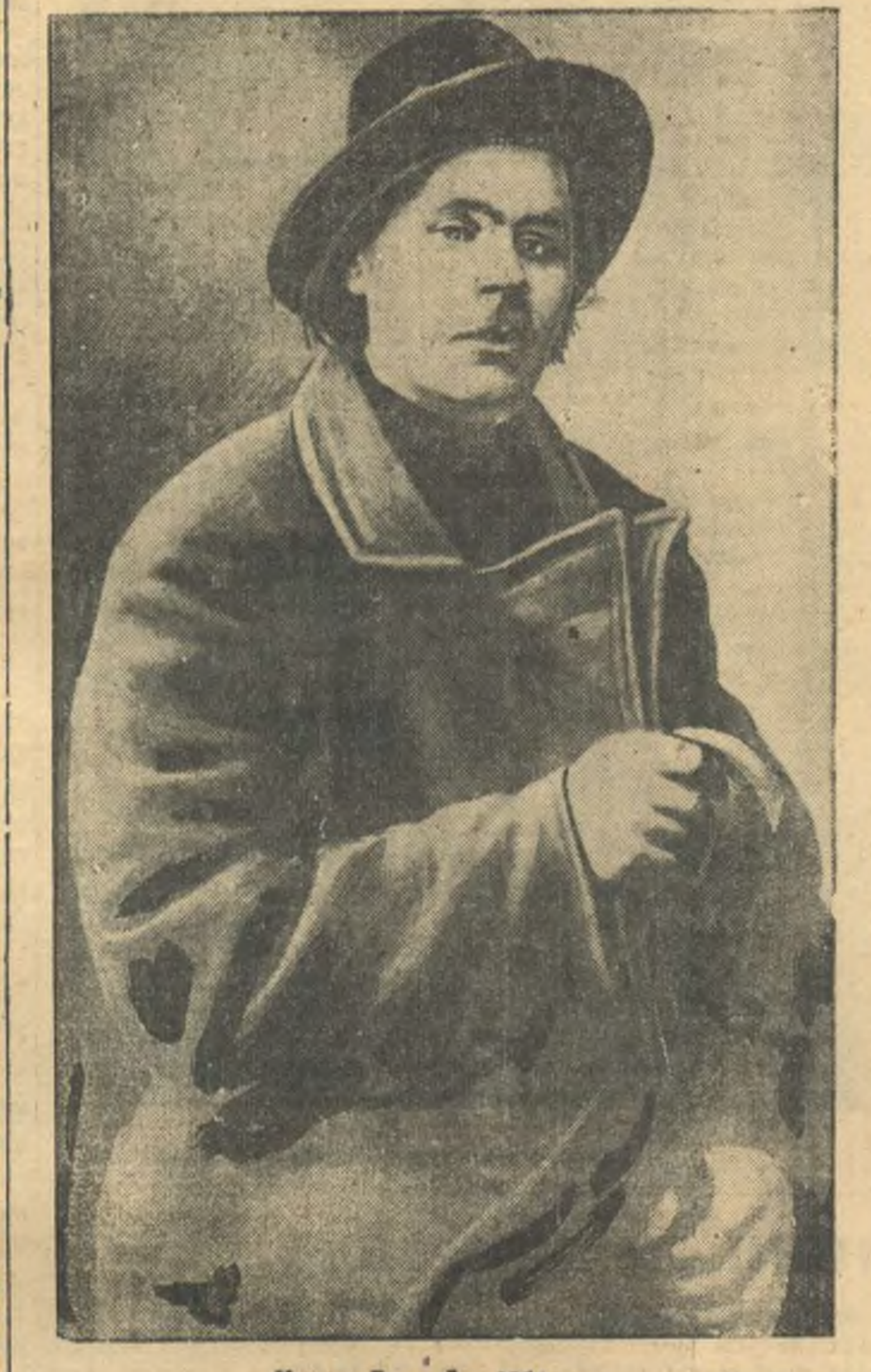
Максим Горький в 1901 году.

боже класса. Вот этот учитель, деятель, строитель нового мира и должен быть главным героем современной драмы».