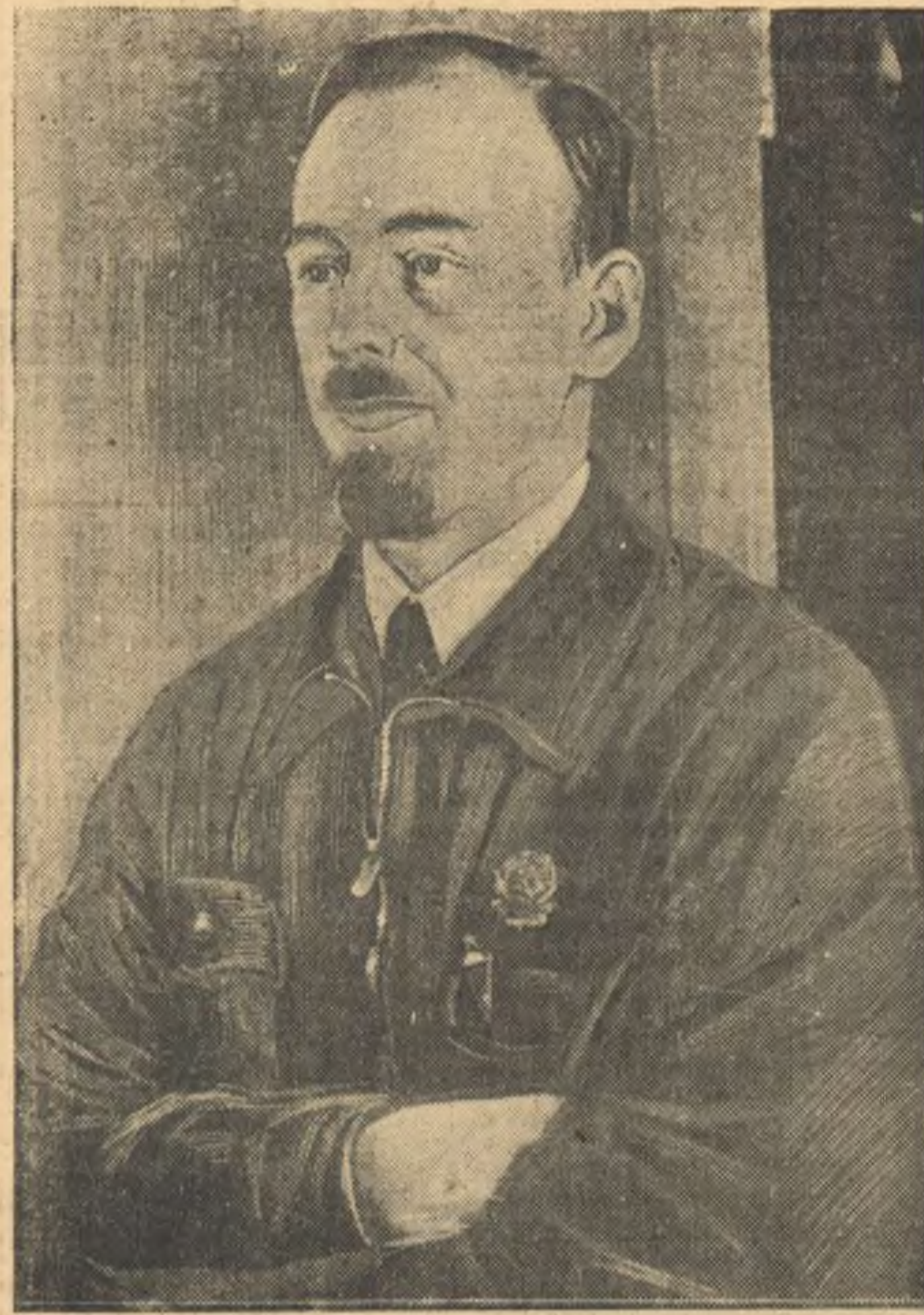
Летчик-орденоносец Ф. Б. Фарих.

— Гнусные предатели, — сказал т. Фарих, — пытались продать нашу родину фашистским поджигателям войны. Пусть знает фашистское отребье, что советские летчики отстают свою великую родину от посягательства любых врагов. (ТАСС.)