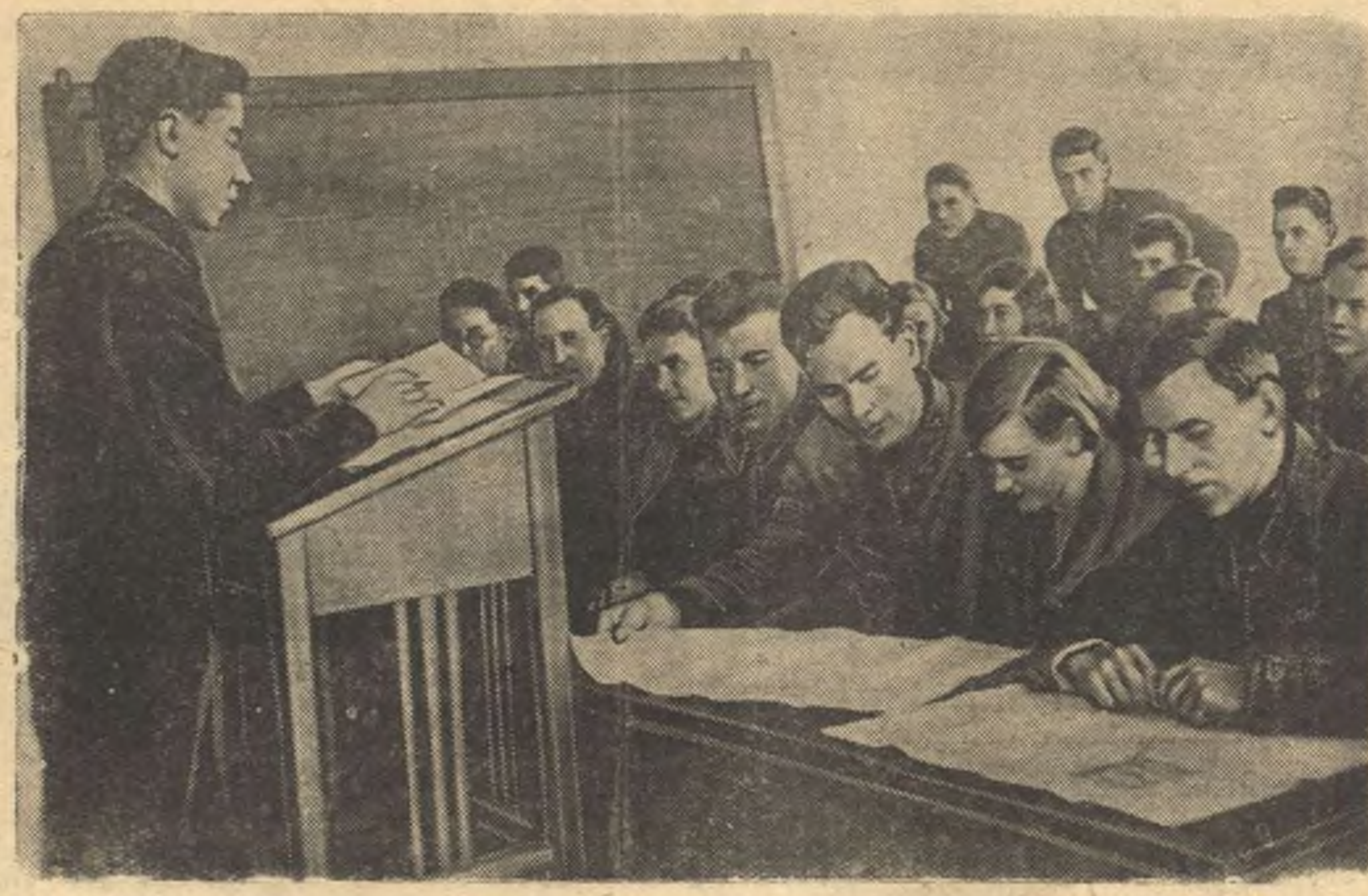
Электромеханический институт инженеров транспорта. Круглом комсомольской политучебы за изучением «Положения о выборах в Верховный Совет СССР». Занятие ведет руководитель кружка тов. Александров.

МОСКВА, 17 сентября. (ТАСС.) Сто девятнадцать заявок на участие во Всесоюзной сельскохозяйственной выставке поступило из Хомяковского района (Северная область). В качестве экспонатов колхозы готовы выставить 17 хомяковских быков, 47 голов с рекордными урожаями. Среди них корова «Руба», за 216 дней давшая 7126 литров молока.