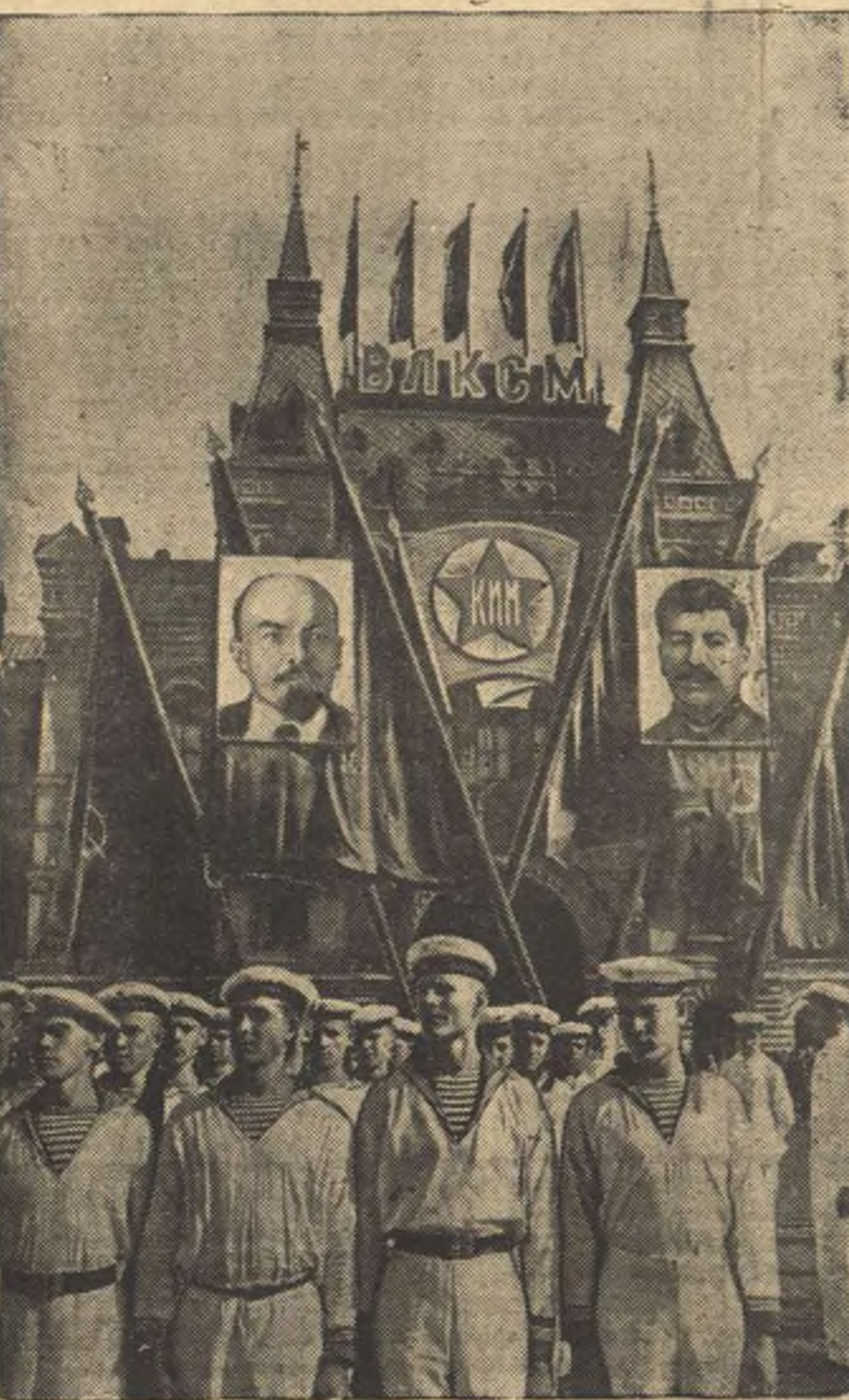
12 сентября в Москве на Красной площади состоялась мощная демонстрация, посвященная празднованию XXIII Международного юношеского дня. На снимке: колонна моряков Осовиахима на Красной площади. (Совзафото).

ЛОНДОН, 16 сентября. (ТАСС). На английский пароход «Хиллсфорд» возвращавшийся из Хихона в Ла Палис, 13 сентября напал вооруженный трайлинг мятеежников.