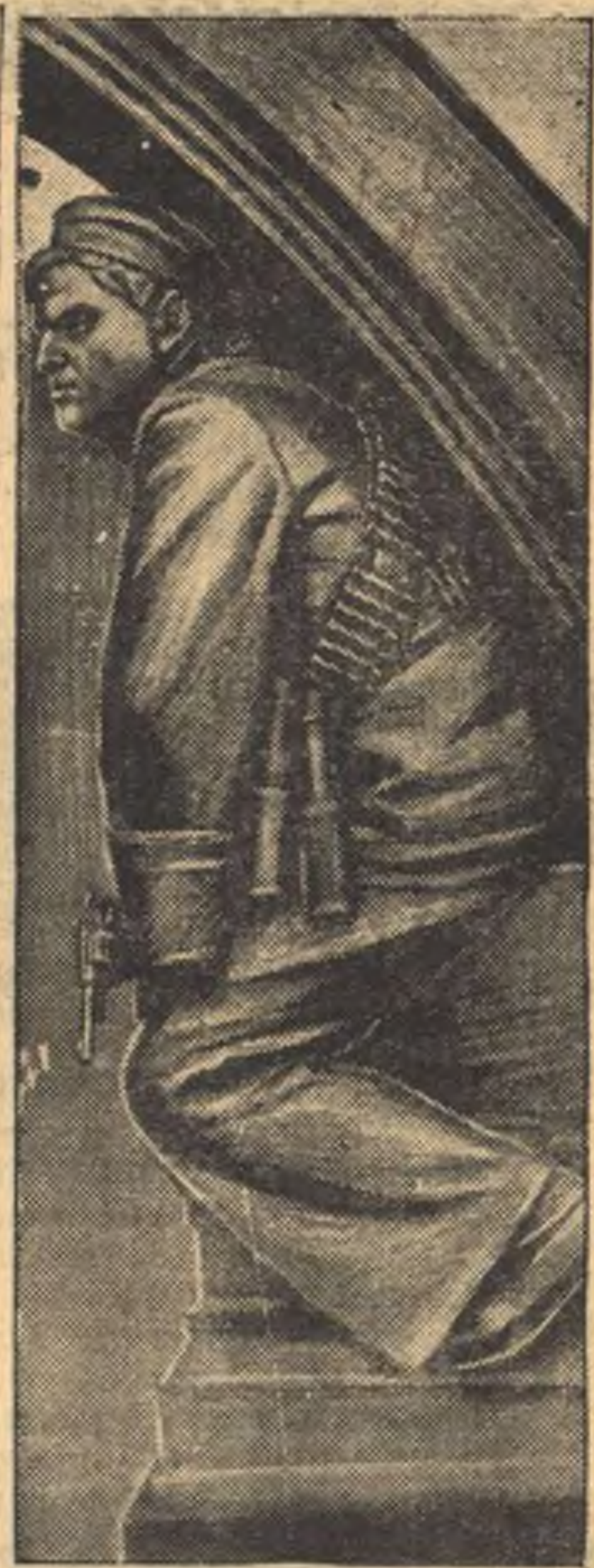
Мастерская спецработ Метростроя изготовила макет станции метро 2-ой очереди «Площадь Революции» (в натуральную величину) по проекту архитектора Душкина...