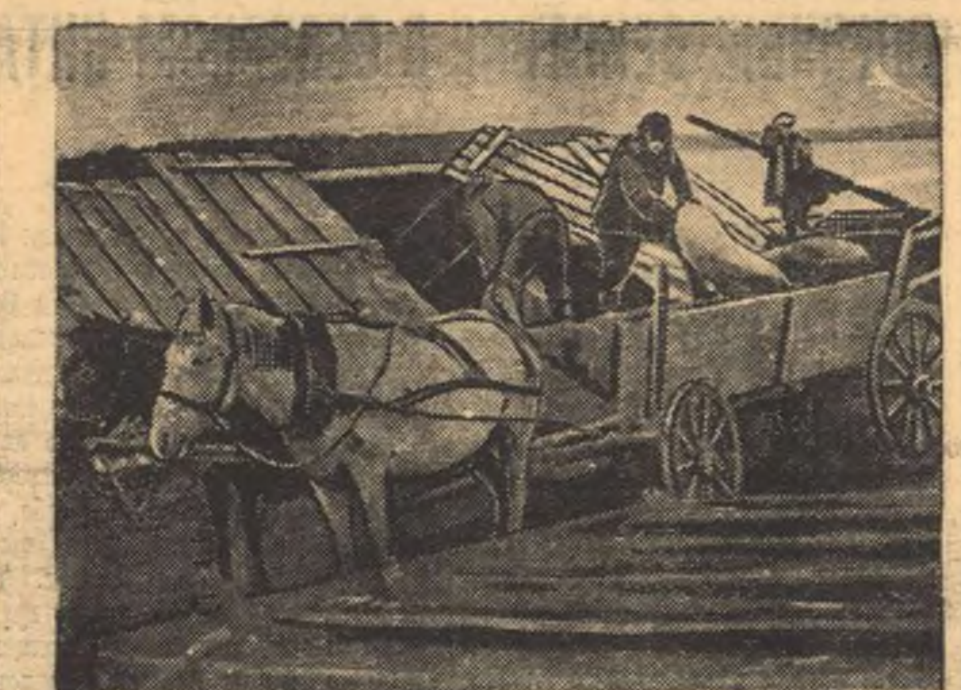
Колхоз «8 марта», Коларовского сельсовета. Погрузка осы для отправки на заготовку.

Считаем своей обязанностью выразить благодарность за внимательное и нам отношение.