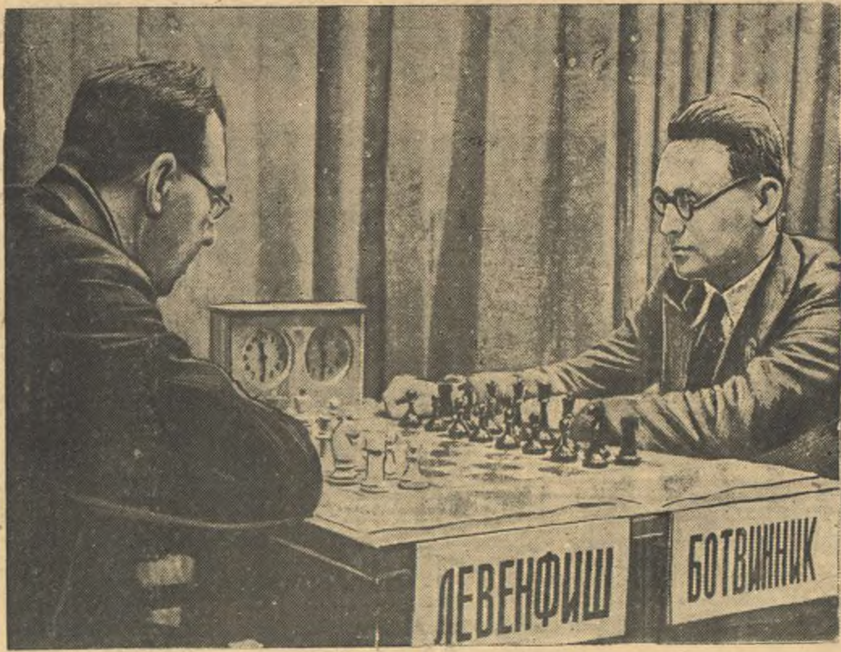
5-го октября в Большой аудитории Политехнического музея (Москва) начался шахматный матч на первенство СССР между М. М. Ботвинником и Г. Я. Левенфишем. На снимке: момент шахматного матча. (Союзфото).

В северной части провинции Шаньси 8 октября японские войска заняли Госань (юго-западнее Дайчаоу). Левый фланг китайских войск на этом фронте успешно наступает на Нин-у (на северо-запад от Госаня).