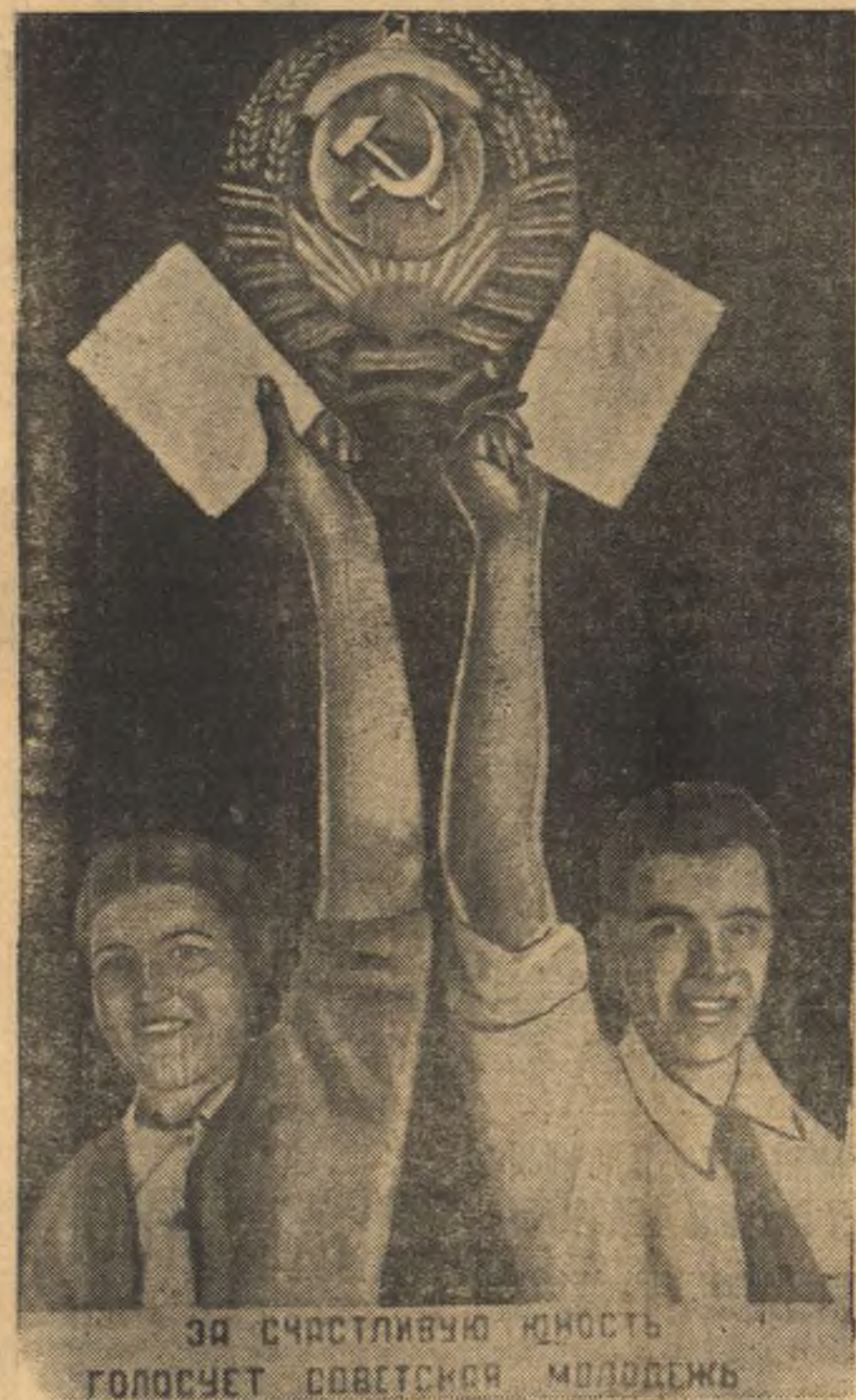
Планет художника В. Корочного, издаваемый ИЗОГИЗ'ом и выбором в Верховный Совет СССР.