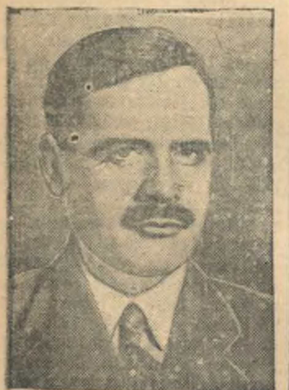
Секретарь ЦК ВКП(б) А. А. Андреев — баллотируется в депутаты Совета Союза по Ашхабадскому избирательному округу, Туркменской ССР.