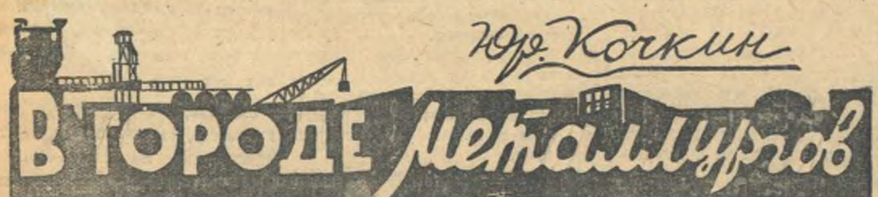
В ГОРОДЕ МЕТАЛЛУРГОВ

Сталинск. В морозном воздухе уходящего дня слышится влекательная панорама.