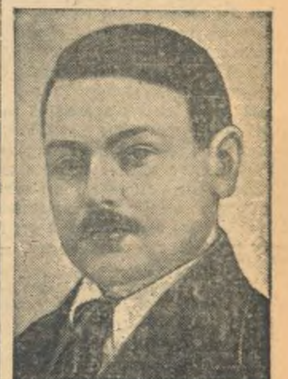
Секретарь ЦК ВКП(б), Ленинградского областного и городского комитетов ВКП(б) А. А. Жданов — баллотируется в депутаты Совета Союза по Володарскому избирательному округу г. Ленинграда.