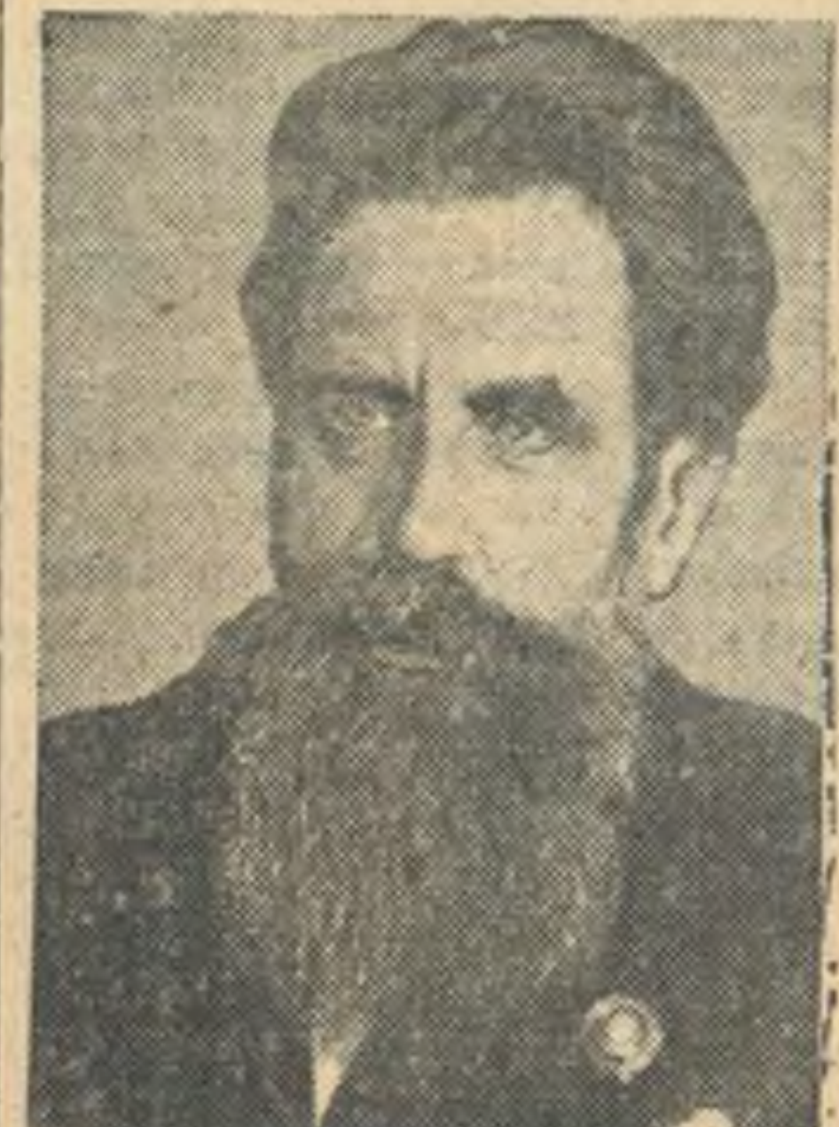
Начальник Главсевморпути — Герой Советского Союза Отто Юльевич Шмидт — баллотируется в депутаты Совета Национальностей по Казанскому избирательному округу.