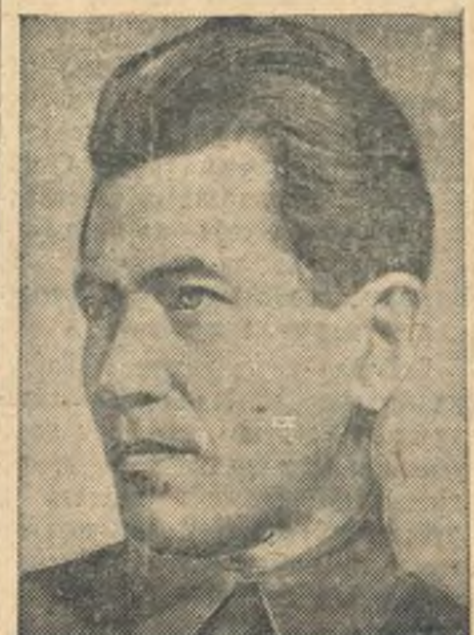
Народный комиссар внутренних дел СССР Николай Иванович Ежов — баллотируется в депутаты Совета Союза по Горьковскому-Ленинскому избирательному округу.