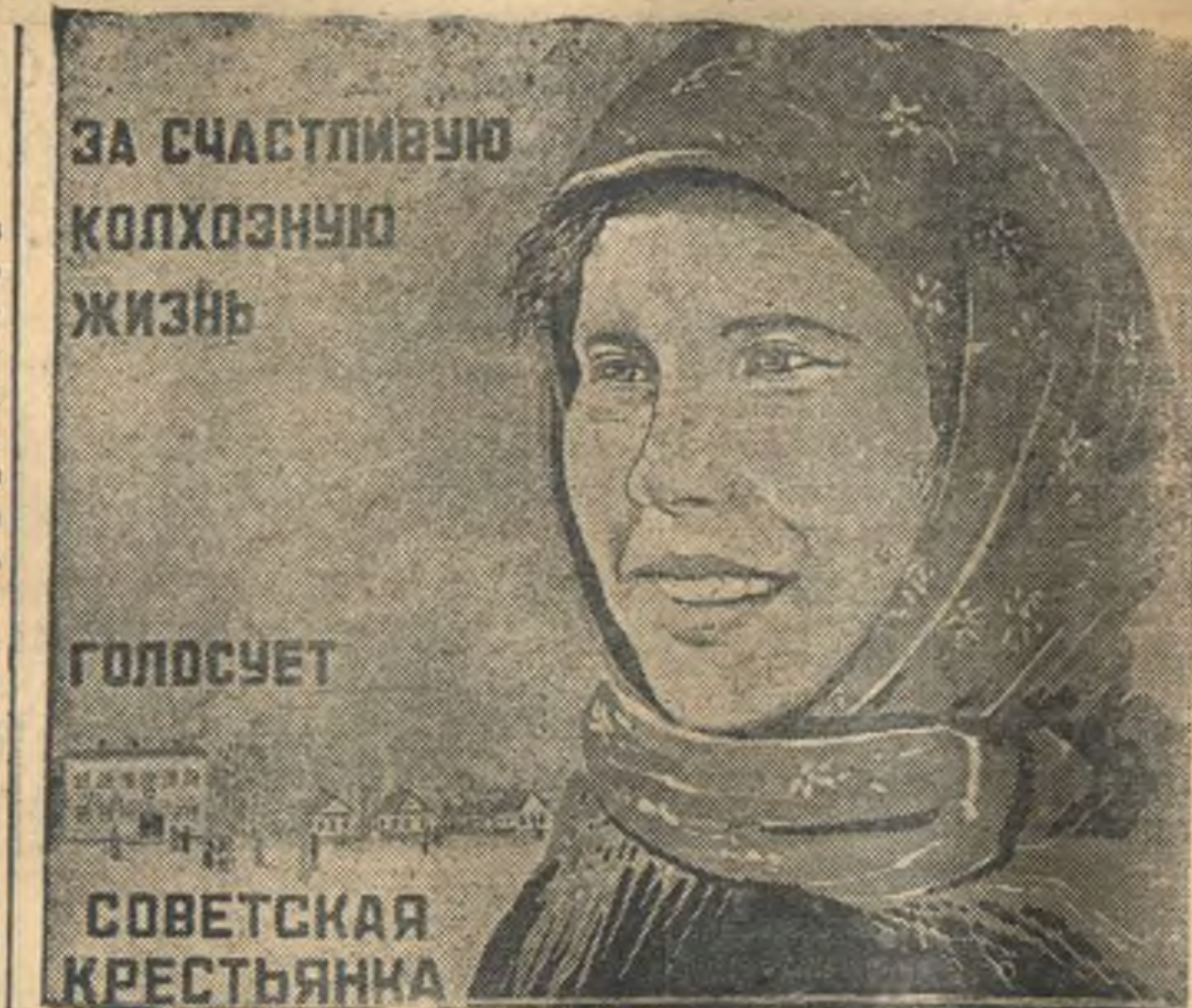
К выборам в Верховный Совет СССР. Планет художника Е. Мельникова, выпущенный Изогизом.

Во время недавней попытки бомбардировать республиканское побережье, «Канариас» попал под огонь республиканских береговых батарей. Крейсеру были нанесены значительные повреждения. Из команды крейсера убито 2 и ранено 16 человек.