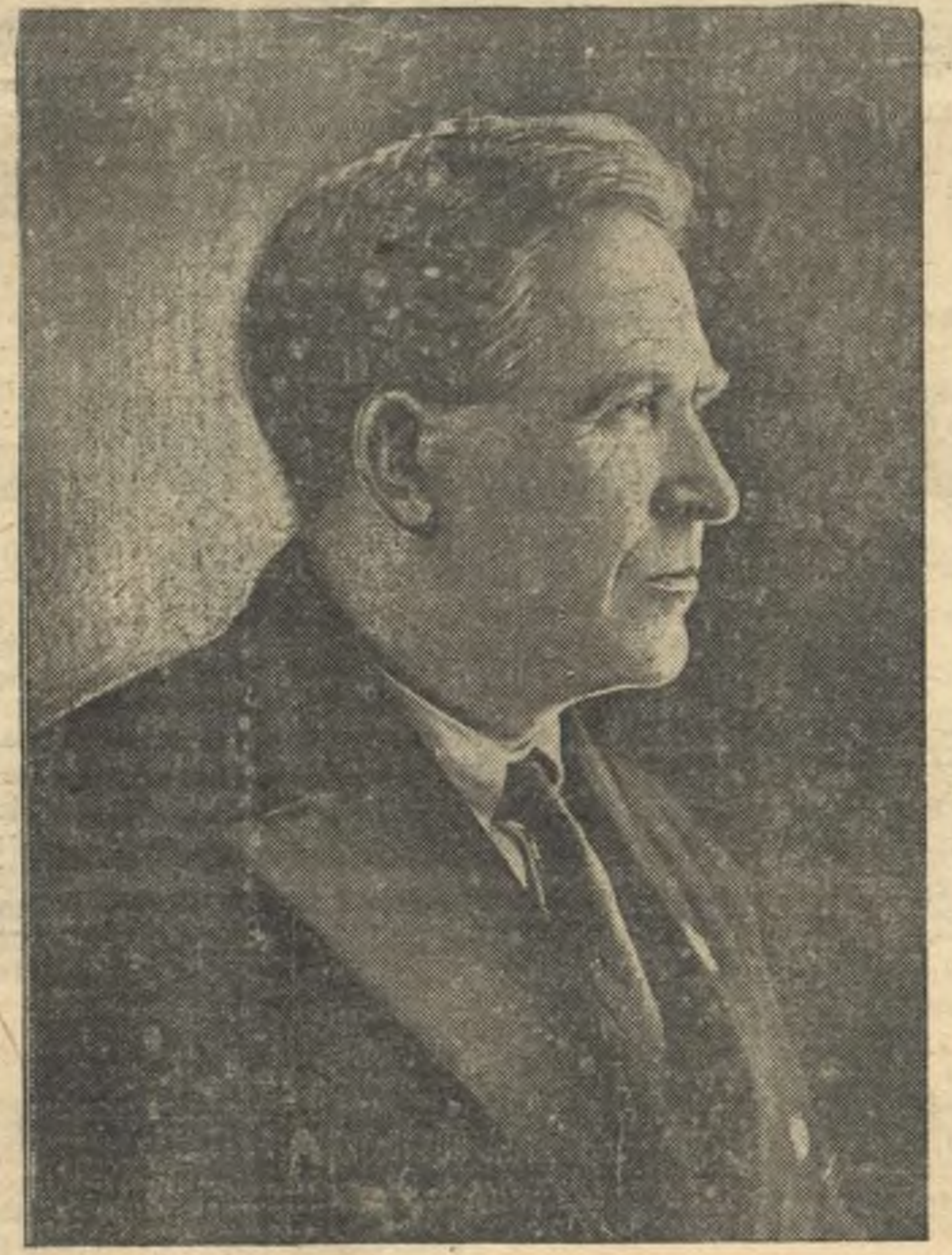
Академик ИВАН ПАВЛОВИЧ БАРДИН — депутат в Совет Союза Верховного Совета СССР от Томского городского избирательного округа.

Мы все, как один, не шая сил и самой жизни, будем отстаивать неприкосновенность священных рубежей нашей родины.