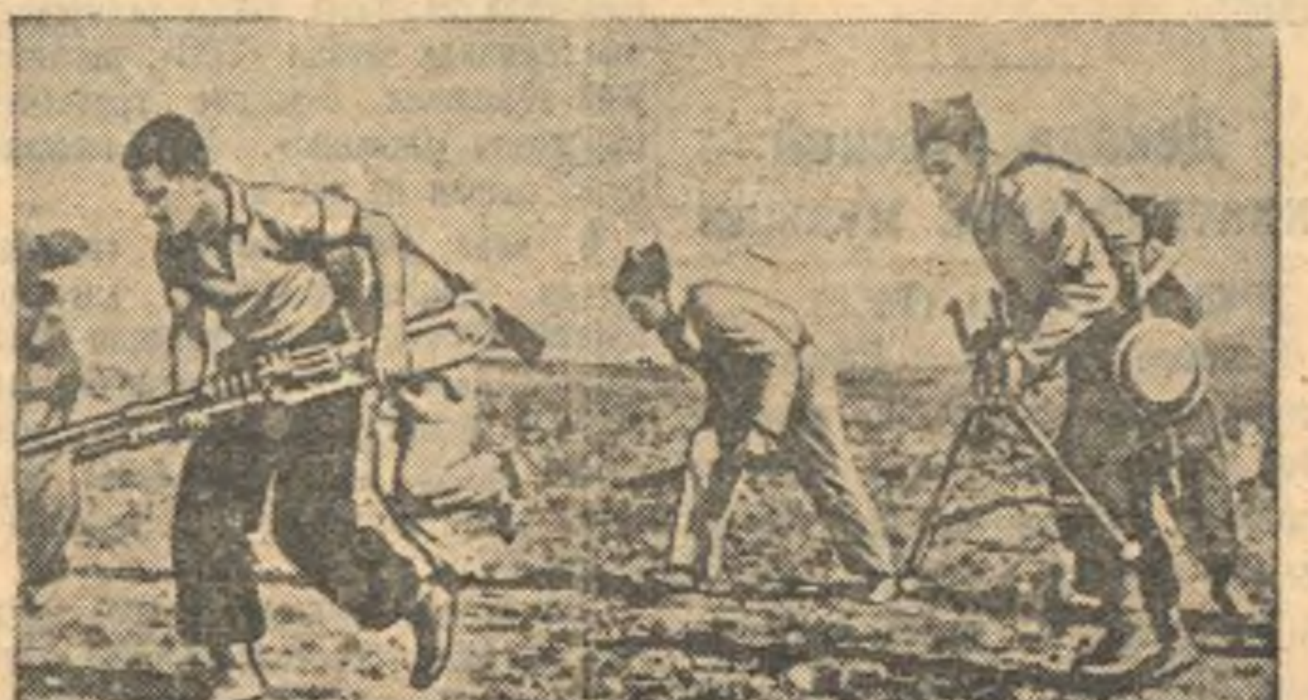
На фронтах в Испании. На снимке: группа республиканских пулемет-чиков занимает новые позиции, оставленные фашистами (центральный фронт).

Республиканская артиллерия бом-бардировала позиции мятежников в Университетском городке. Артиллерия мятежников 26 декабря подвергла бомбардировке Мадрид Снарады пада-ли в рабочих кварталах и в центре города, где на улицах, по слухам хо-рошей погоды, было много людей. Один из снарядов разорвался в теат-ре. В результате бомбардировки Ма-дрида имеются убитые и раненые.