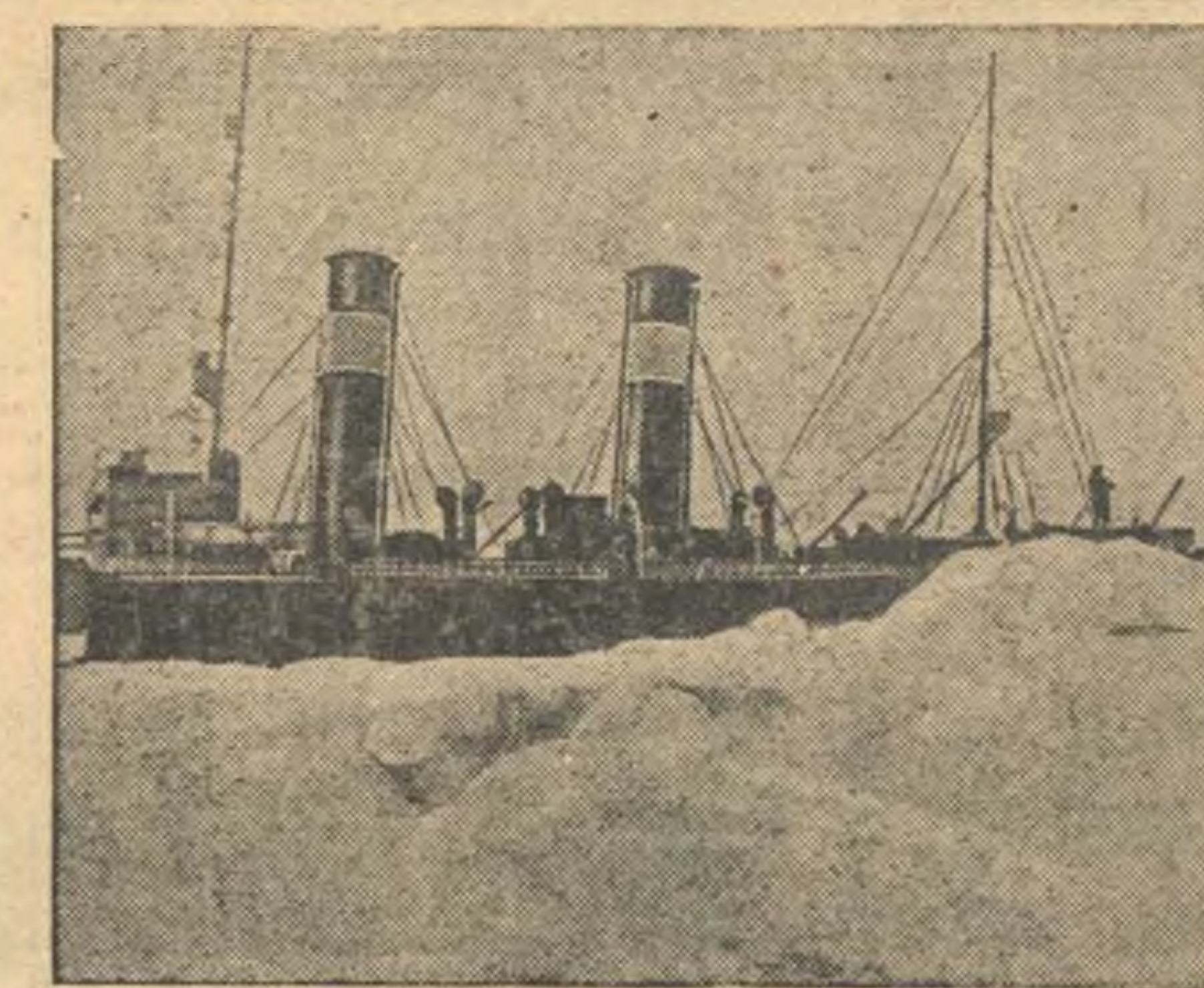
В навигацию 1937 г. краснознаменный ледокол «Красин» провел в восточном секторе Антики ряд ответственных морских операций. Основными мероприятиями экспедиции на ледоколе «Красин» были: проводка грузопассажирского парохода «Анадырь» и острову Врангеля, участие в поисках самолета С. Леваневского и помощи судам, идущим с запада на восток. На снимке: «Красин» во льдах.

ПАРИЖ, (ТАСС). По сообщению Гавис из Танжера, советский грузовой пароход «Шпор», нахопившийся близ Гибралтара, 23 декабря перешел по радио, что он задержан и отведен в Сеуту.