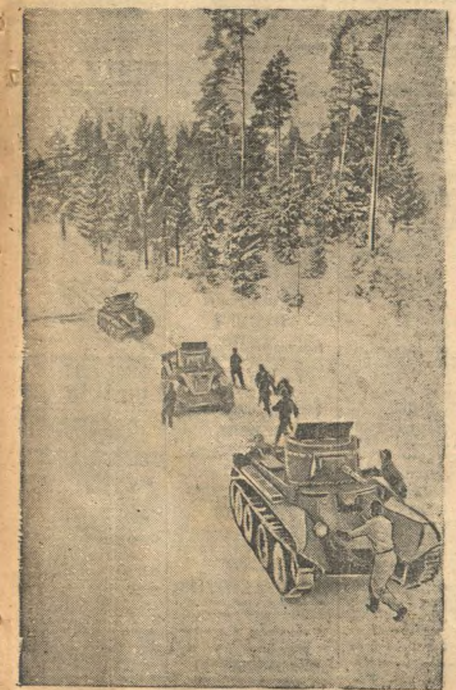
Зимние тактические учения Н-ской части РККА. На снимке: момент атаки «По танкам».