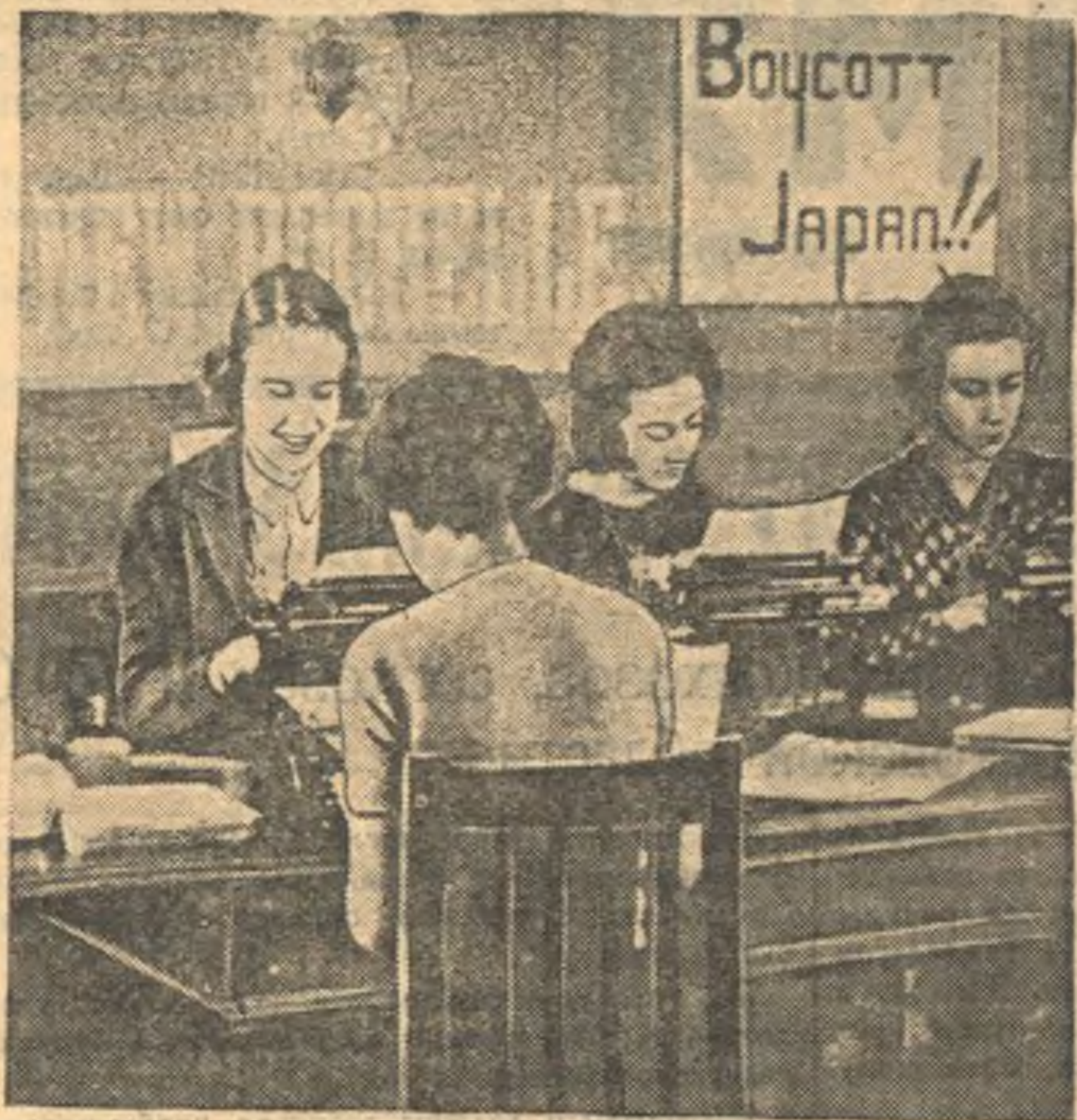
Школьницы г. Нью-Рошель (Соединенные штаты Америки) принима-ют активное участие в кампании бойкота японских товаров. На снимке: школьницы печатают листовки, призывающие к бойкоту японских товаров. На стене плакат — «Бойкот Японии».