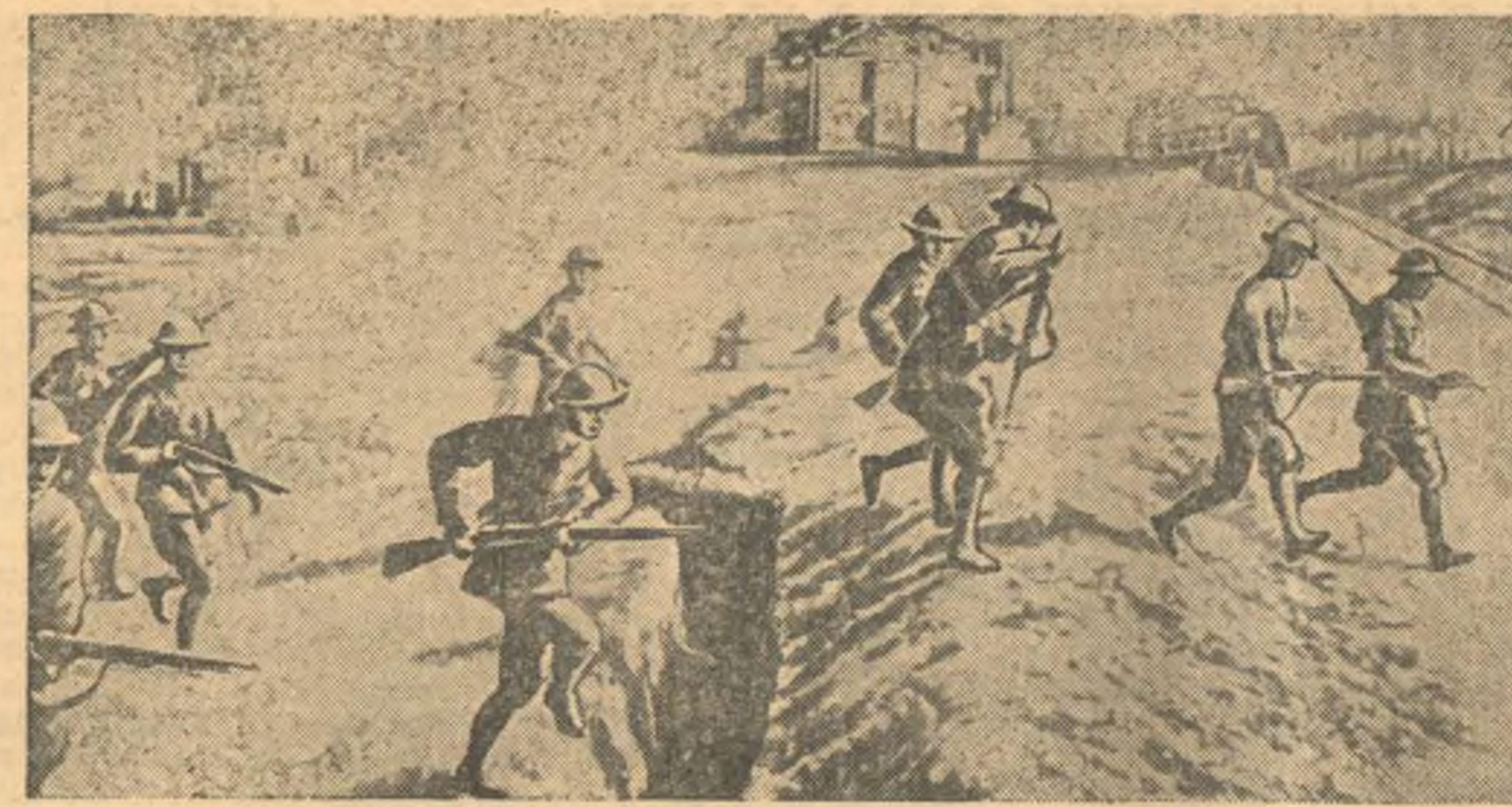
Бойцы китайской армии в наступлении (Центральная Китай). (Союзфото).