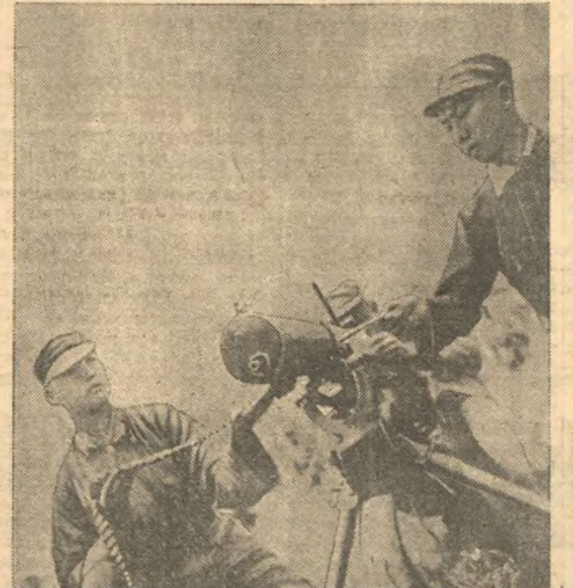
Пулеметчики 8 национально-революционной армии Китая.

По сведениям штаба 8-й китайской армии, японские войска с танками и артиллерией перебросились в северную часть провинции Шаньси для проведения кампании (по отчету от партизан, по они оказываются бессильными против партизан и частей 8-й армии, действующих в тылу японских войск).