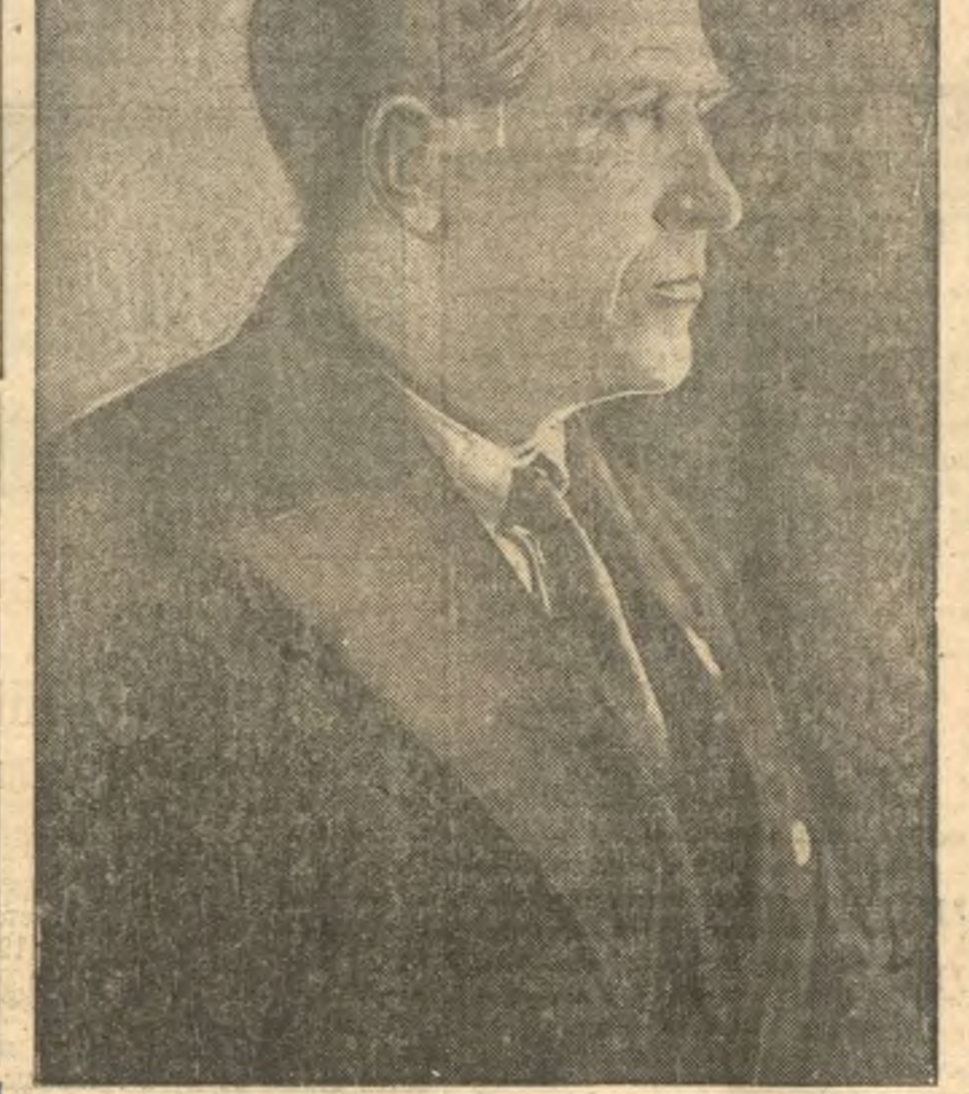
Депутат Верховного Совета СССР, академик ИВАН ПАВЛОВИЧ БАРДИН.