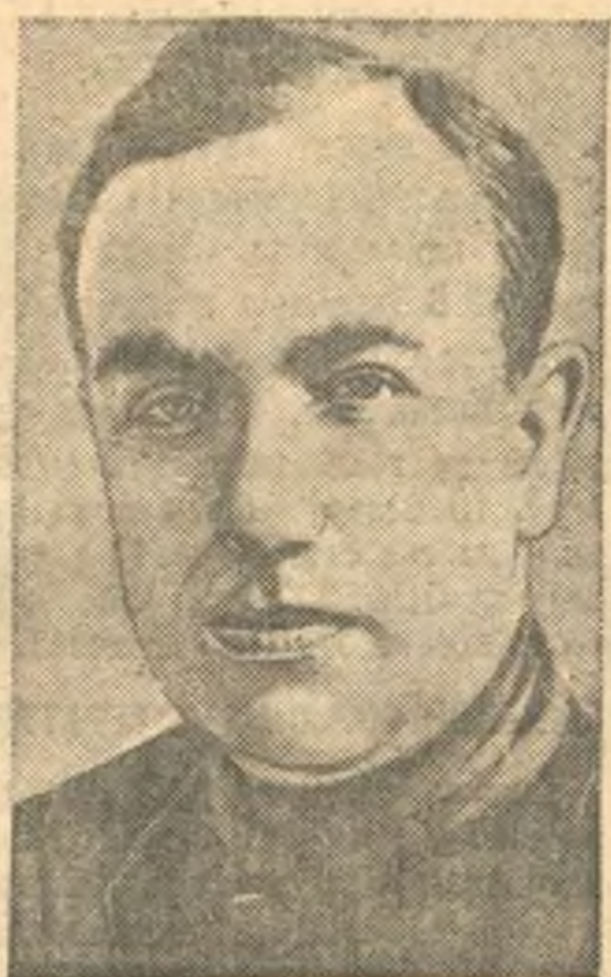
И. И. АЛЕКСЕЕВ—первый секретарь Новосибирского обкома ВКП(б).