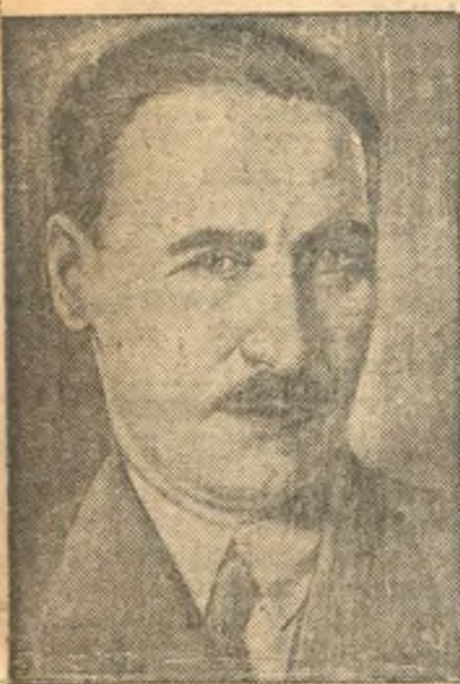
Р. И. ЗЯХЕ—народный комиссар земледелия СССР.