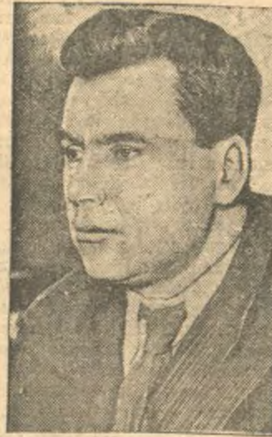
К. И. БУТЕНКО—заместитель народного комиссара тяжелой промышленности СССР.