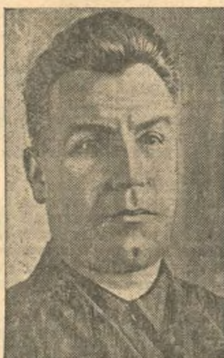
Н. Ф. ЛОБОВ—секретарь Новосибирского обкома ВКП(б).