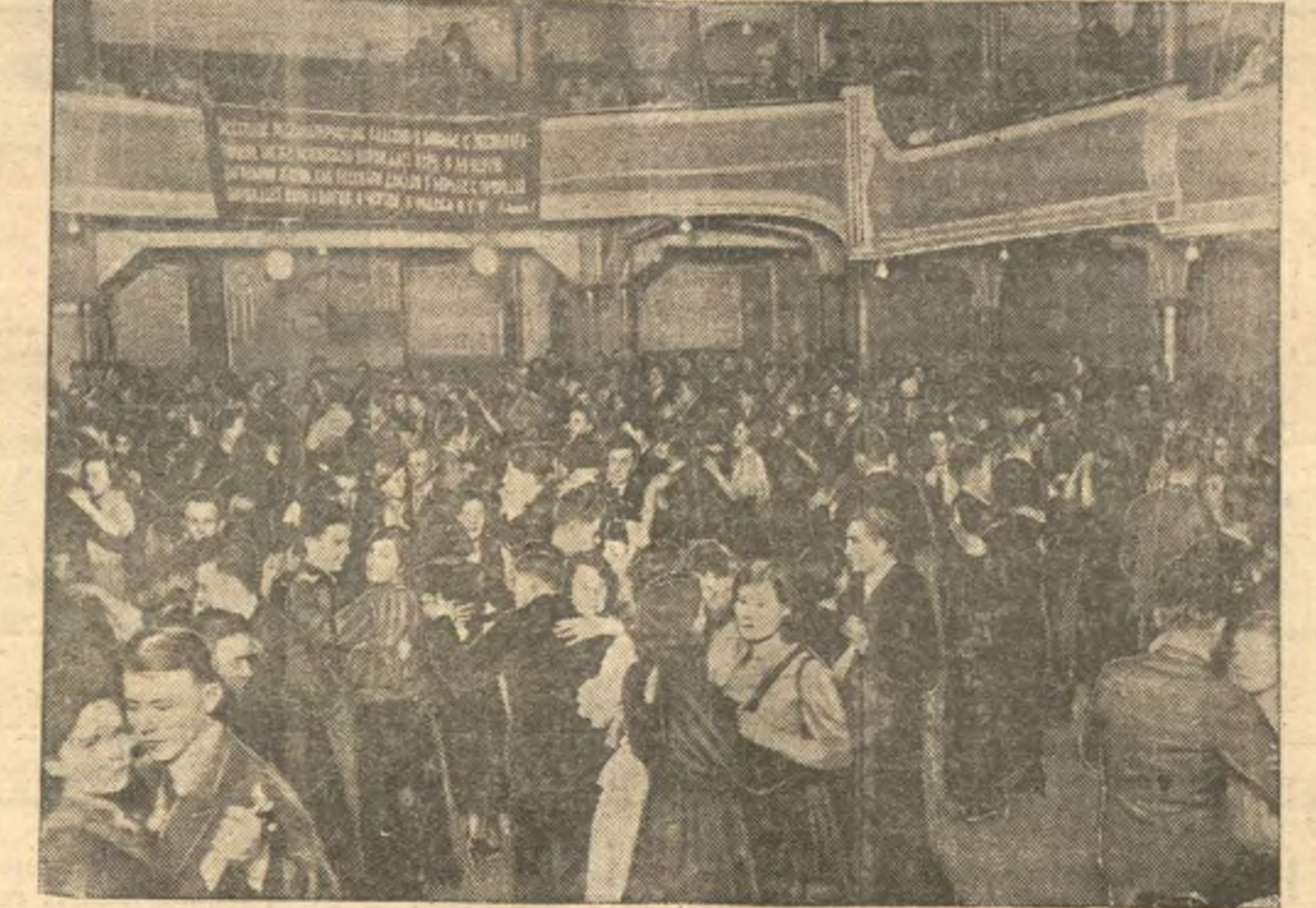
Антирождественский бал 7 января в Томском городском театре.