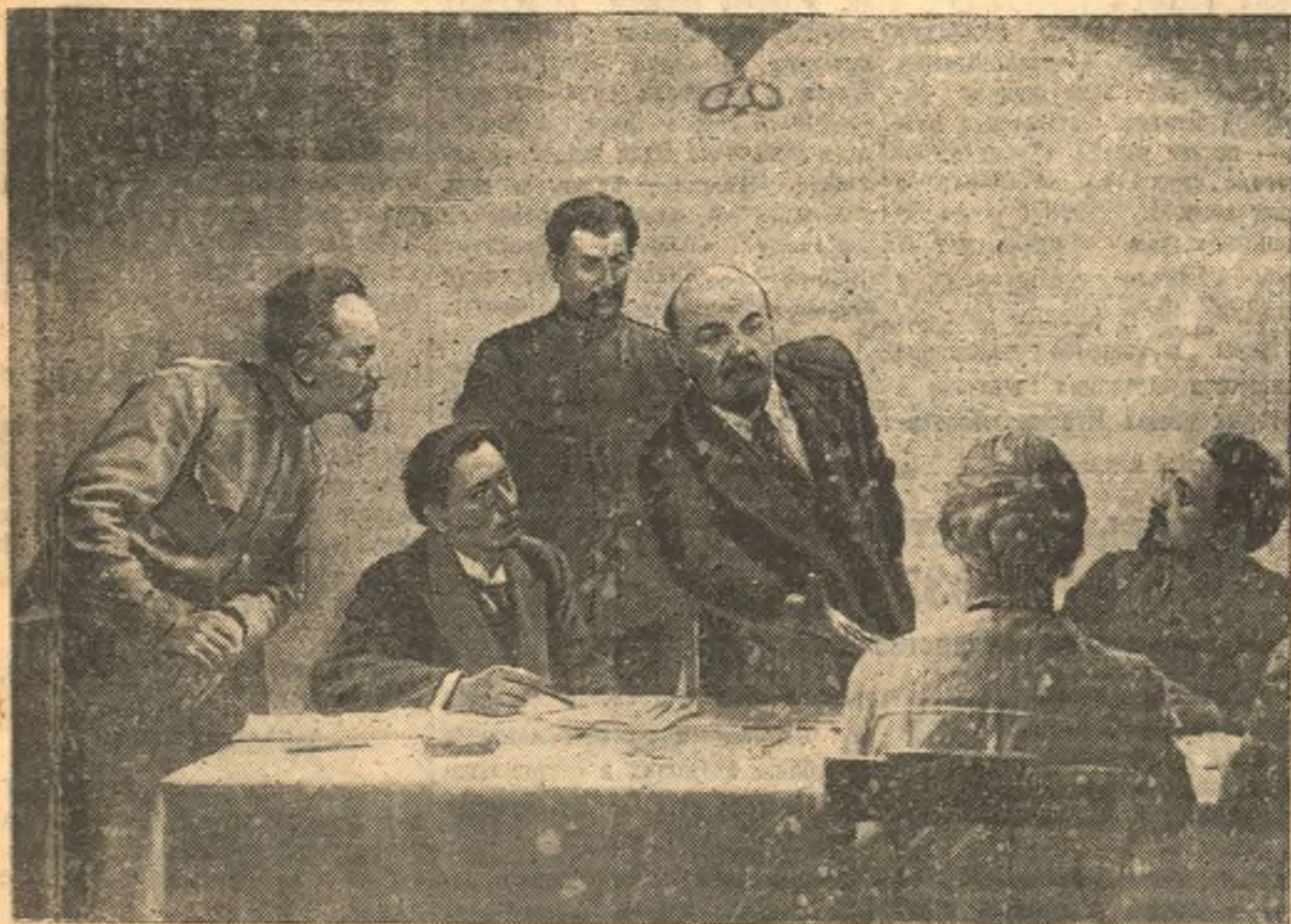
КАДР ИЗ ФИЛЬМА «ЛЕНИН В ОКТЯБРЕ».