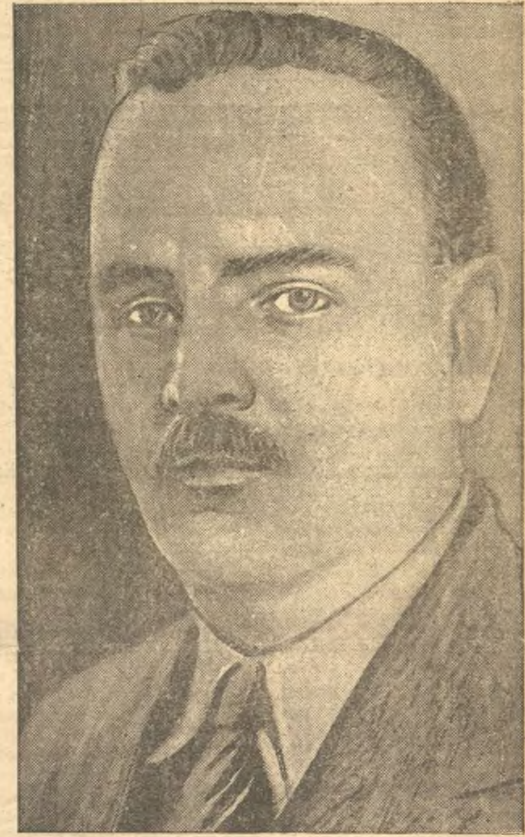
Председатель Совета Национальностей тов. Н. М. Шверник.