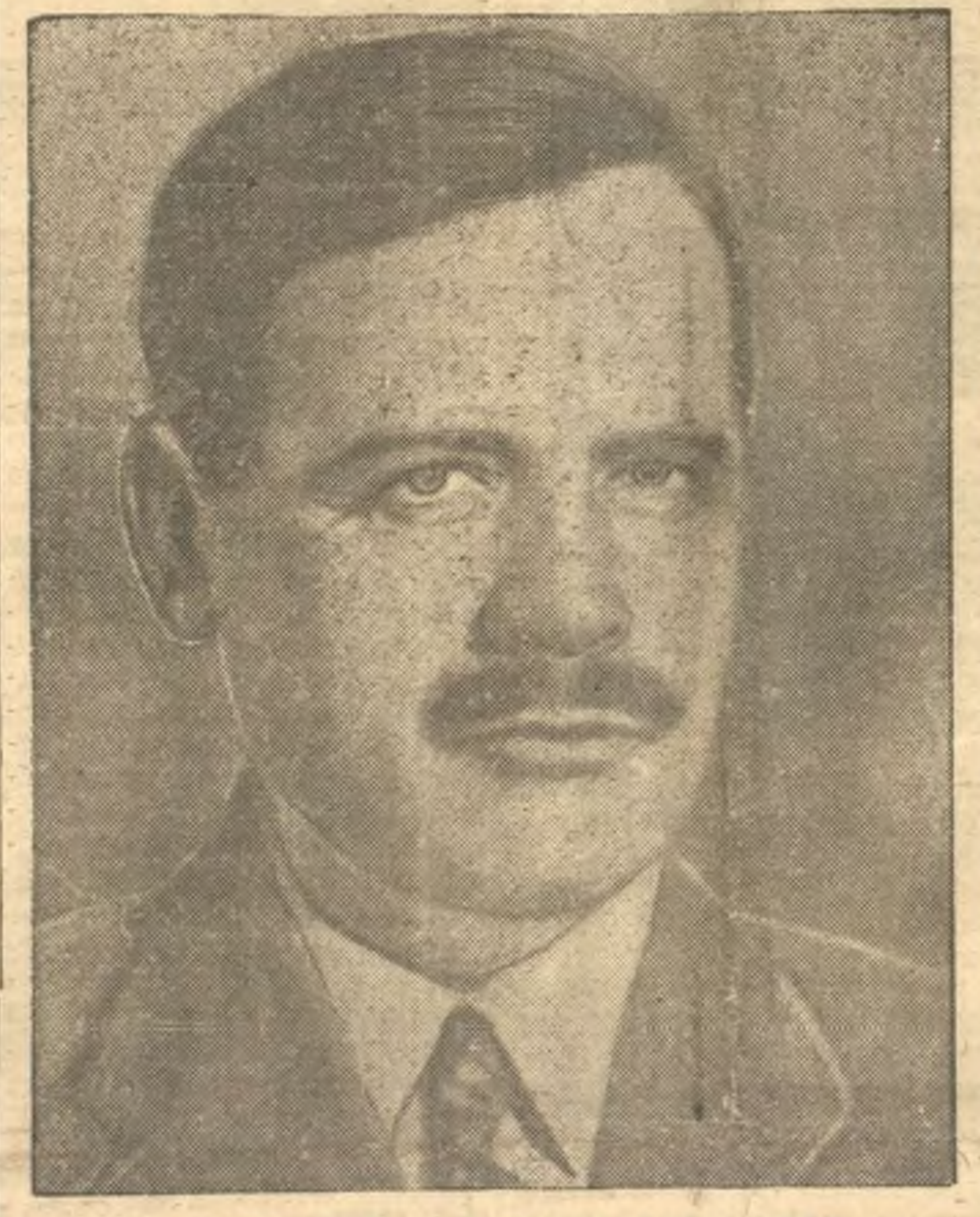
Председатель Совета Союза тов. А. А. Андреев.

12 января, в 4 часа дня, в зале заседаний Совета Союза в Кремле состоялось открытие Сессии Совета Союза. По предложению депутата тов. Хрущева Н. С. Сессия открывает старейший депутат Совета Союза академик Алексей Николаевич Бах. После короткой речи тов. Баха Совет Союза приступил к выборам