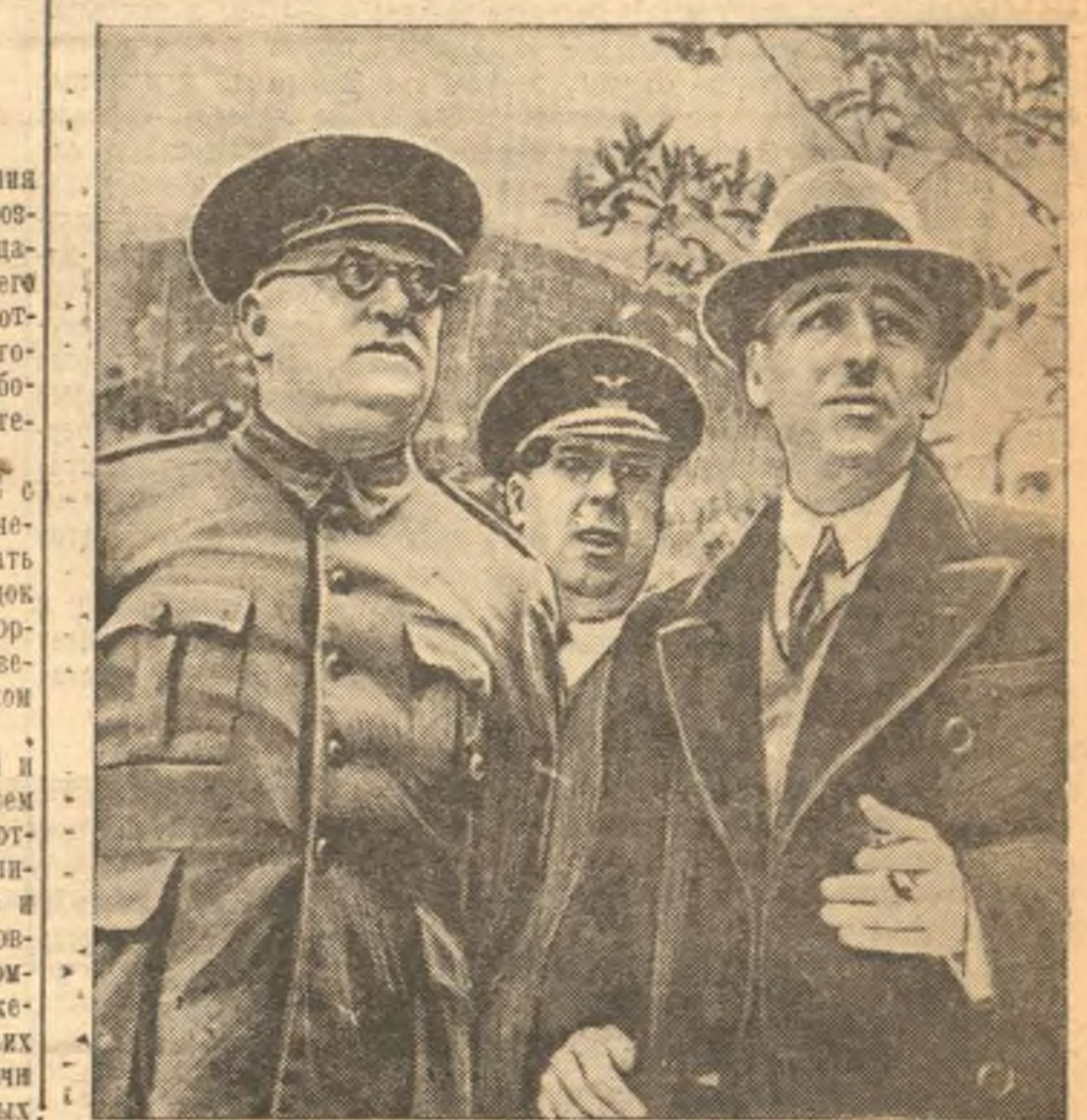
Генерал Миаха и президент Каталонии Компанис (справа) в Барселоне.