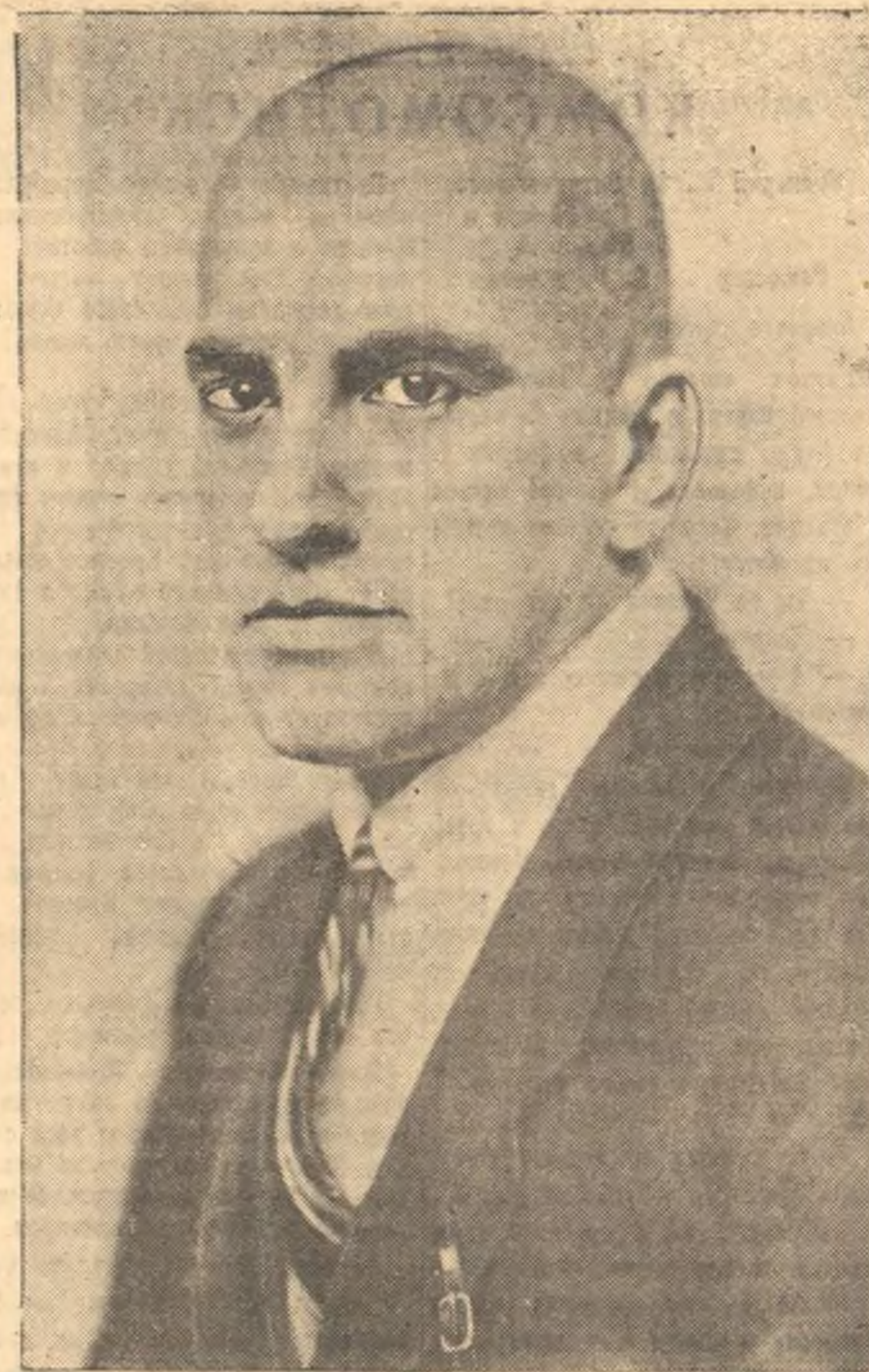
14 апреля исполняется 8 лет со дня смерти талантливейшего поэта советской эпохи Владимира Владимировича Маяковского. На снимке: Владимир Владимирович Маяковский (1893—1930) в 1922 году.

В этот же день во дворце культуры автозавода имени Сталина откроется большая выставка, посвященная Маяковскому. В заводском поселке Коломенское для рабочих и инженеров вечером состоится лекция-концерт. (ТАСС).