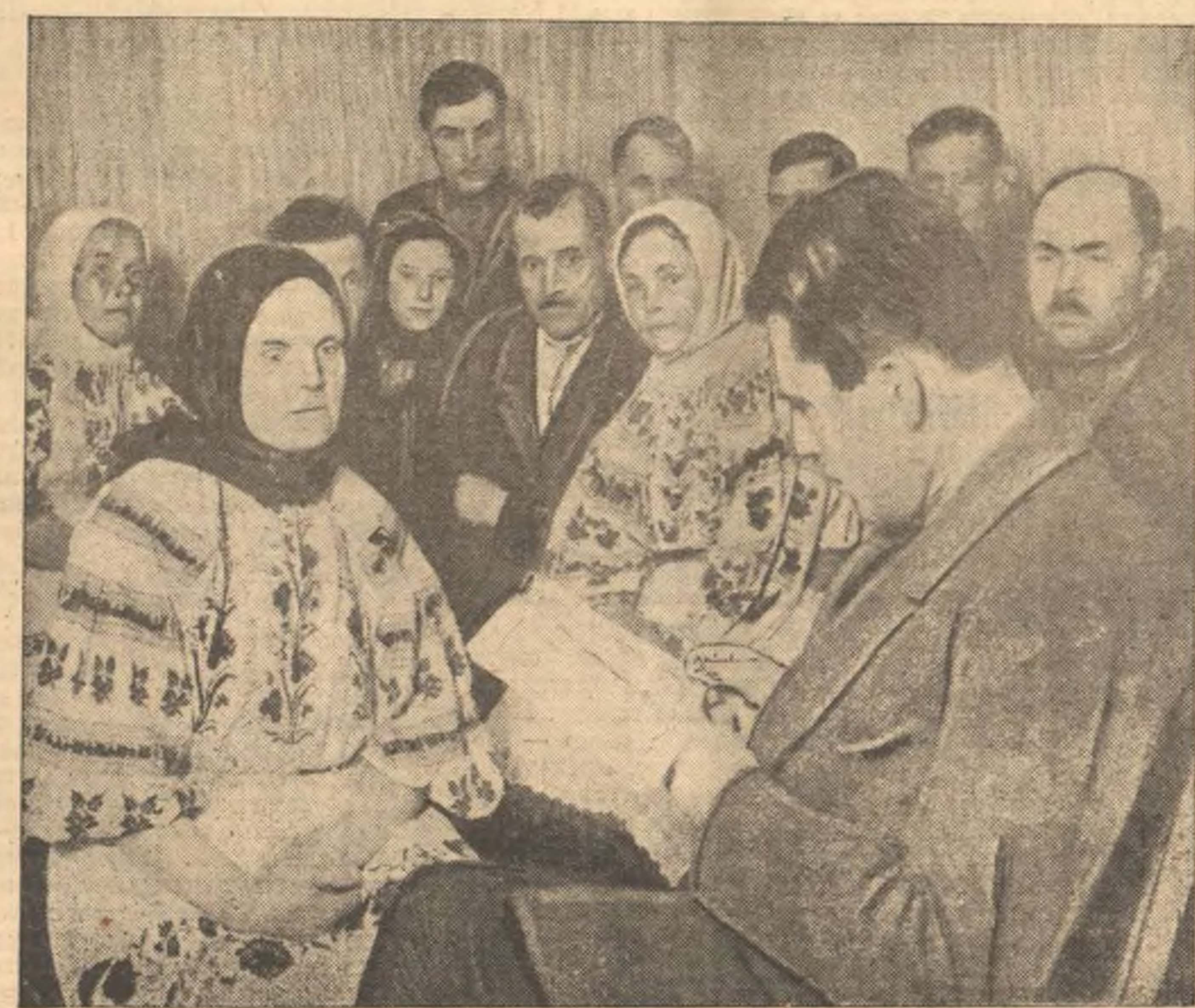
Подготовка к выборам в Верховный Совет УССР. В колхозе имени Ленина (Бородинский район, Киевской области) работают 50 агитаторов.