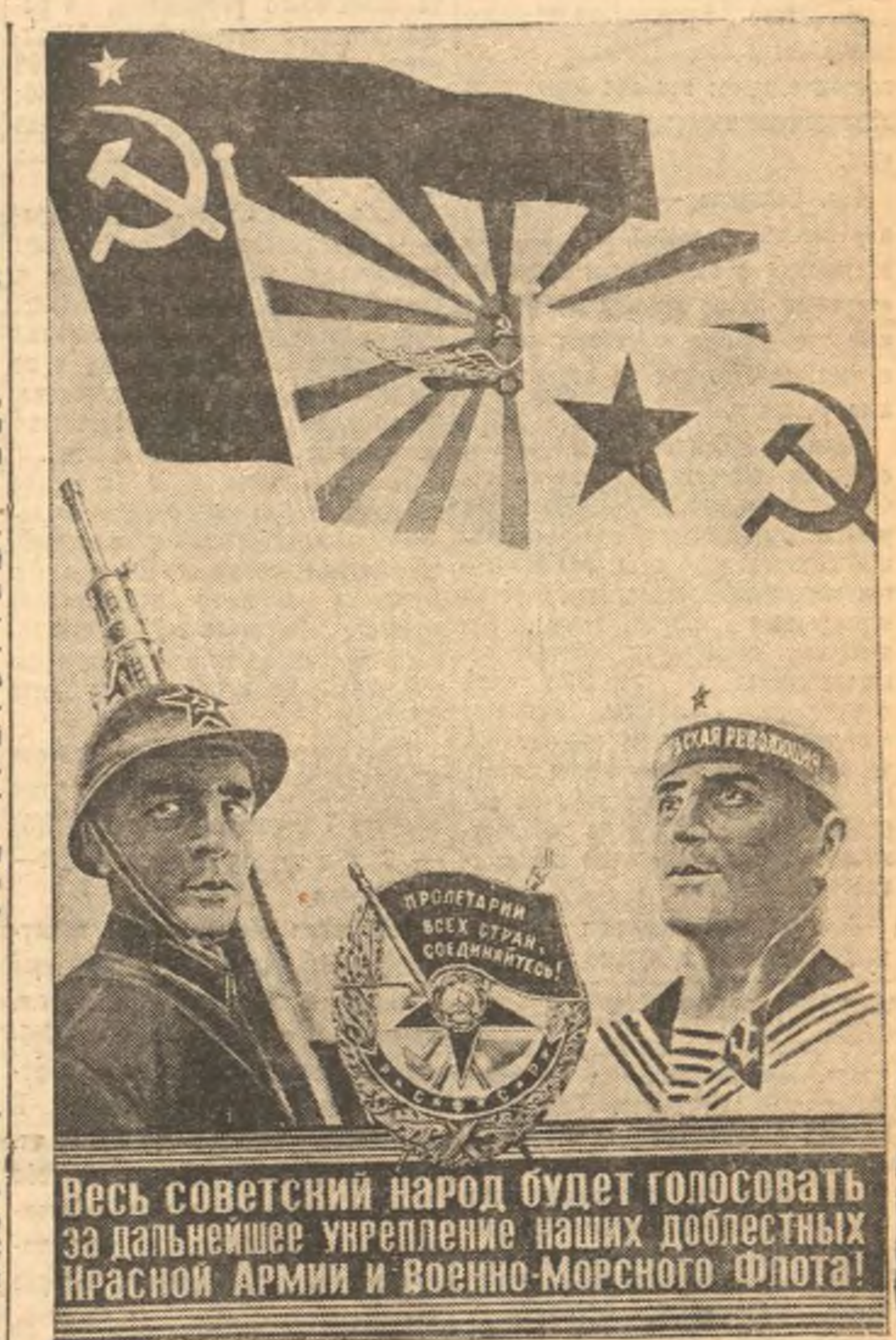
Плакат работы художника В. Стенберг, выпущенный Изогиз'ом к предстоящим выборам в Верховный Совет РСФСР.

(Из лозунгов ЦК ВКП(б) к 1 мая 1938 года)