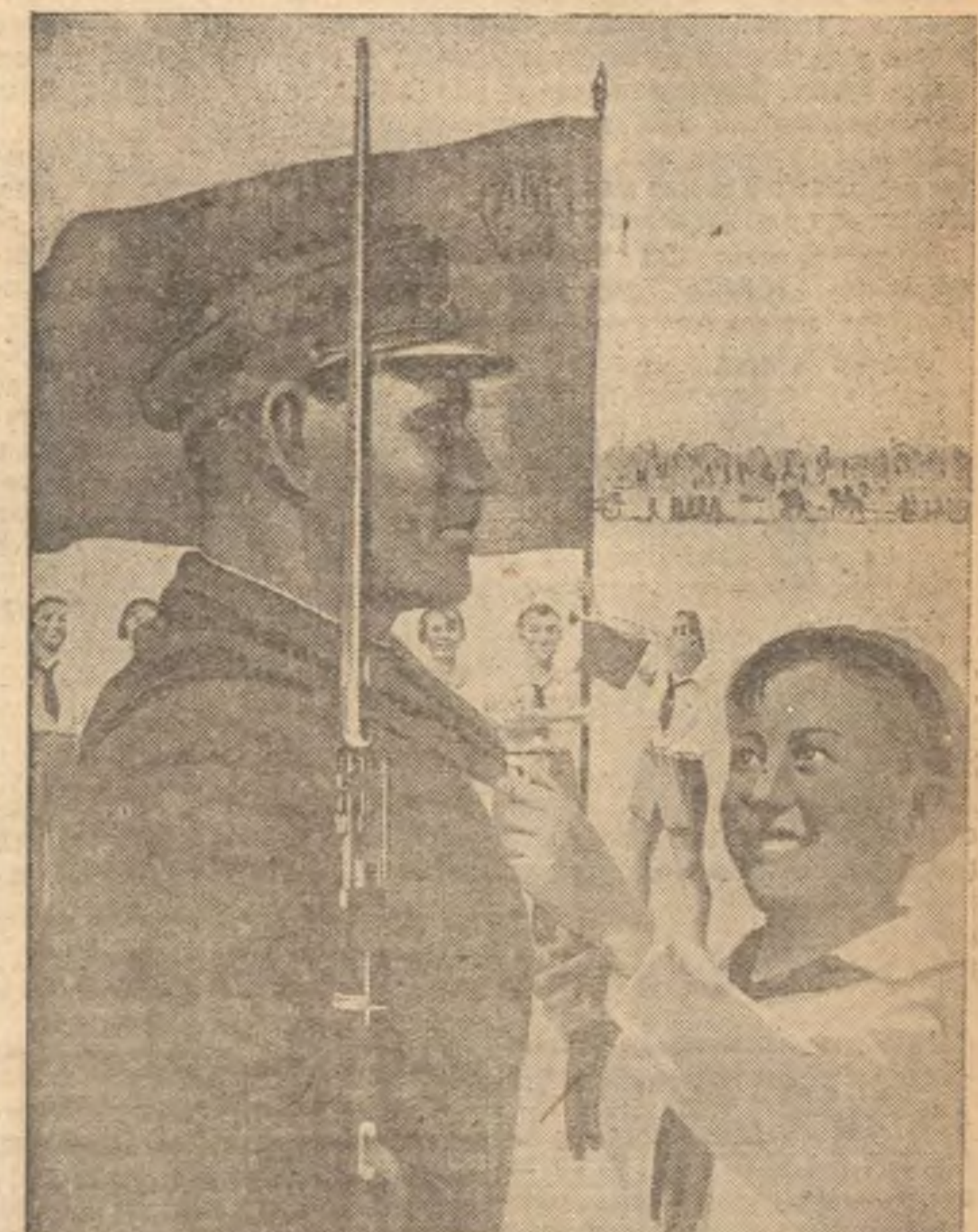
К ЗАЩИТЕ СОЦИАЛИСТИЧЕСКОГО ОТЕЧЕСТВА—ВСЕГДА ГОТОВЫ!