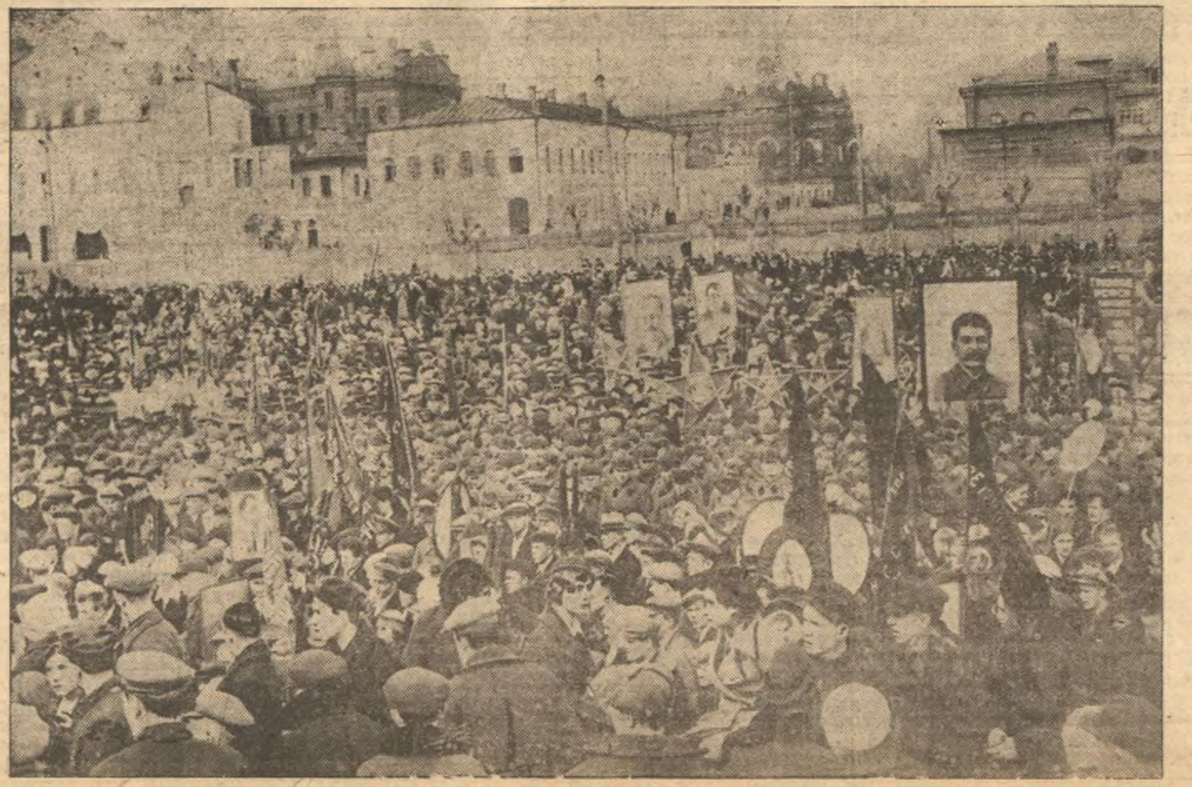
24 апреля на стадионе «Динамо» состоялся митинг молодежи, посвященный началу избирательной кампании по выборам в Верховный Совет РСФСР. На снимке: общий вид митинга.

Два участка шахты 1—6, три участка шахты 9—15 и два участка шахты 5—7 выполняли месячное задание в 24 дня. Коллектив третьего участка шахты 1—6 в оставшие дни до празднования 1 мая обязано дать сверх плана 2500 тонн угля. Между бригадами участка широко развернулось социалистическое соревнование.