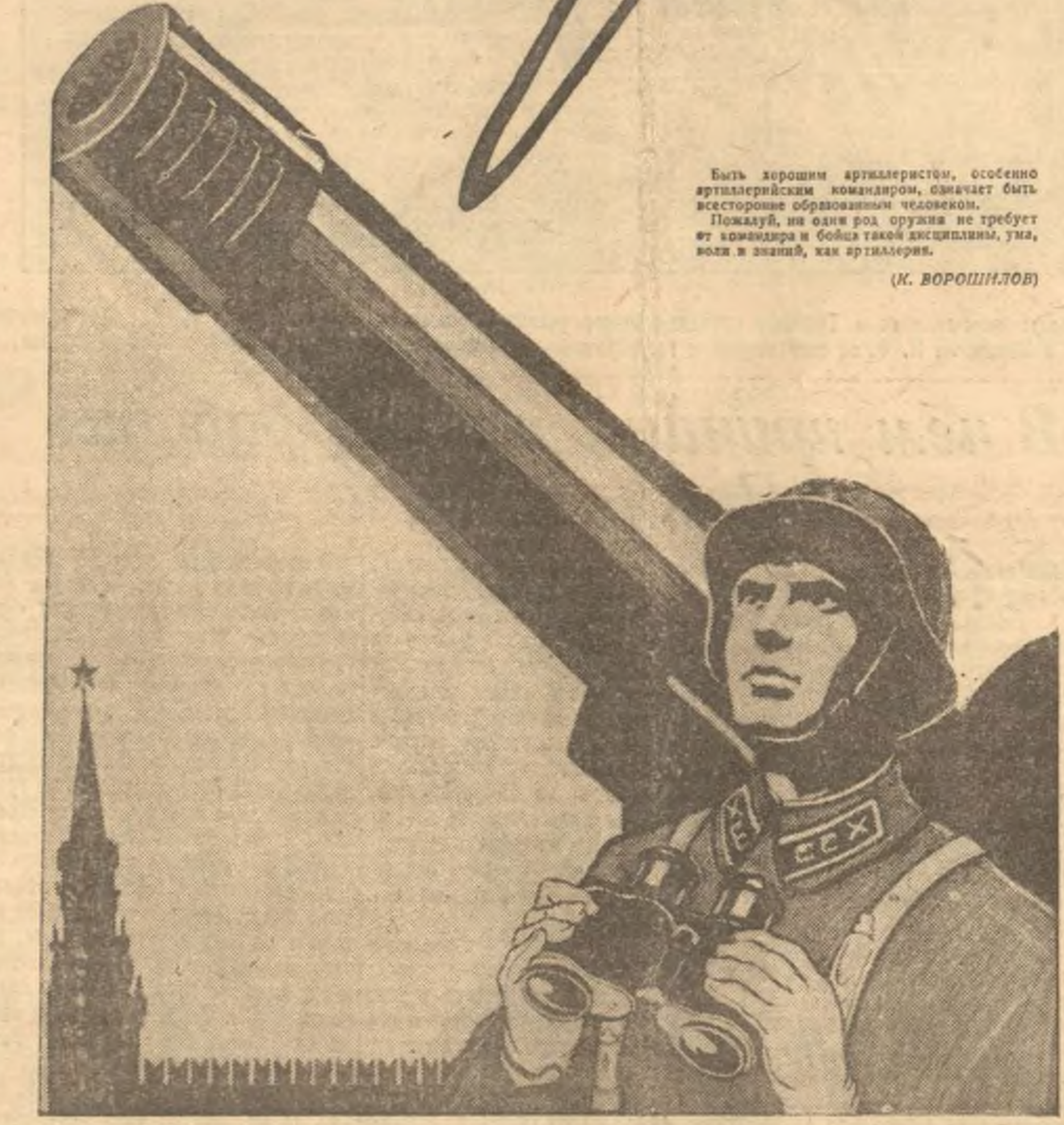
Быть хорошим артиллеристом, особенно артиллерийским командиром, означает быть всесторонне образованным человеком. Пожела, не один род оружия не требует от командира и бойца такой дисциплины, ума, воли и знаний, как артиллерия. (К. ВОРОШИЛОВ)