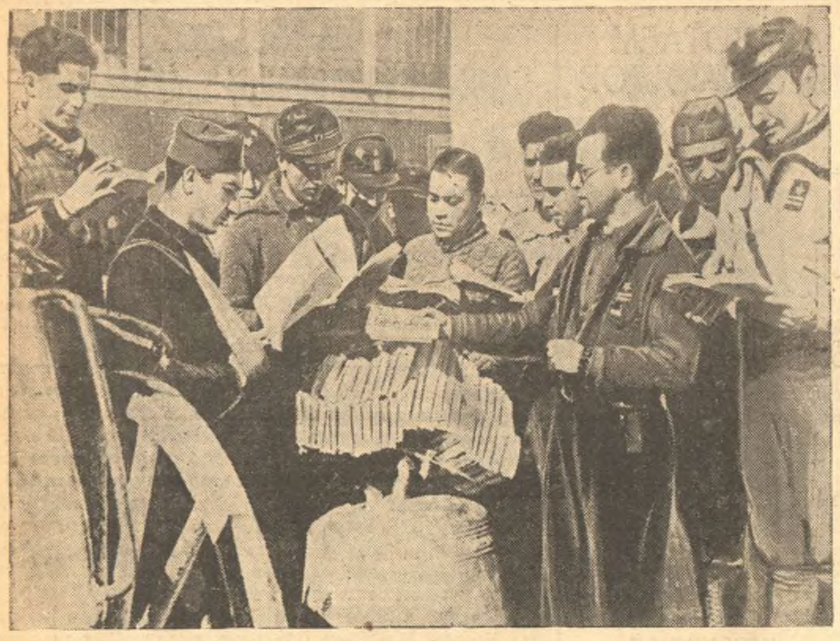
В республиканской Испании. Культурная работа среди бойцов республиканской армии. На снимке: бойцы республиканской армии разбирают литературу, присланную на фронт.