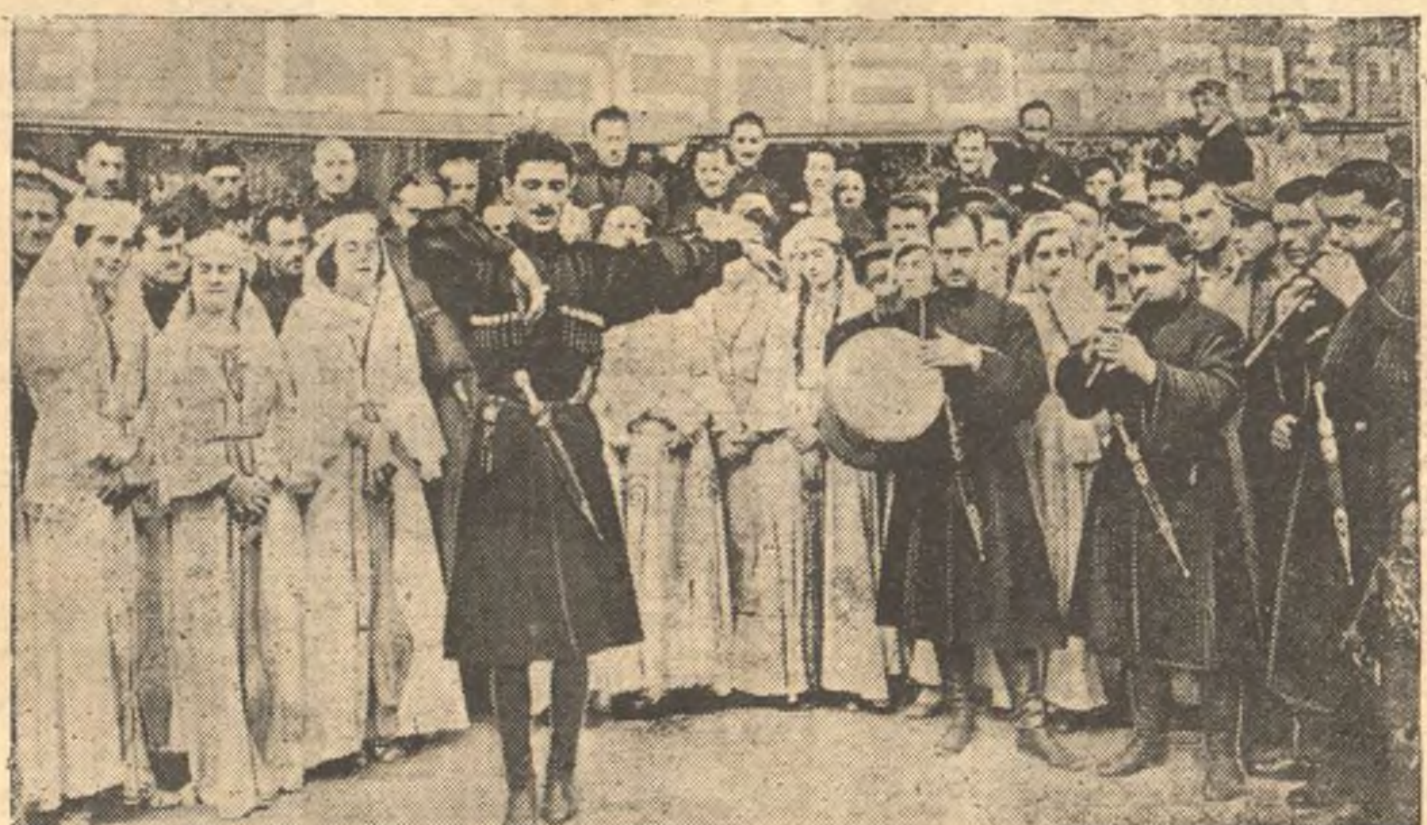
12 июня 1938 г. с огромным подъемом и воодушевлением прошли выборы депутатов в Верховные Советы Грузинской и Армянской ССР. Свободные и счастливые народы Грузии и Армении встретили этот день под лозунгом единодушного голосования за кандидатов непобедимого сталинского блока коммунистов и беспартийных. День выборов в Верховные Советы прошел как день великого всепартийного праздника. На снимке: участники государственного хора Восточной Грузии исполняют национальные грузинские танцы у 2-го избирательного участка Сталинского избирательного округа города Тбилиси, где в депутаты Верховного Совета Грузинской ССР баллотировался тов. В. М. Молотов.

Да здравствует вождь и организатор великих побед социализма — партия Ленина—Сталина!