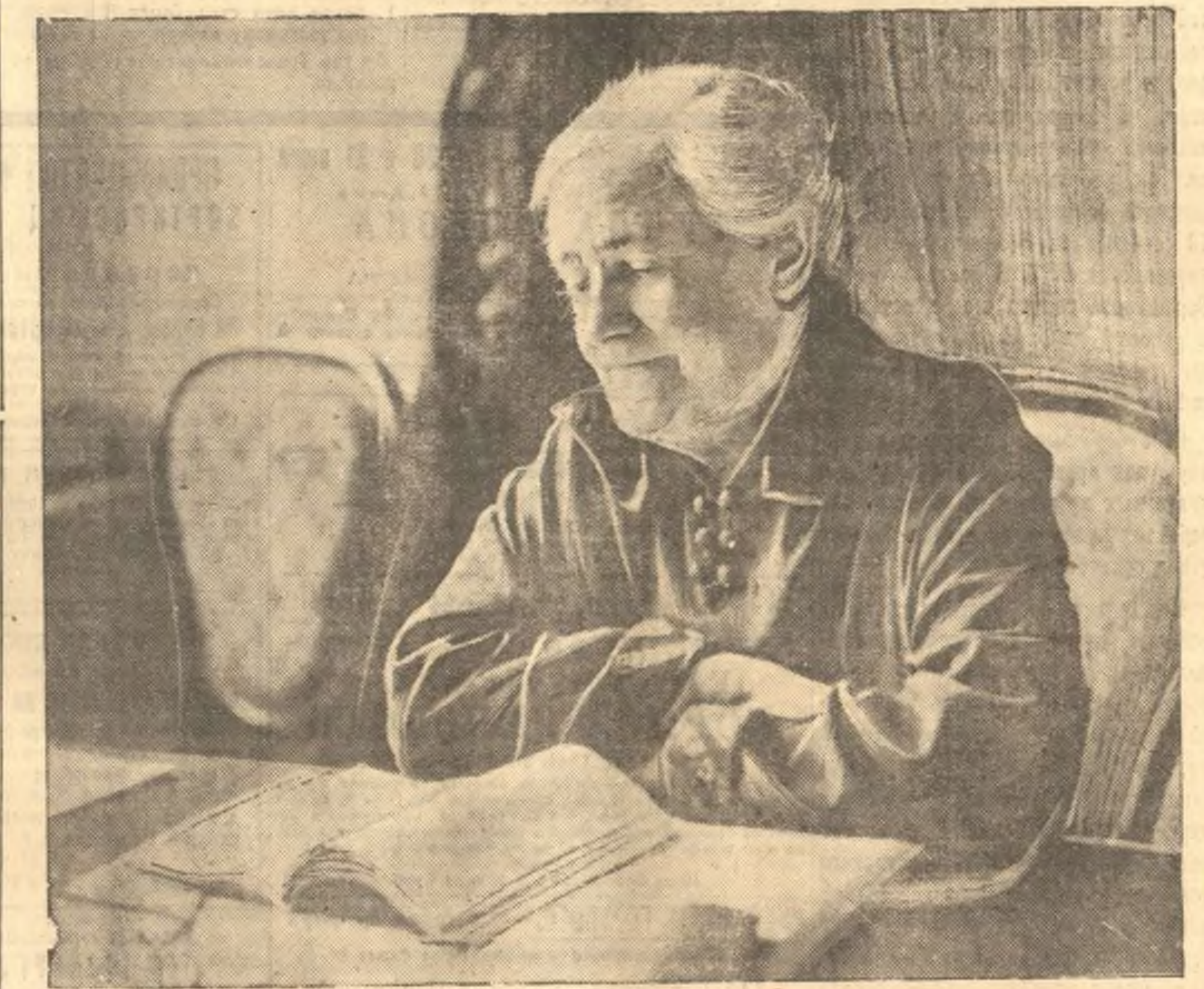
20 июня исполнилось 5 лет со дня смерти Клары Цеткин. На снимке: Клара Цеткин (1857—1933 гг.). (Сблизфото).

тайная полиция произвела массовые аресты. Всего арестовано 1200 человек.