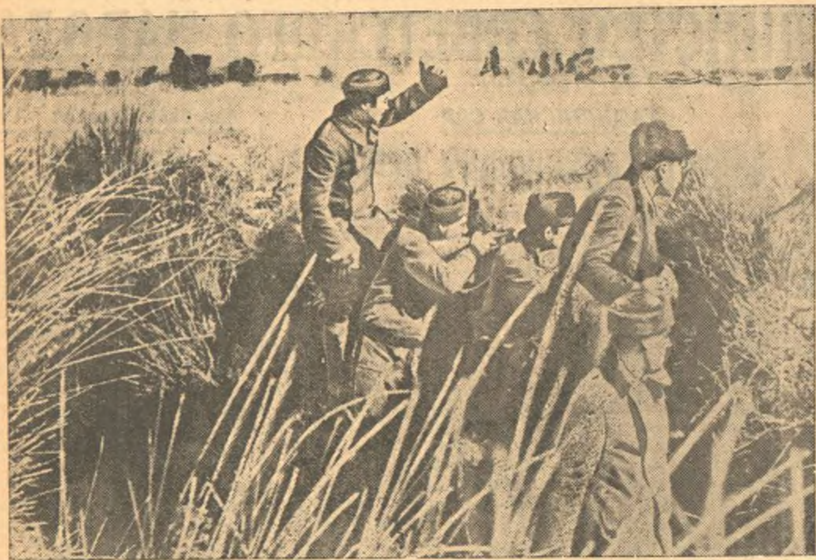
В республиканской Испании. На снимке: отряд бойцов республиканской армии на передовых позициях.