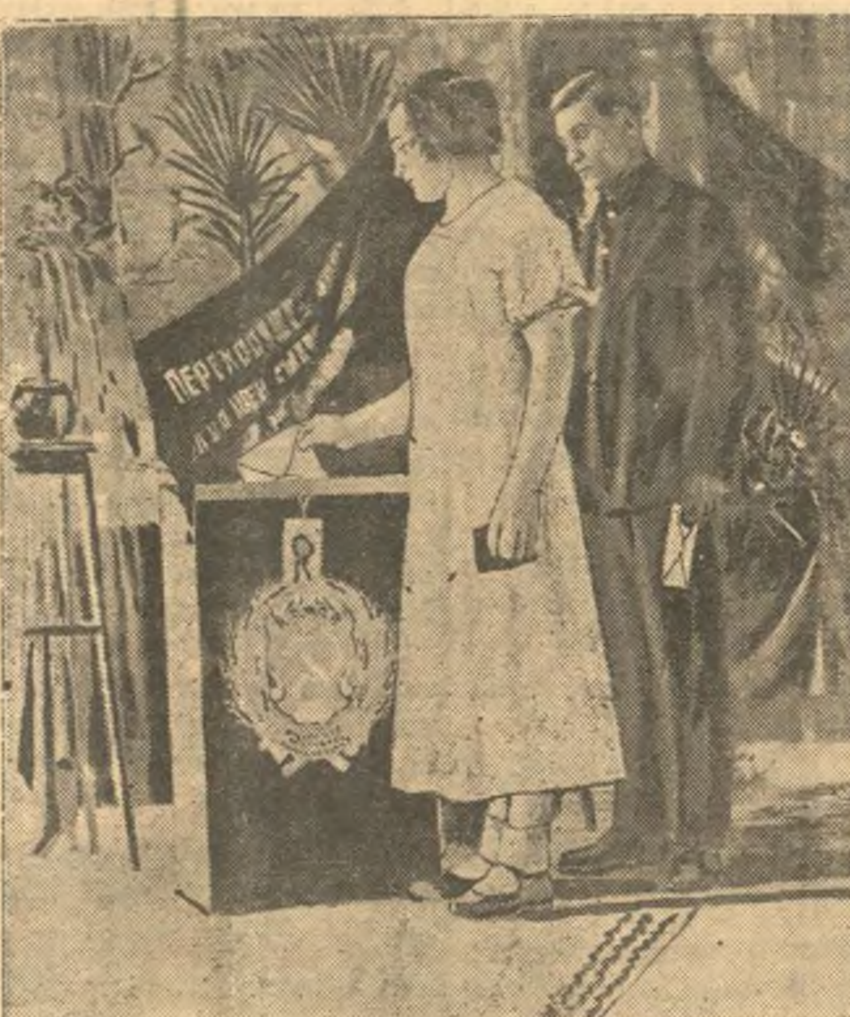
Избиратели Томского городского избирательного округа у избирательной урны.