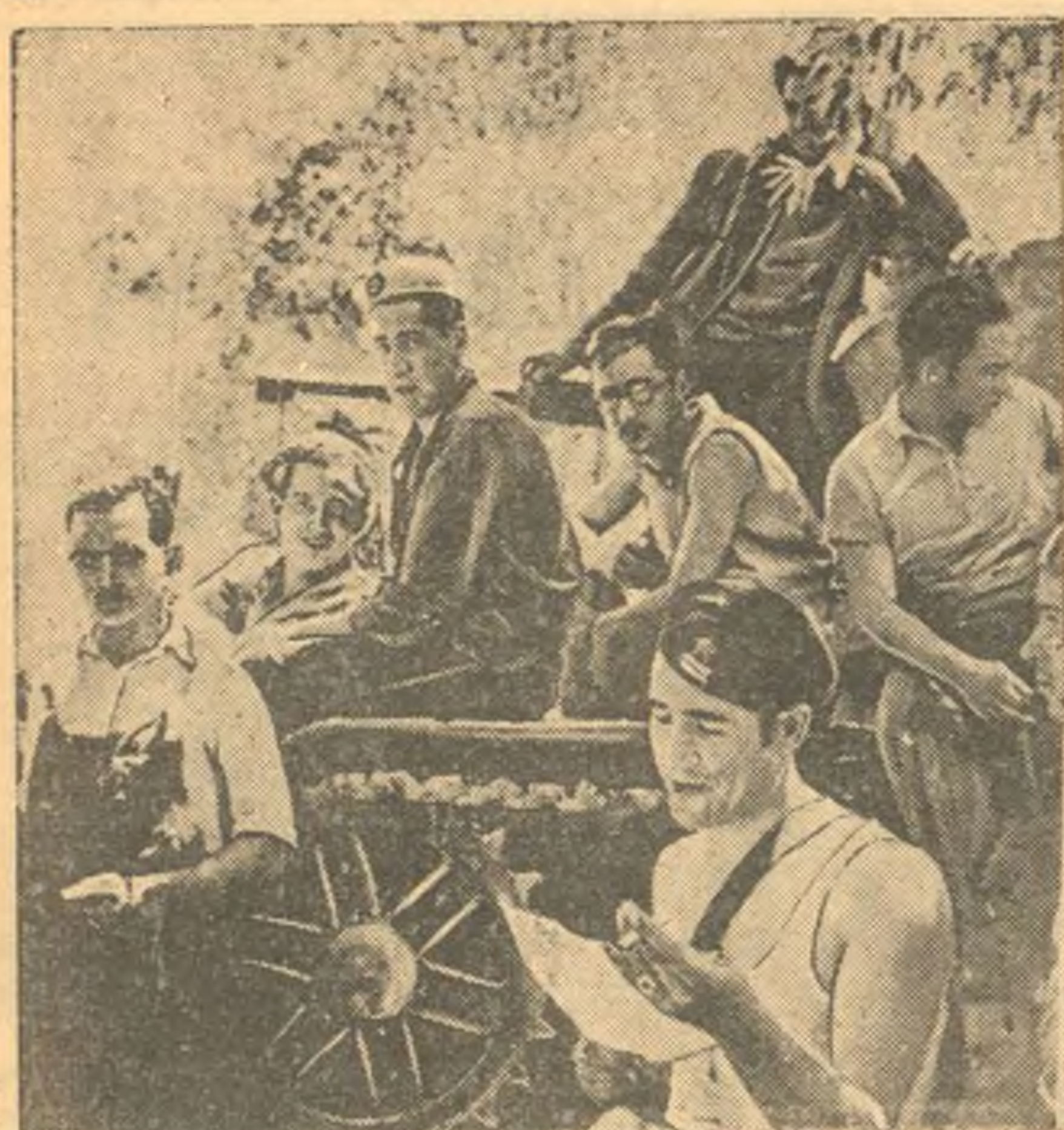
В республиканской Испании. На снимке: танкисты республиканской армии на отдыхе. (Союзфото).