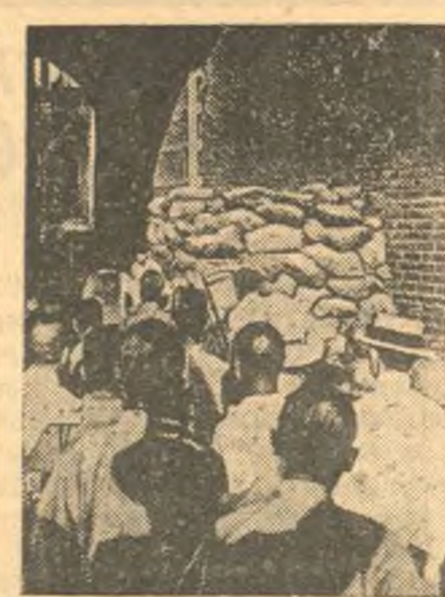
К военным действиям в Китае. Японские агрессоры; захватившие Бейпин, все время находятся под непосредственной угрозой армии Чжу-Де. Город превращен в военный лагерь, отрезанный от внешнего мира. Все желающие выйти из города японские захватчики подвергают тщательному обыску и опросу. На снимке: у забаррикадированного входа в Бейпин.

Кантонский корреспондент агентства Рейтер сообщает, что 7 июля китайцы сбросили японский бомбардировщик во время бомбардировки Кантон-Ханькоуской железной дороги. Самолет упал в 30 километрах севернее Кантона.