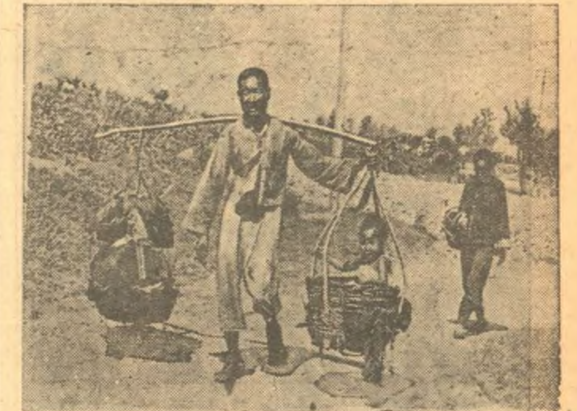
И военными действиями в Китае. На снимке: китайский крестьянин с женой и раненым ребенком спасаются из района, занятого японскими интервентами. (Союзфото).