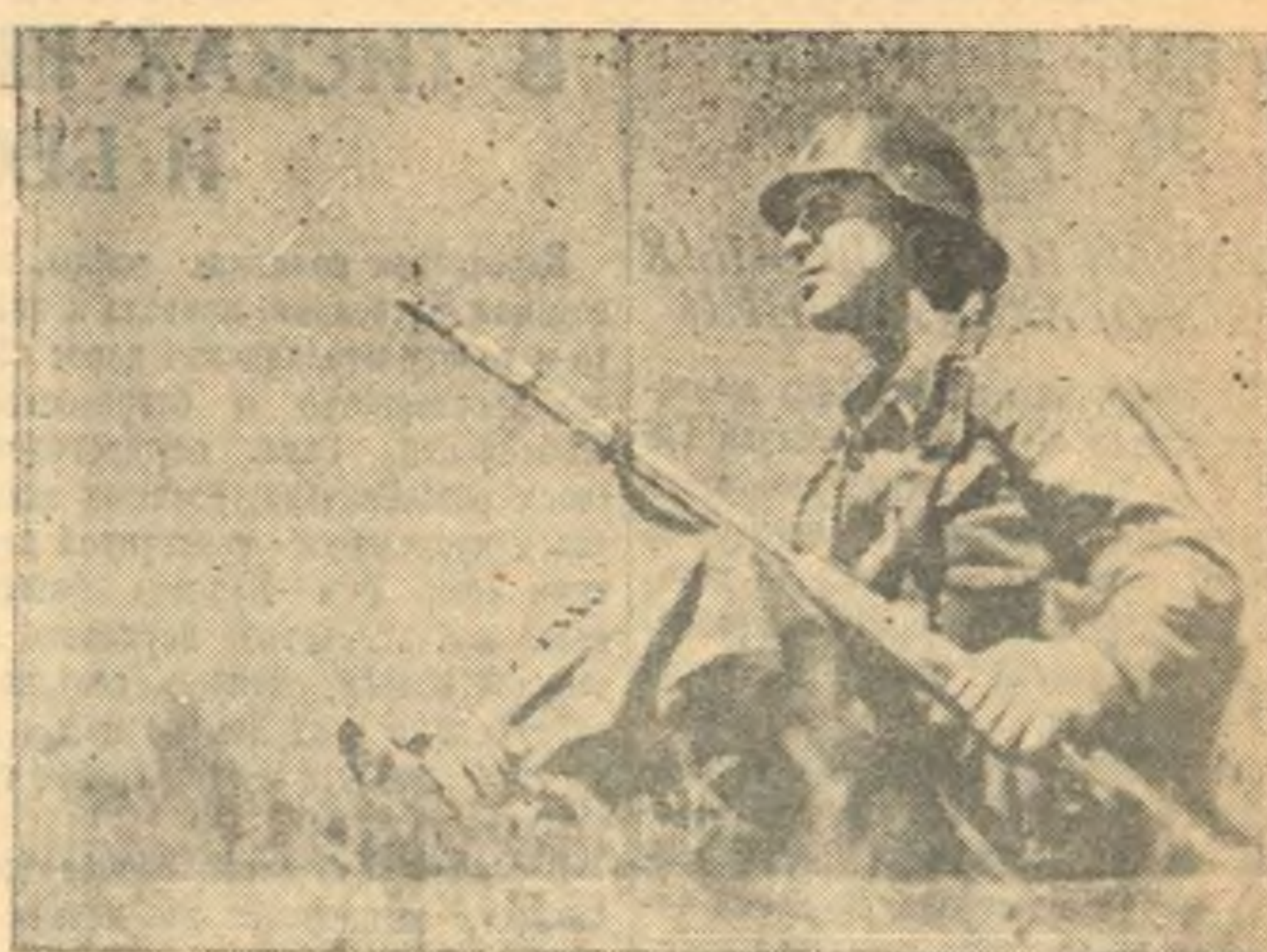
2 республиканской Испании. На снимке: боец республиканской армии.

Узусе переселить не позже 5 июля только проживающих там студентов, хотя большинство жильцов — сотрудники института.