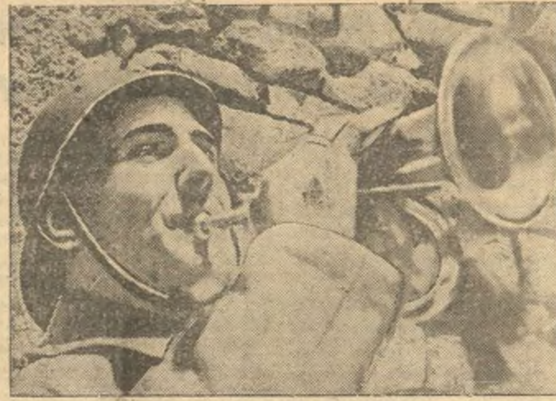
В республиканской Испании. На снимке: горнист республиканской армии.