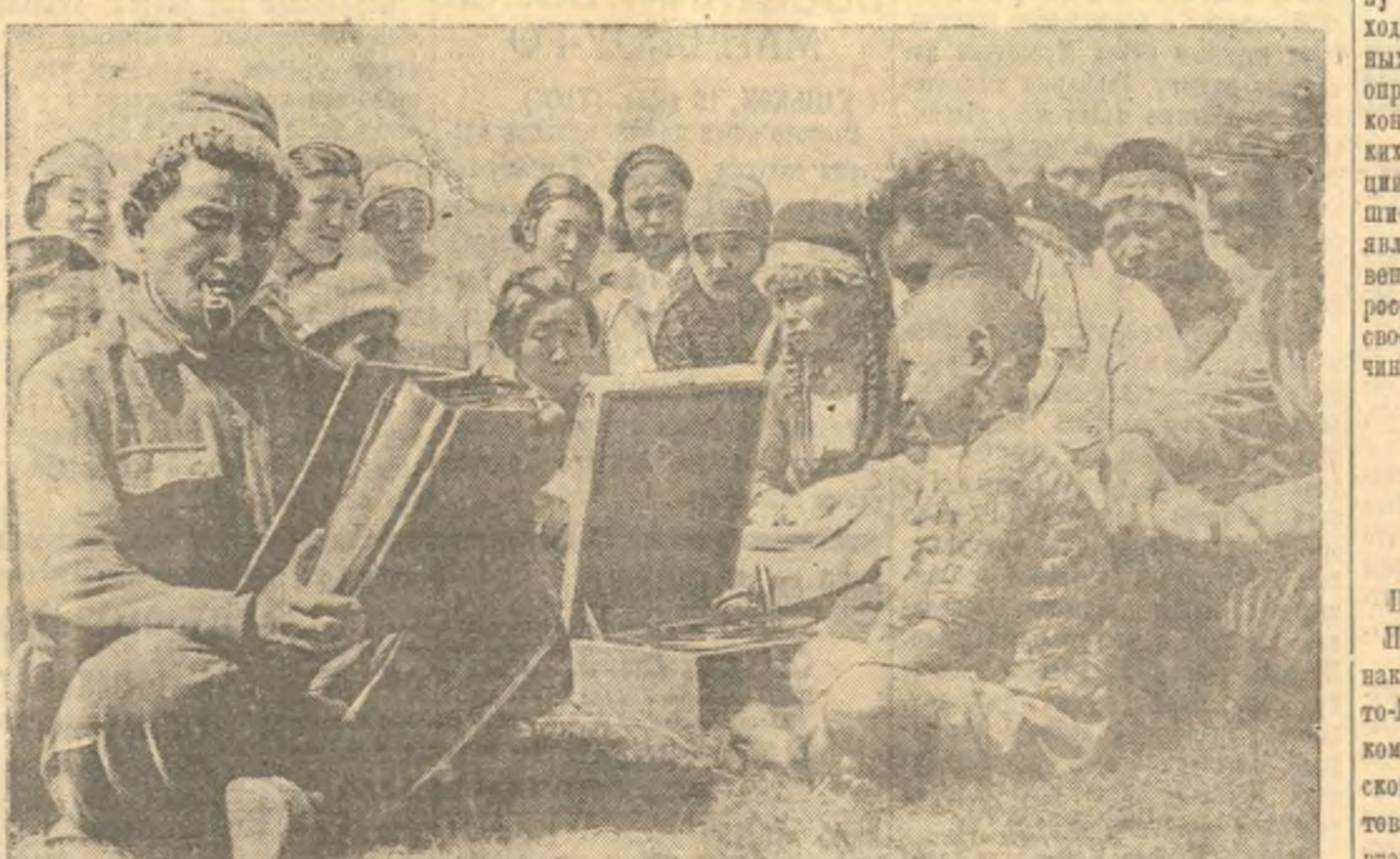
В Ойротской автономной области. На снимке: колхозники артели «12 лет Октября» (село Ело, Ойрудайский аймак) слушают граммофонную запись доклада товарища И. В. Сталина на VIII чрезвычайном Съезде Советов.

Предполагается организовать посещение студентами музеев университета, продемонстрировать им кинокартину «Ленин в Октябре».