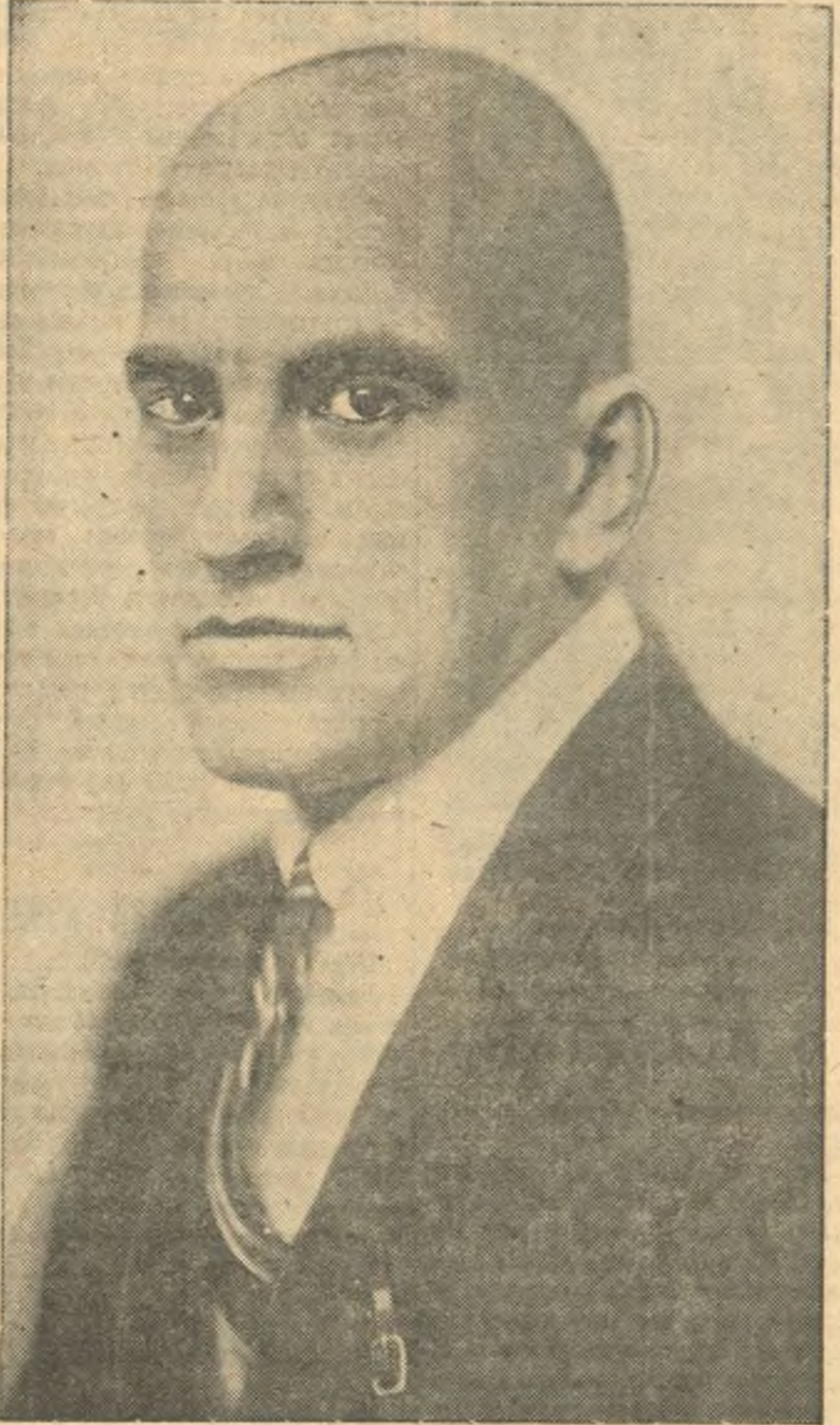
ВЛАДИМИР ВЛАДИМИРОВИЧ МАЯКОВСКИЙ.

Младшая Маяковская в своих воспоминаниях о юных годах брата писала: «Это был мальчик безгранично упорный, настойчивый во всех своих делах и стремлениях, и в то же время это был подросток живой, веселый, остроумный, подвижной, который всегда находил время для игр и развлечений, для серьезного чтения и рисования».