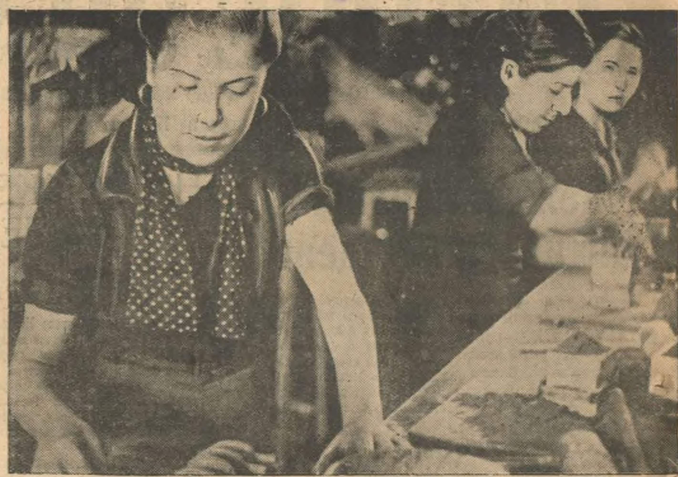
В республиканской Испании. На снимке: испанские девушки, занятые на заводе оборонной промышленности в окрестностях Барселоны. (Союзфото).