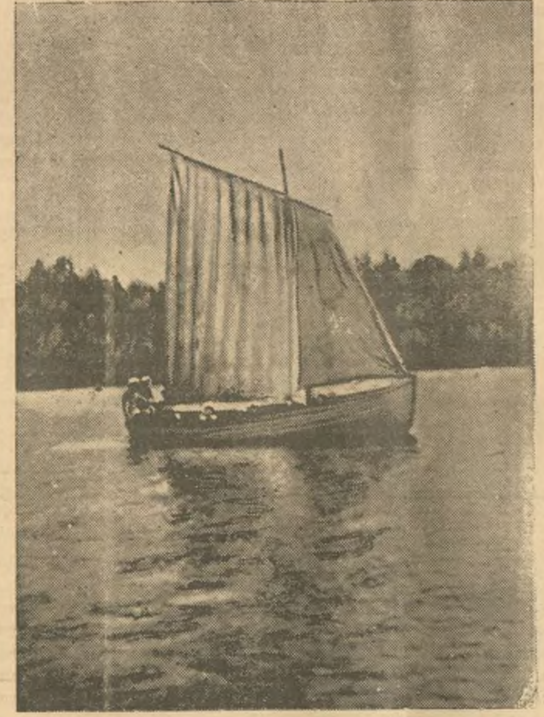
В Морьяновском затоне будущие краснофлотцы овладевают парусным делом.

Колонна прибыла в Петропавловск ПЕТРОПАВЛОВСК, (Казахская ССР), 28 июля, (спецкорр. ТАСС). Пятнадцатые сутки движется при непрекращающихся дождях. Каждый новый перегон оказывается труднее предыдущего и его приходится брать исключительным напряжением сил всего личного состава пробега. Последние 40 километров перекресток Петропавловском, куда мы прибыли только сегодня на рассвете, были исключительно тяжелыми и взурлятельными. Машин медленно прод-