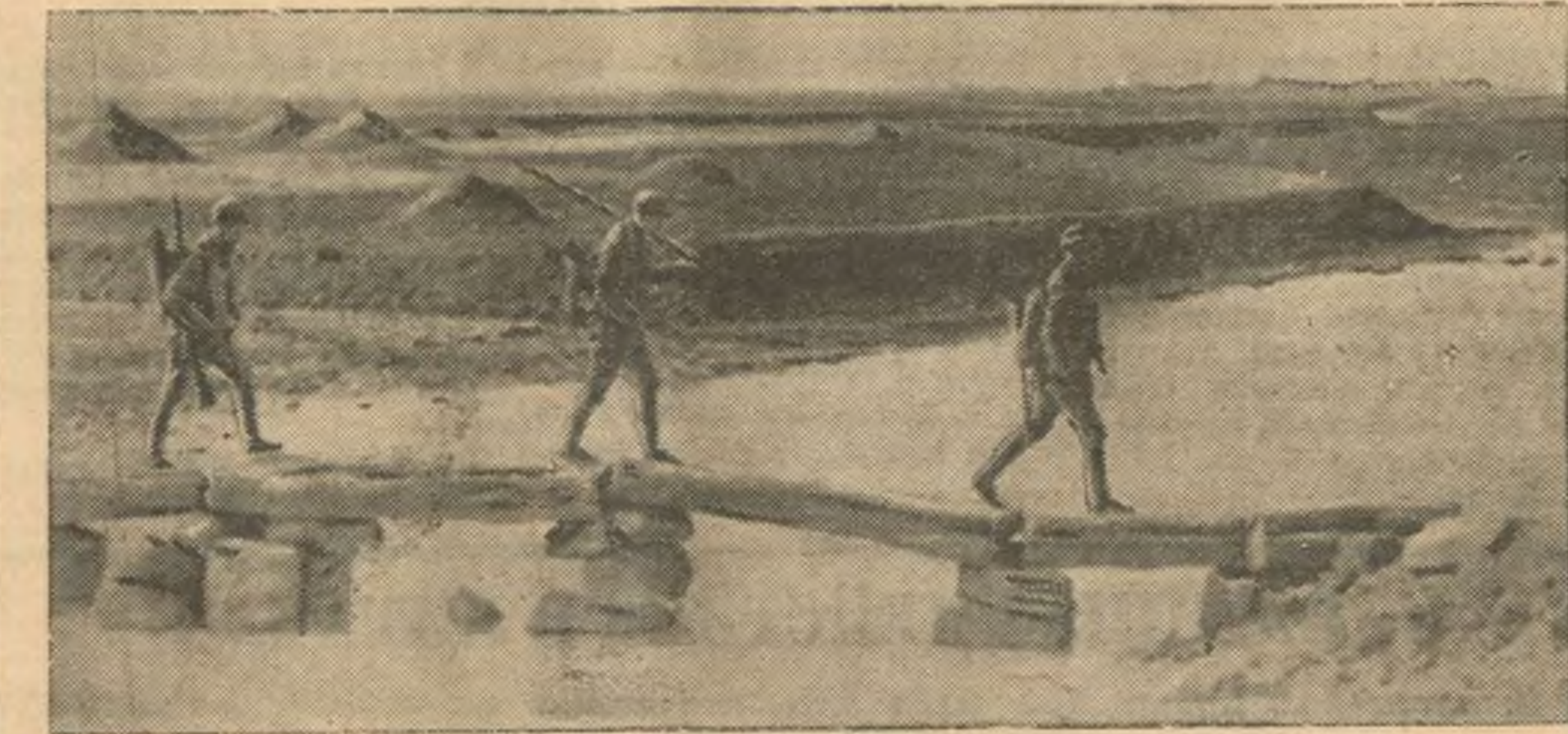
В военных действиях в Китае. На снимке: дозор из отрядов китайской армии в походе.

Национально-освободительная война китайского народа пробудила широкие массы китайок, в прошлом отсталые. Это — яркий показатель общего национального подъема китайского народа. Это — яркий показатель необходимости китайского народа, героически отстаивающего свою независимость.