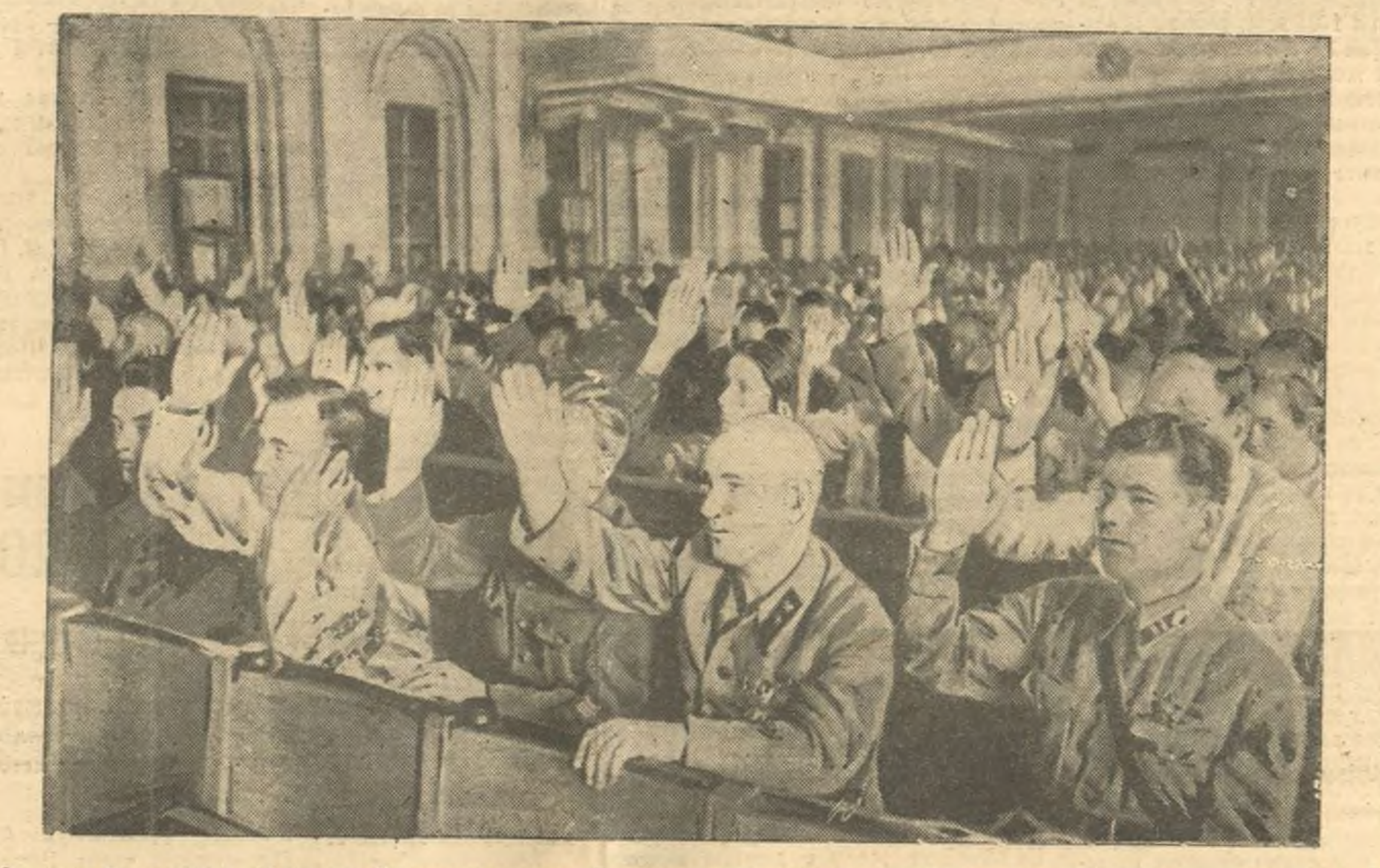
Заседание Совета Союза 14 августа. На снимке: депутаты Верховного Совета СССР голосуют закон о едином государственном бюджете Союза Советских Социалистических Республик на 1938 год.