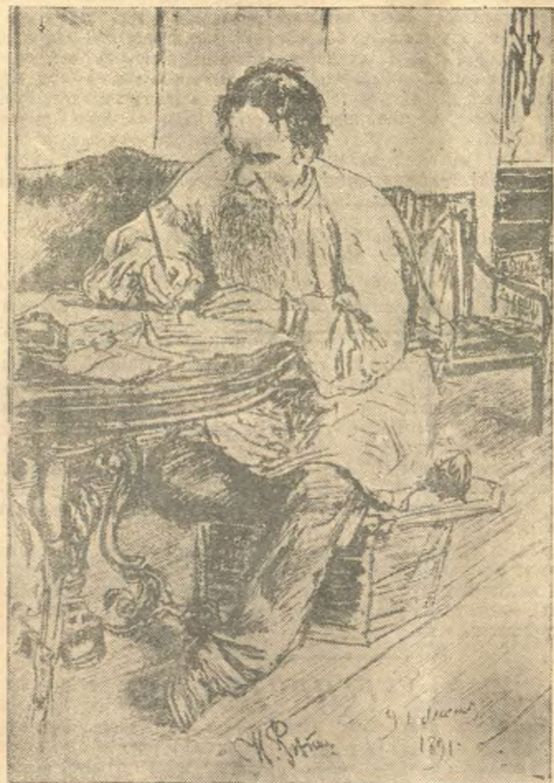
ЛЕВ НИКОЛАЕВИЧ ТОЛСТОЙ (1828—1910).