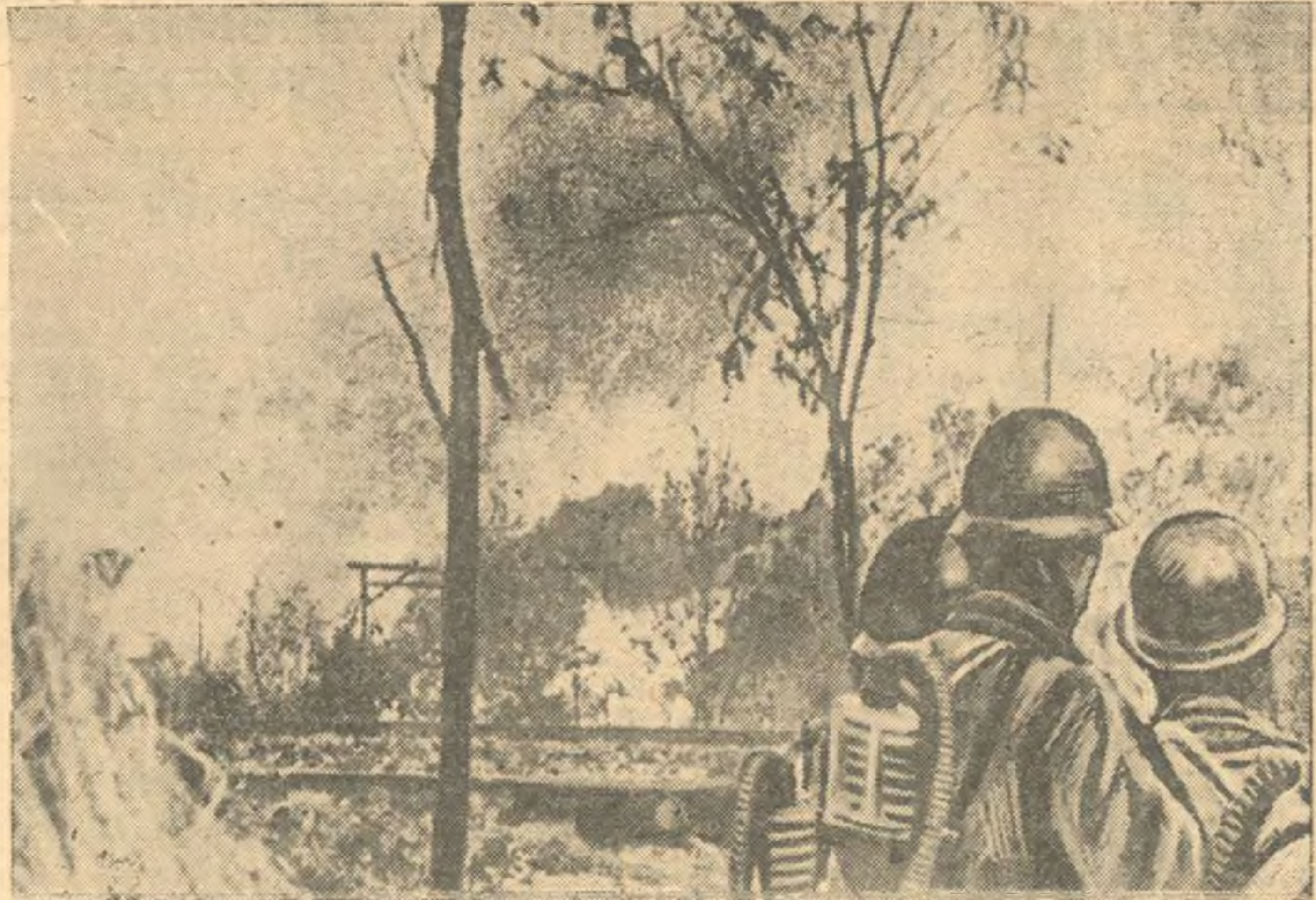
К военным действиям в Китае. В борьбе против китайского народа японские захватчики применяют отравляющие вещества...