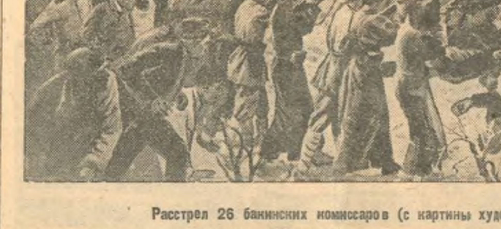
Расстрел 26 банинских комиссаров (с картины художника Бродского).

20 лет назад, в ночь с 19 на 20 сентября 1918 года, в далеких песках Закаспия совершилось чудовищное преступление. Руками английских интервентов и их прислужников — меньшевиков и эсеров были зверски замучены 26 банинских комиссаров, 26 лучших сынов героического бакинского пролетариата: Степан Шаумян, Агеша Джангаридзе, Ваня Фиолетов, Мешади Азизбеков, Корганов, Зевин и другие.