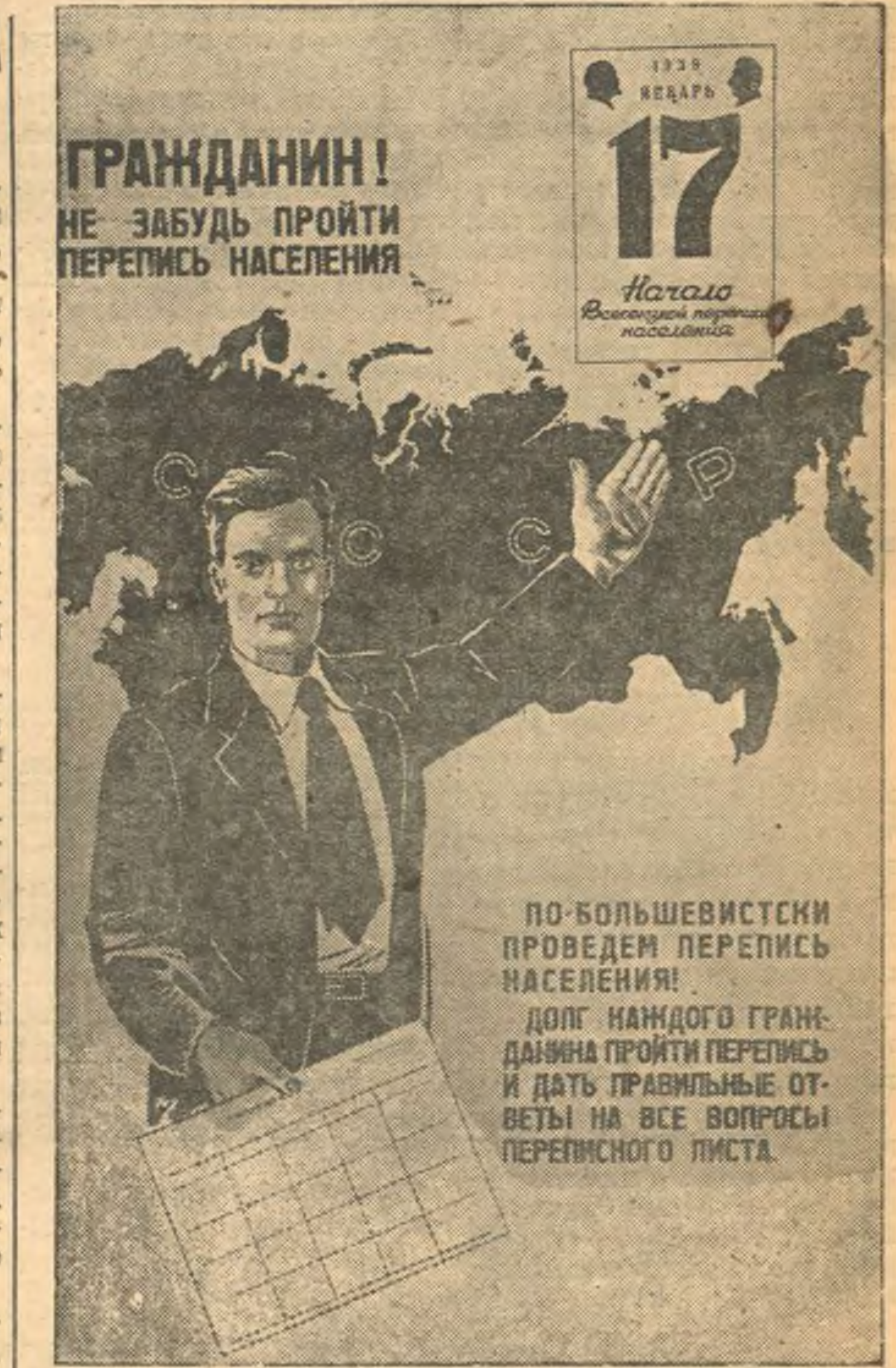
Подготовка к Всесоюзной переписи населения. На снимке плакат «Гражданин! Не забудь пройти перепись населения», выпущенный институтом изобразительной статистики. (Скобелко).