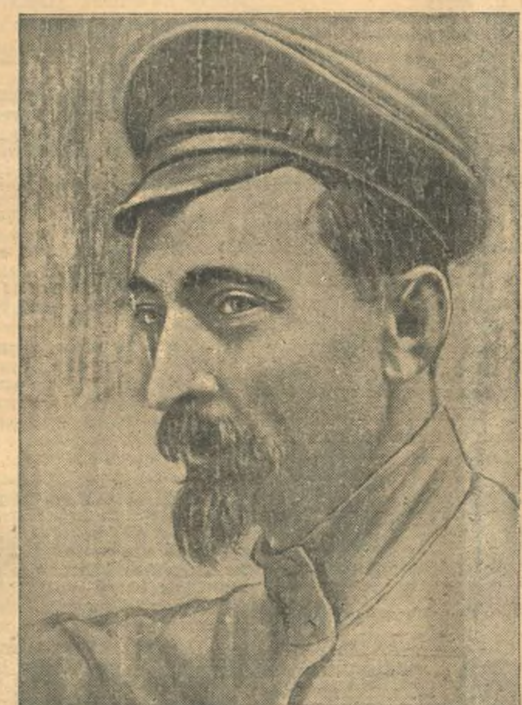
ФЕЛИКС ЭДМУНДОВИЧ ДЗЕРЖИНСКИЙ.