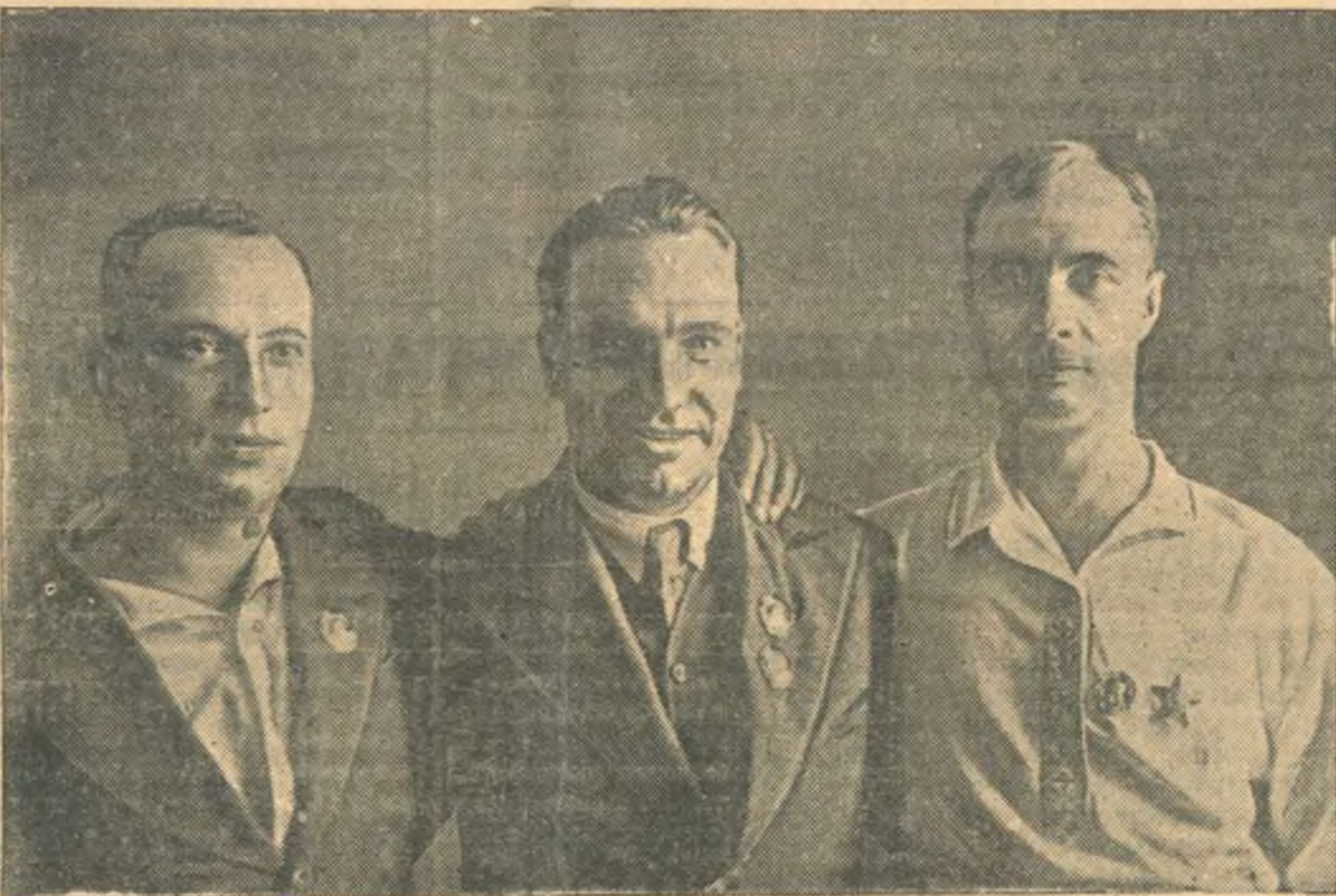
На снимке: экипаж самолета «АНТ-25» Героя Советского Союза товарищи Г. Ф. Байдуков, В. П. Чкалов и А. В. Беликов. (Снимок сделан 18 июля 1937 года).

В связи с гибелью Героя Советского Союза товарища Чкалова ряд французских газет помещают сегодня портрет покойного летчика и посвящают ему статьи.