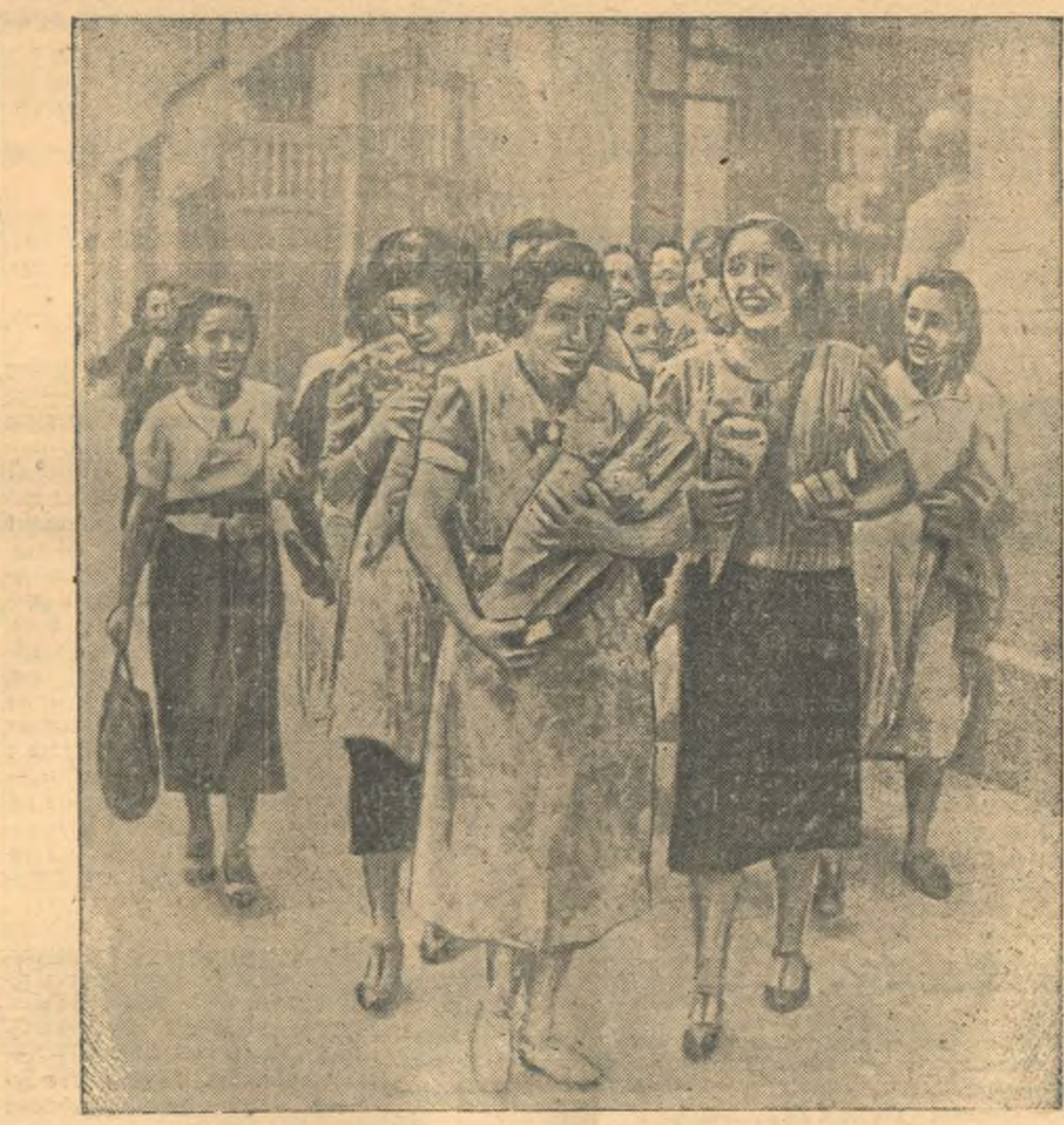
В республиканской Испании. Испанские женщины твердо верят в победу республиканской армии и не теряют бодрости, несмотря на длительную блокаду их родины. На снимке: молодые женщины около магазина на одной из улиц Барселоны.