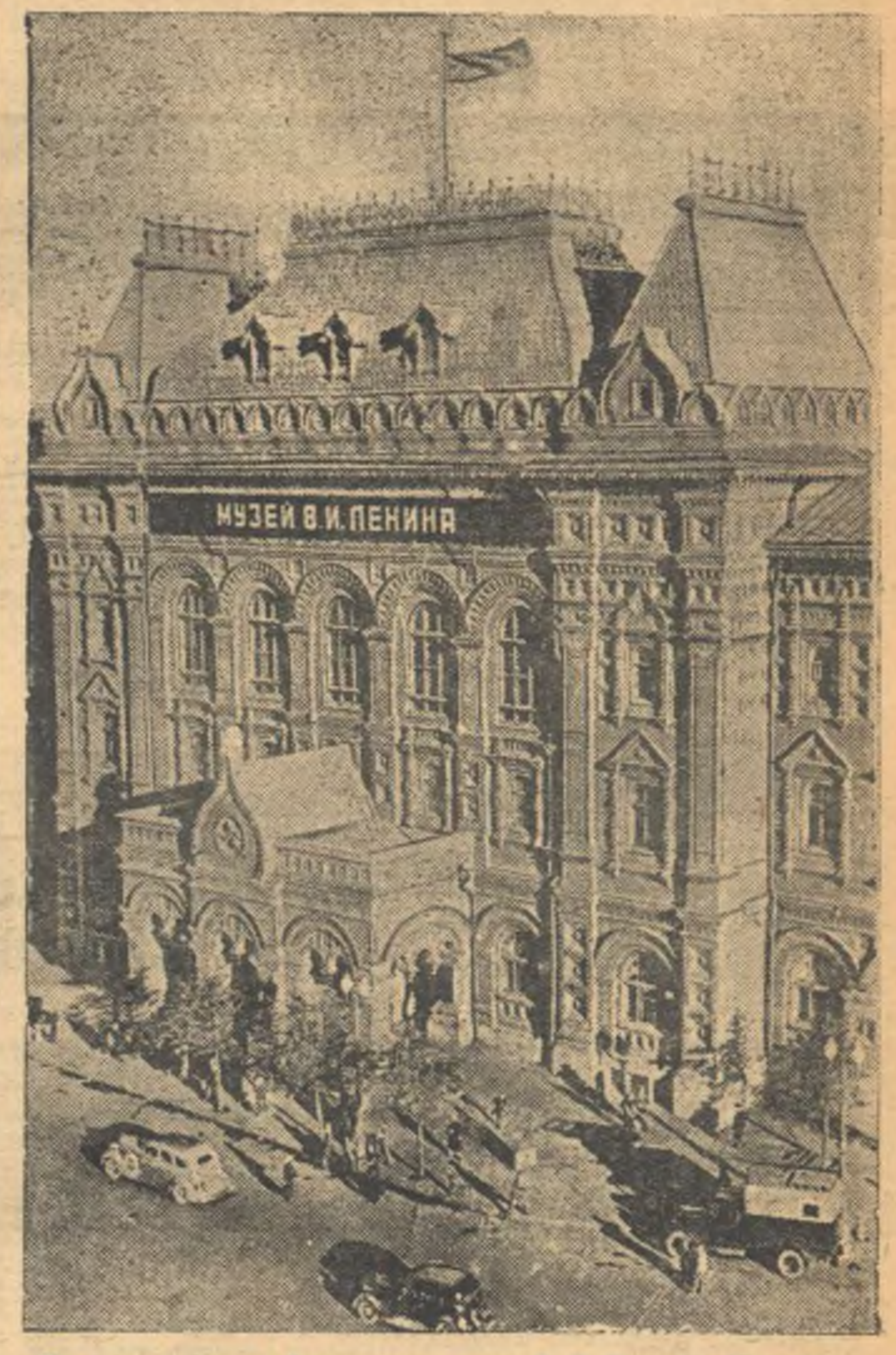
На снимке: здание Центрального музея В. И. Ленина в Москве.

ТОКИО, 5 января (ТАСС). Агентство Домей дзун сообщает, что в новое правительство Японии во главе с Хирамура вошли восемь министров бывшего кабинета Коноэ, включая самого Коноэ, принявшего пост министра без портфеля. Кроме того Коноэ назначен председателем тайного совета вместо Хирамура. Из прежнего кабинета в правительство вошли: министр иностранных дел Аrita, министр внутренних дел Таке, военный министр — Итагакэ, морской министр адмирал Новай, министр просвещения — Араки и др. Новые вошли в правительство: премьер-министр — Хирамура, министр финансов — Итогата Сатаро, министр земли и леса — Сакурадза и др. Хирамура Киичиро барон родился в 1867 году. После военно-финансового пути в феврале 1936 года он был назначен председателем тайного совета. В прошлом — руководящий чинивный министерства юстиции и министр юстиции. С 1924 года — член тайного совета, с 1926 года по 1936 год заместитель председателя тайного совета. Организатор и руководитель фашистской организации «кокуонсэ». С назначением его председателем тайного совета, Хирамура, под давлением дворянских кругов в части финансовых кругов, был вынужден в 1936 году формально расстаться с «кокуонсэ».