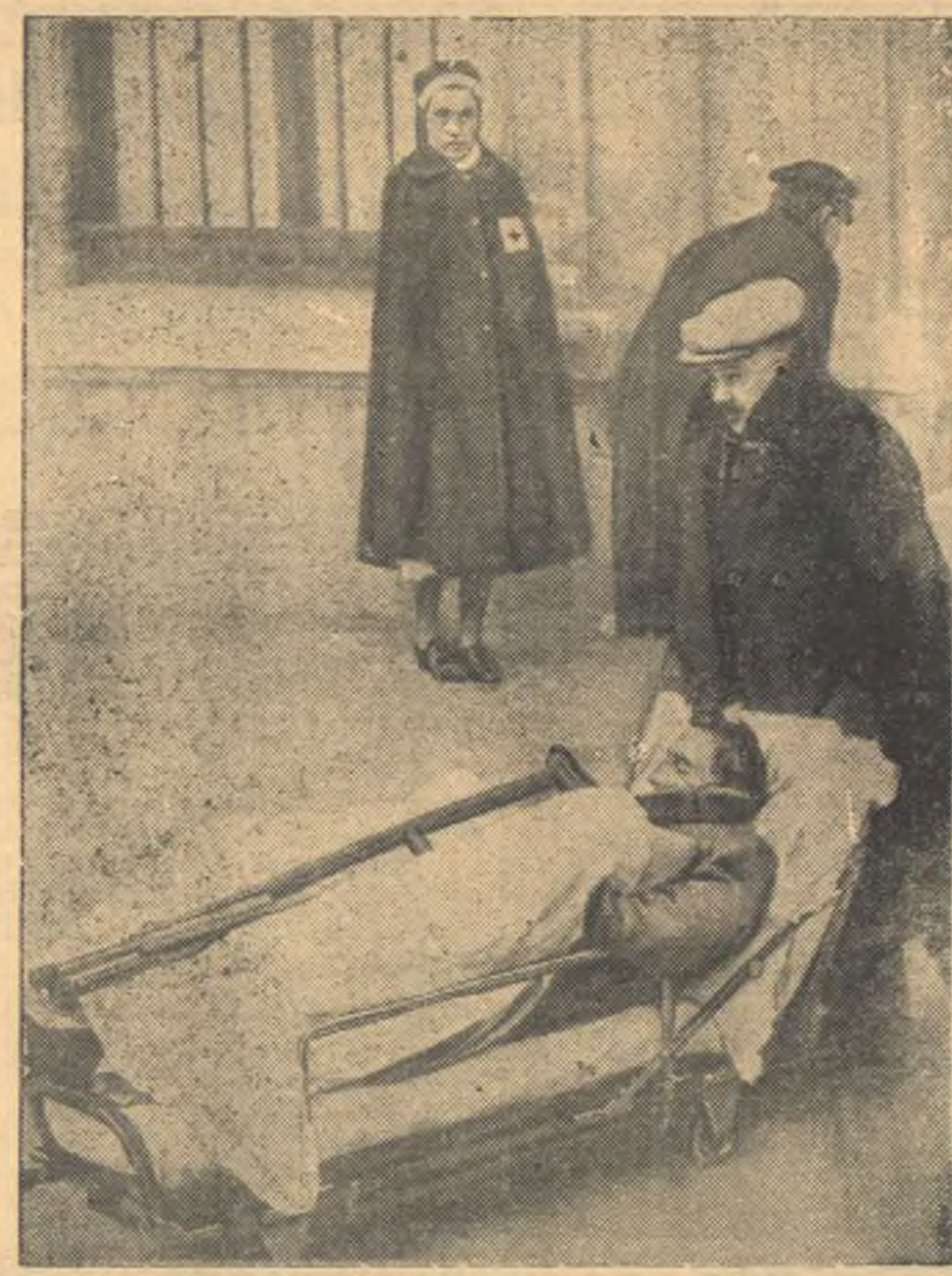
Раненые бойцы интернациональной бригады, возвратившиеся в Париж из республиканской Испании, были тепло встречены трудящимися, организовавшими медицинскую помощь раненым бойцам. Бойцы с вокзалов направляются в госпитали. На снимке: перевозка раненого бойца в госпиталь. (Фотохроника).

ЛЕНИНГРАД, 6 января. (Спецкор ТАСС). В третьем туре борьба в турнире носила ожесточенный характер за исключением партии Константинопольский — Кан, в которой киевский мастер пожертвовал две фигуры и уже на 14 ходу форсировал ничью вечным шахом. Хорошо разыграл начало партии, чемпион СССР Левенфиш получил выигрышную позицию против чемпиона США Решевского. Однако в решающий момент Левенфиш допустил серьезную ошибку. Решевский добился ничьей путем вечного шаха. Остро протекала партия Рагозин — Керес. Советский мастер выиграл у эстонского гроссмейстера качество и пешку. Партия отложена в безнадеем для Кереса положении. Прекрасно провел партию против Алаторцева самый юный участник турнира Смыслов. Получив две проходные пешки, он на 41 ходу заставил своего противника сдать. Лянцентазь был в трудном положении; временно пожертвовав ладью, он уравнил партию с Голдизе. На 31 ходу они согласились на ничью. Романовский отложил партию с Толушем с шансами на выигрыш. Партия Белавенец — Рабинвич и Макагонов — Болдаревский отложены в обоюдно остром положении. Заслуженный мастер П. Романовский.