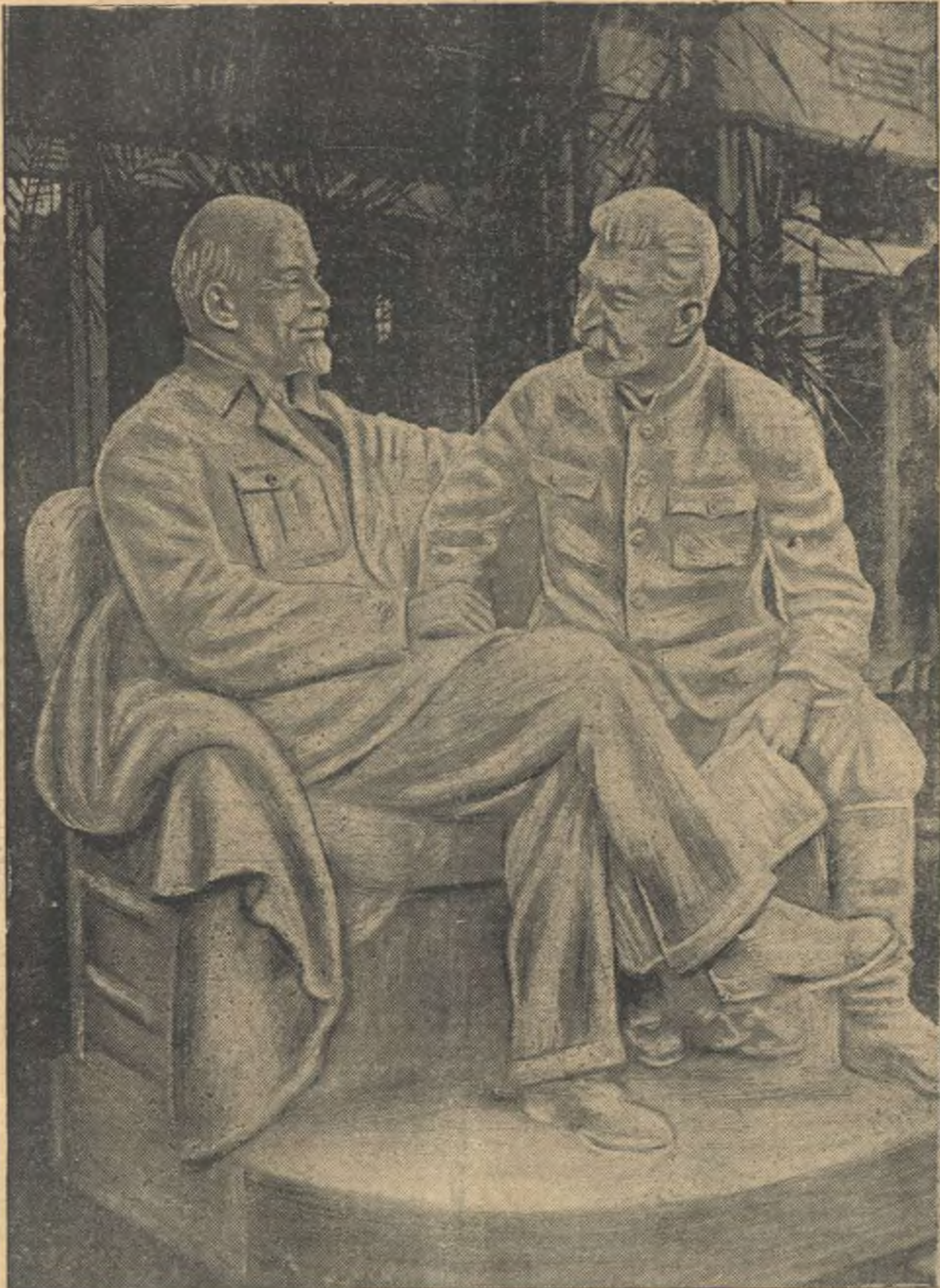
В Воронежском Дворе Культуры Союза Пищевиков установлена грандиозная скульптура «Ленин и Сталин в Горках». Размер скульптуры 2,5 метра в высоту и 2,2 метра в ширину. Автор скульптуры Пивоваров (Киев).

Профсоюзы созданы, работали, развивались и побеждали под руководством партии Ленина—Сталина. И сейчас, когда партия призывает к укреплению дисциплины труда и созданию образцового порядка на наших предприятиях и в учреждениях, советские профсоюзы должны оказывать на высоте!