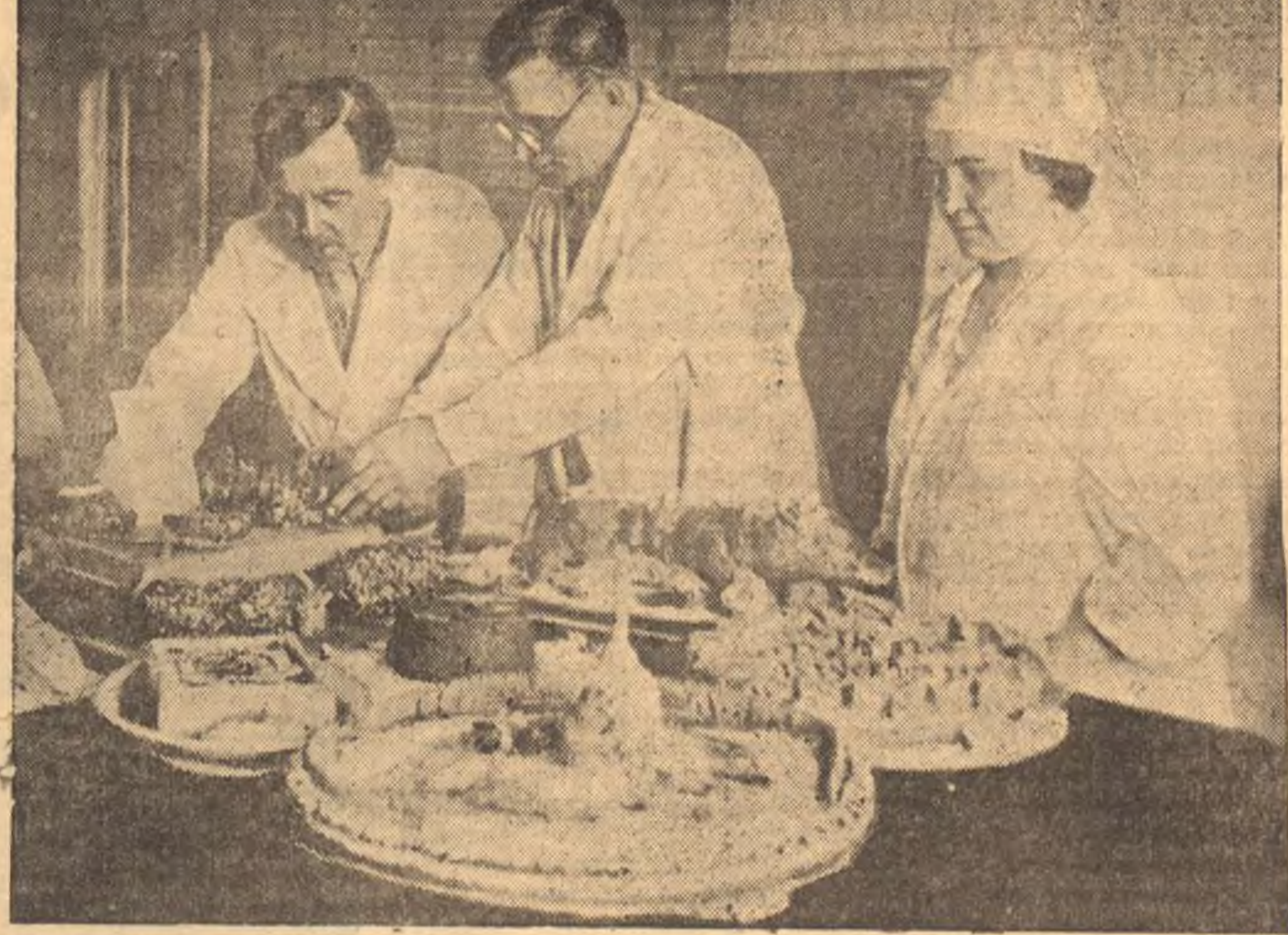
В Новосибирске состоялся областной слет стахановцев общественного питания. На слет из городов и районов области были доставлены образцы кулинарных и кондитерских изделий...