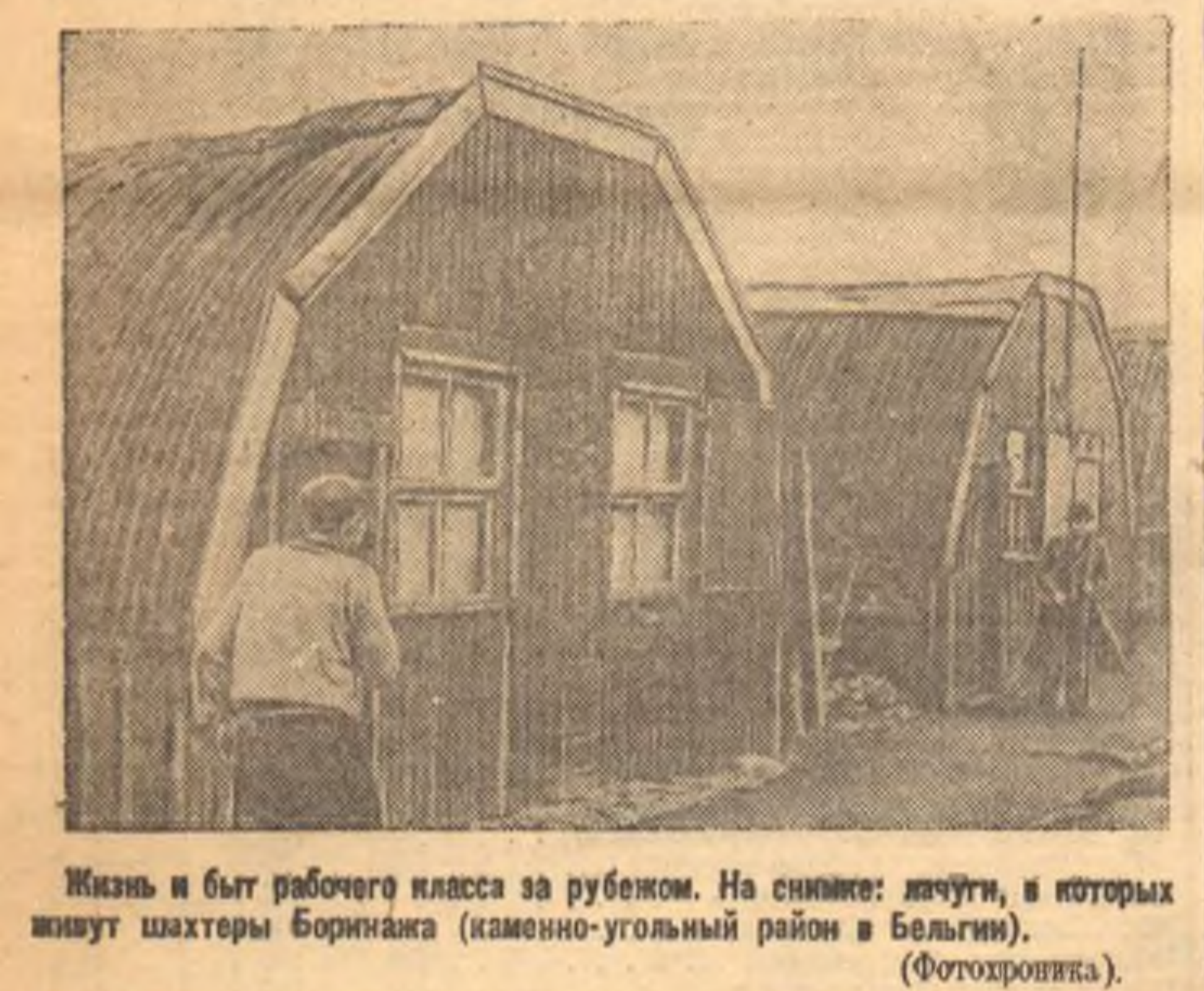
Жизнь и быт рабочего класса за рубежом. На снимке: шахтеры Борниана (каменно-угольный район в Бельгии).

БЕРЛИН, 16 мая. (ТАСС). Ветра Гитлер в сопровождении начальника генерального штаба Кейтеля и ряда других генералов осмотрел военные укрепления Германии вдоль люксембургской границы.