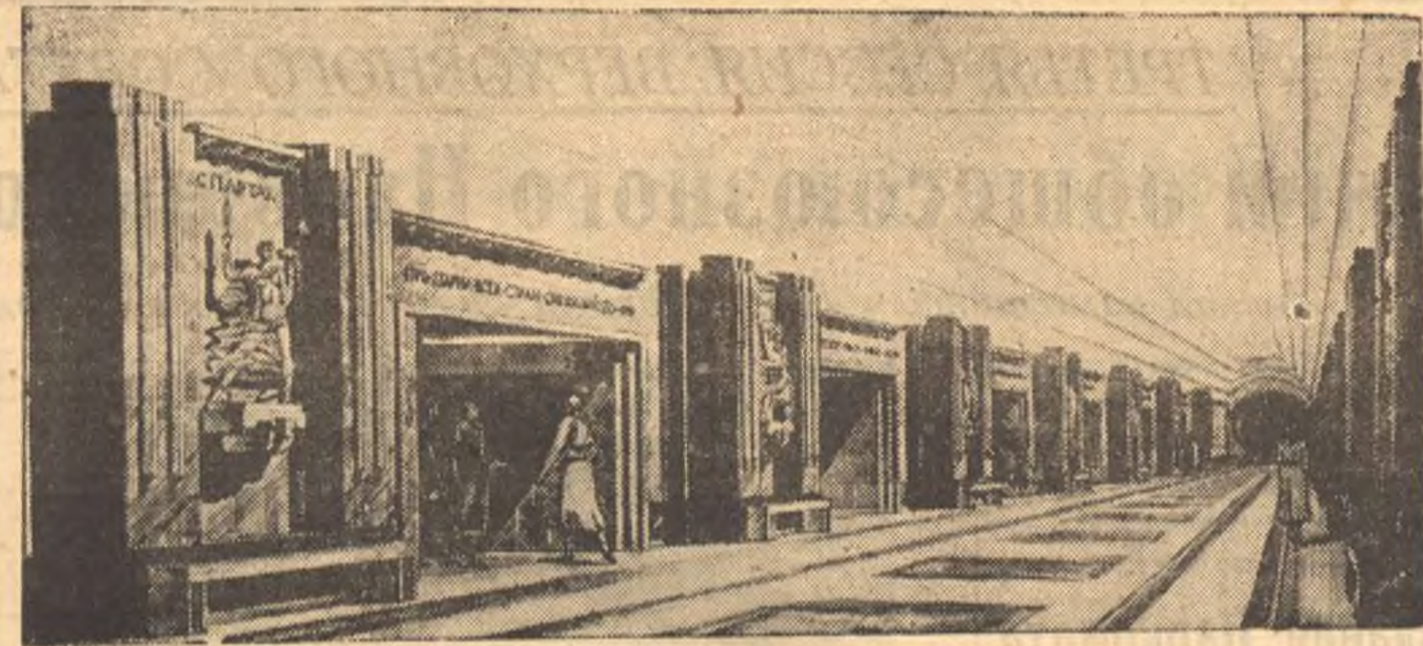
Строительство метроплитена III очереди. На снимке: проект станции «Спартакоснап» (автор проекта архитектор Б. М. Иофан).