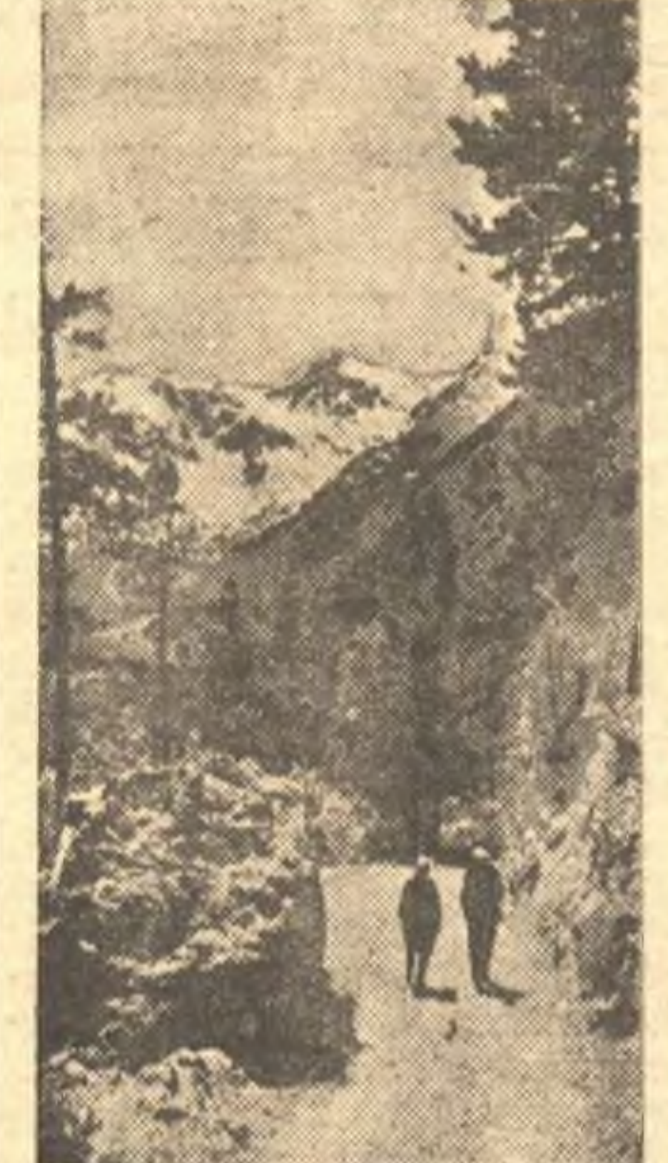
К 15-летию Северо-Осетинской АССР. На высоте 2000 метров, над уровнем моря, в живописной местности Северной Осетии, расположен курорт «Цей», построенный за годы Сталинских пятилеток. Чистый горный воздух, богатейшая растительность, привлекают сюда трудящихся со всех концов Советского Союза. Вблизи курорта раскинулись лагеря альпинистов, туристов, пионеров и спортобщества «Буревестники» и «Торпедо». На снимке: дорога, ведущая к Цейскому воднику. (Фотохроника).

ОДЕССА, 27 июня. (ТАСС). Колхозы Одесщины приступили к сдаче на пункты Заготзерно зерна нового урожая. Колхозники сельхозартели имени Молотова, Овидиопольского района, вчера сдали в счет хлебоблагодатного государству первые тонны пшеницы «украинка». Колхоз-миллионер «Искра» доставил на Овидиопольский пункт 3 тонны пшеницы. Высококачественную сортовую пшеницу вывозят на элеватор колхоз имени Котовского, Одесского района.