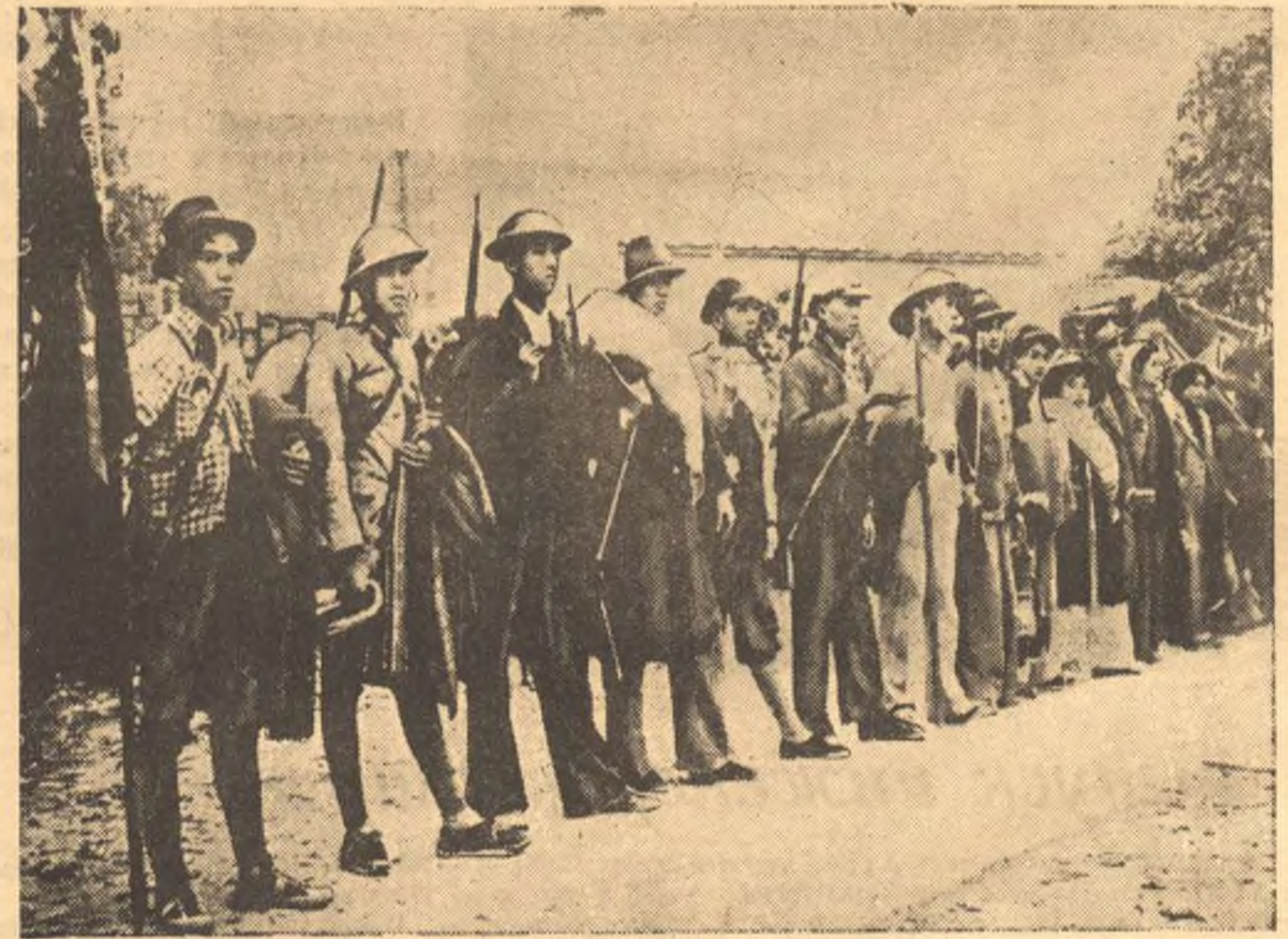
Борьба китайского народа против японских интервентов. Китайские партизаны вместе с регулярной армией успешно ведут борьбу с японской воиной. В этой борьбе участвуют также китайские женщины и молодежь.