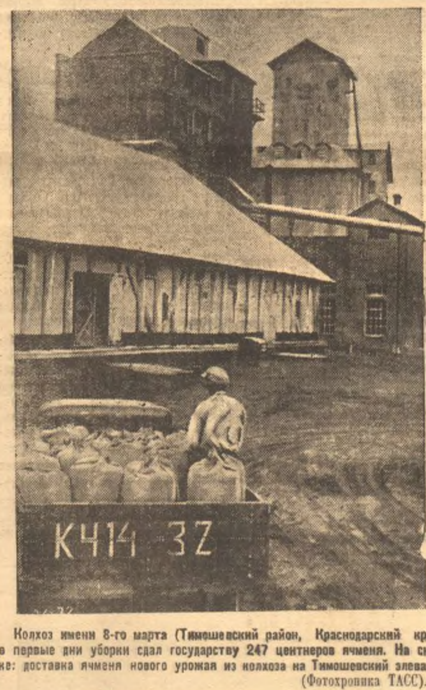
Колхоз имени 8-го марта (Тимшевский район, Краснодарский край), в первые дни уборки сдал государству 247 центнеров ячменя.

Зав. отделом агитации в пропаганды горкома ВКП(б) тов. Жиянков указал на слабую постановку шефства в агитационной работе.