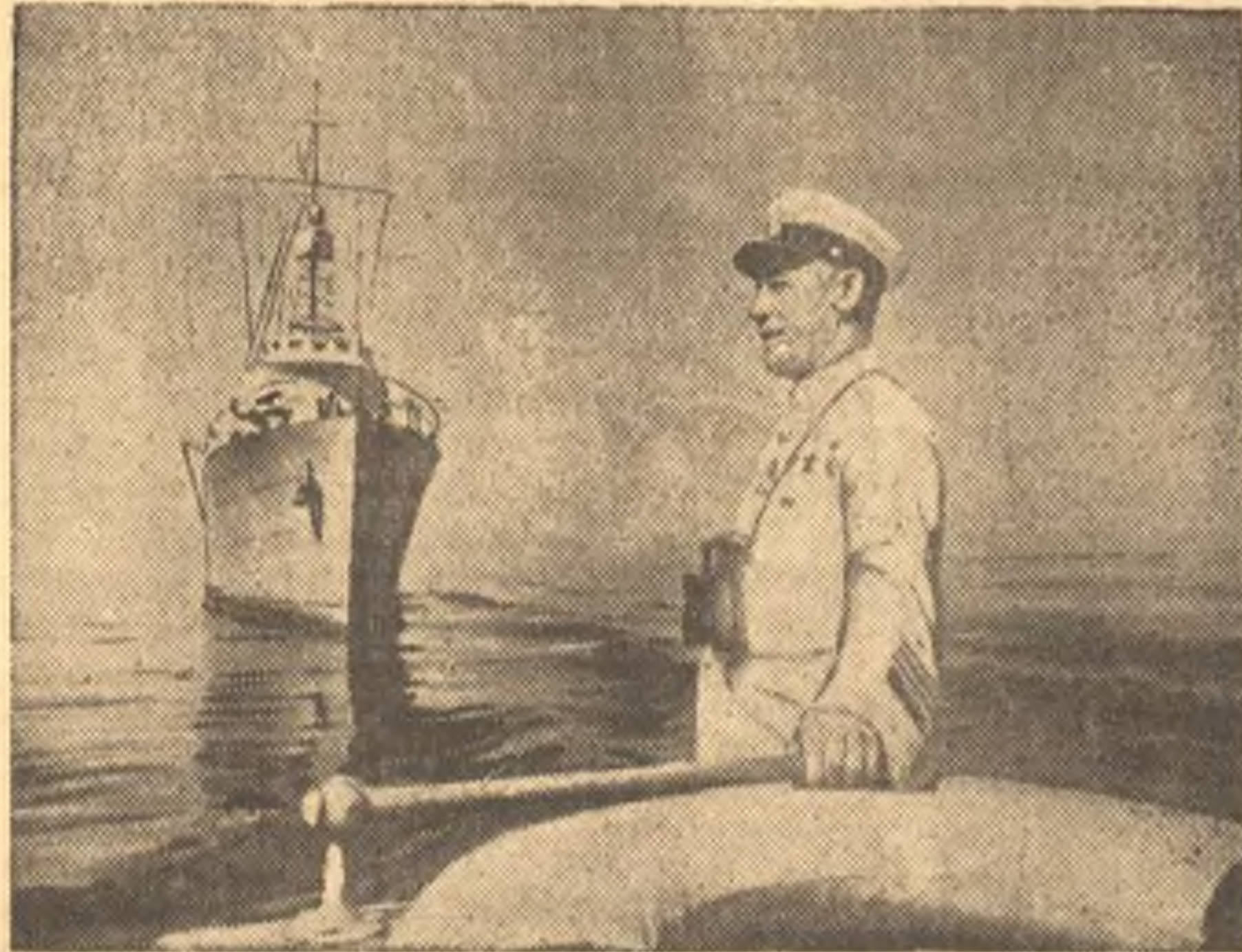
26 июня на корабле Черноморского флота прибыл народный комиссар Военно-Морского Флота СССР флагман флота 2-го ранга тов. Кузнецов. На снимке: Нарком тов. Кузнецов на палубе обходит строй кораблей.