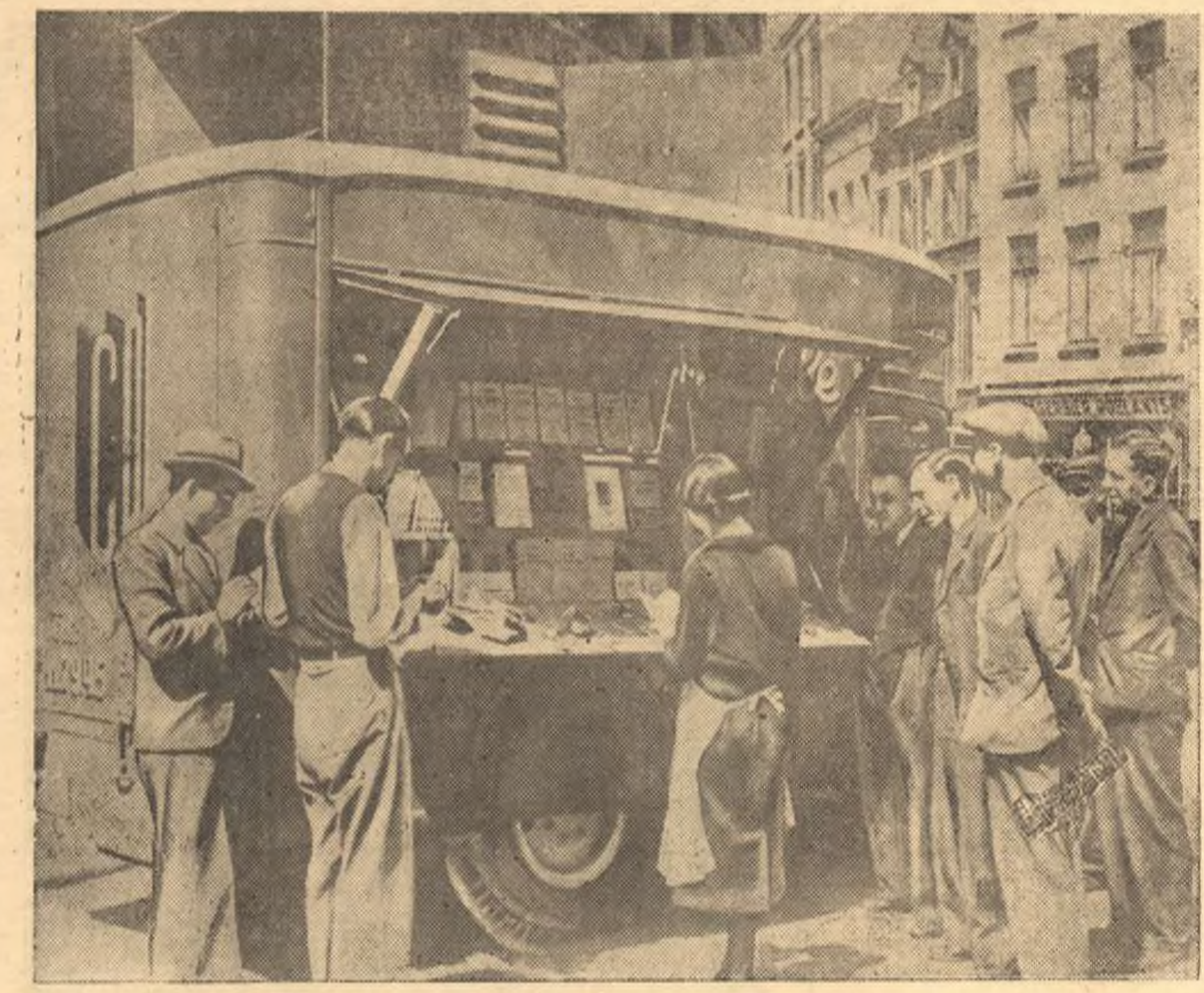
Трудящиеся капиталистических стран изучают «Краткий курс истории ВКП(б)». Издание «Краткого курса истории ВКП(б)» на иностранных языках встретило живой интерес среди трудящихся капиталистических стран. «История ВКП(б)» раскупается огромными тиражами. Компартия Бельгии широко развинула кампанию за распространение «Краткого курса истории ВКП(б)». Специальный автомобиль - библиотека объезжает все районы страны, знакомя бельгийских трудящихся с этим замечательным документом. На снимке: Автомобиль - библиотека на улицах Брюсселя.

Независимая страна, расположенная в центре Европы, с мощной промышленностью и развитым сельским хозяйством, с образцовой армией стала германской колонией. Финансовые магнаты и крупные помещики, во главе которых стояли такие люди, как Брера, Файерберг, Прейс, Черны и др., давно решились пожертвовать национальными интересами своей родины и народа во имя сохранения своих прибылей и привилегий. Период отдаленный мюнхенское соглашение от дати германской оккупации страны (15 марта 1939 г.), правительственные круги не только не использовали для организации сопротивления германским фашистам и их агентам внутри страны, но и, наоборот, сделали все для того, чтобы поощрить германских агентов в их подрывной работе, воспрепятствовать вооружению народа и его подготовке к обороне. Рабочий класс страны был расколот. Социал-демократические лидеры систематически отклоняли предложения коммунистов о единстве действий для защиты республики. После Мюнхена социал-демократические лидеры ликвидировали свою партию, объявив о выходе из II Интернационала, организовав новую партию под названием «партия труда», которая, прикрываясь оппозиционными фразами, на самом деле сотрудничала с реакционными партиями. Все это обусловило захват Чехо-Словакии германскими оккупантами.