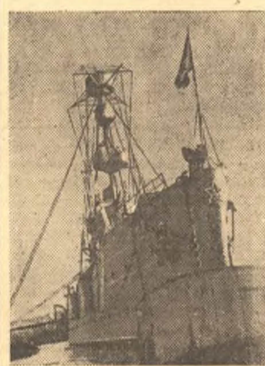
Военно-морской Черноморский флот. На снимке: крейсер «Червона Украина» на рейде.

ОРЕХОВО-ЗУЕВО, 4 июля. (ТАСС). В районе начался обмер приусадебных участков. В первый день были обнаружены серьезные нарушения устава сельскохозяйственной артели. В деревне Яковлево, например, в 12 хозяйствах выявлены изъятые земли.