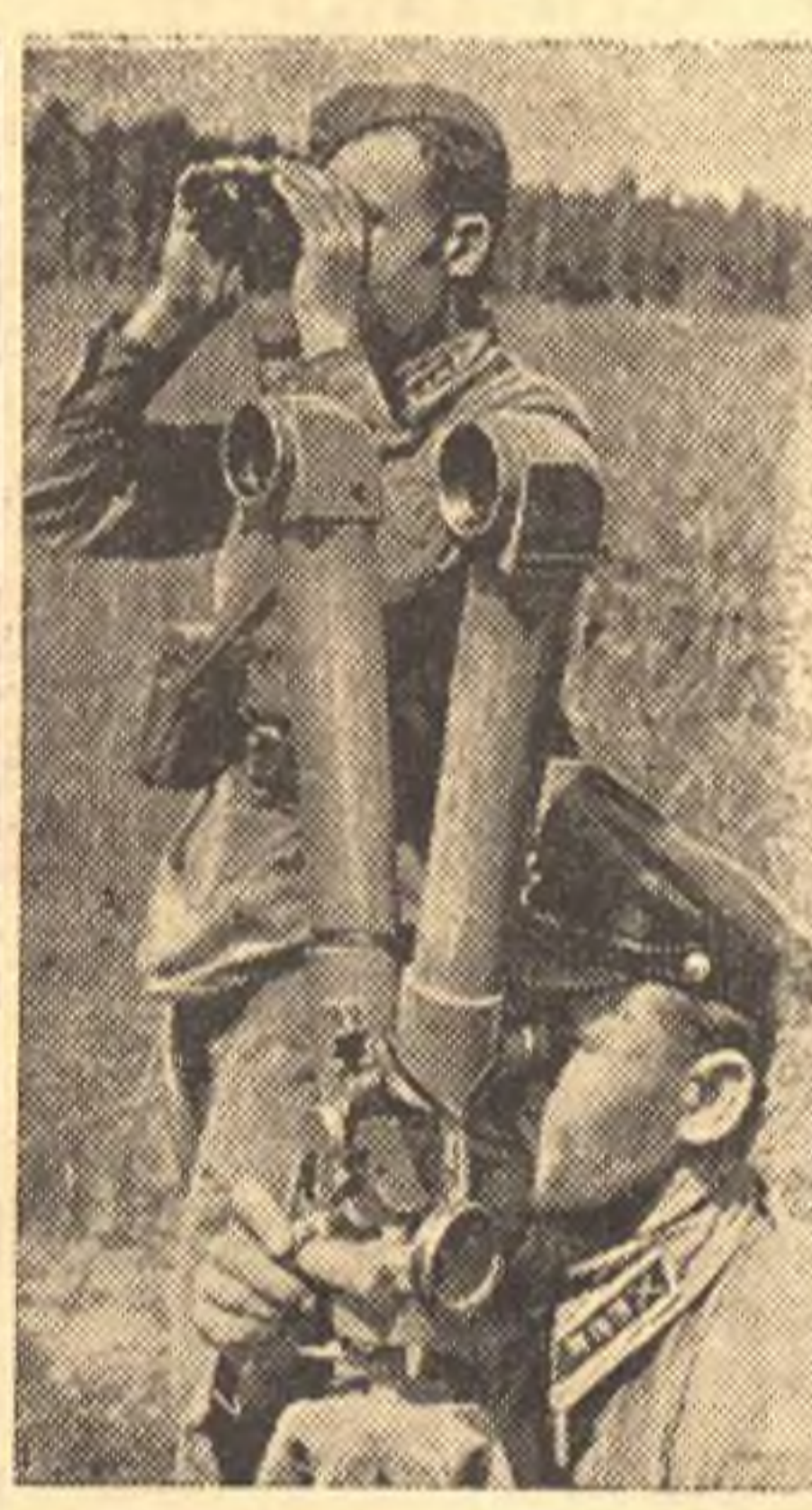
В артиллерийских частях Московского военного округа началась подготовка к Всесоюзному дню железнодорожного транспорта. На снимке: командант наблюдательного пункта во время боевых стрельб.