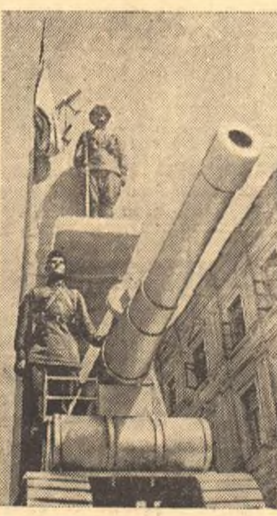
Всероссийный день физкультурника в Москве. На снимке: оформление колонны физкультурников спортблизости «Динамо».