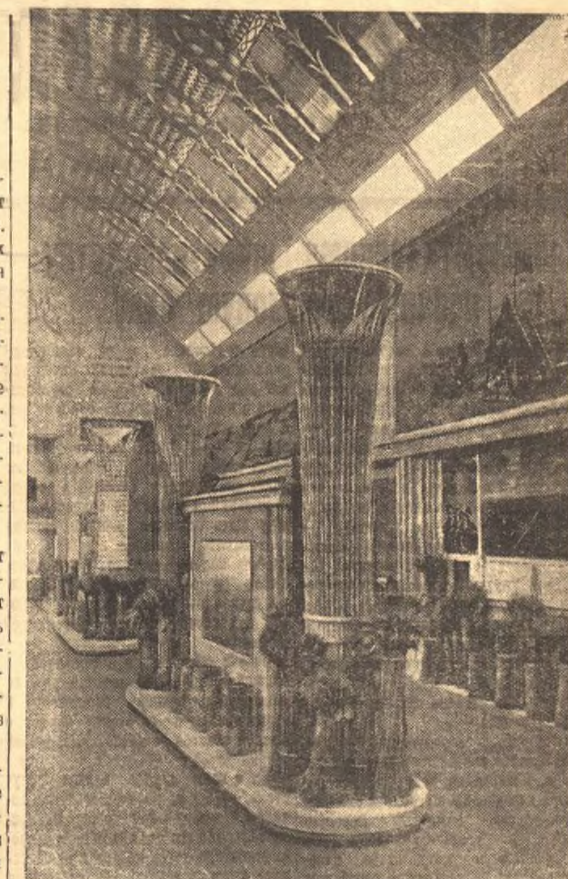
На строительстве Всесоюзной сельскохозяйственной выставки. На снимке: уголок павильона «Зерно».

Отвергая протест японской стороны, ввиду его очевидной необоснованности, Народный комиссариат иностранных дел предупреждает японское правительство, а также японских концессионеров, что советское правительство, выполняя свои обязательства, будет неуклонно требовать и от японской стороны строгого соблюдения заключенных договоров и неуклонного выполнения на территории СССР советских законов.