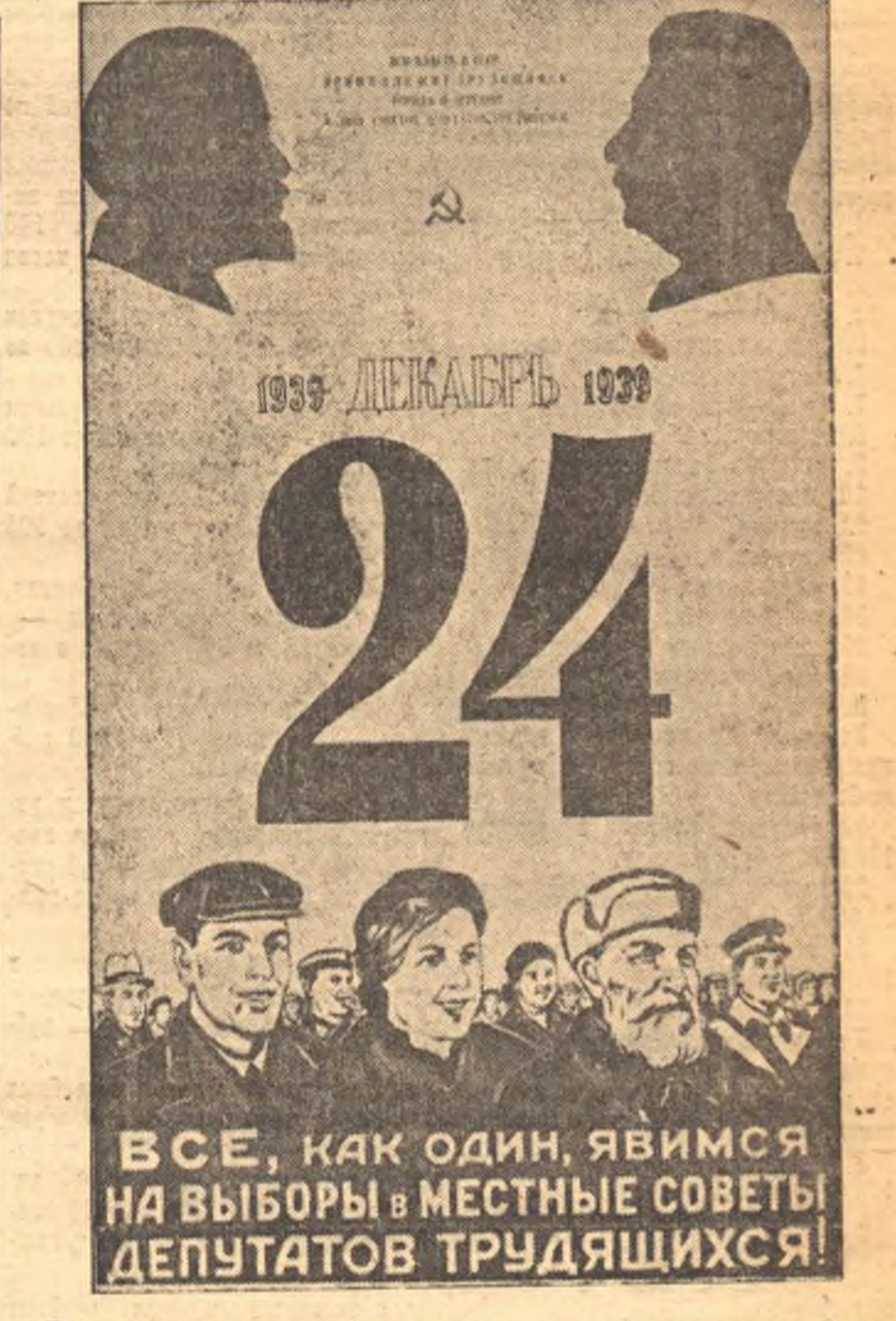
На снимке: репродукция планата, выпущенного издательством «Искусство» и выборов в местные Советы депутатов трудящихся. Работа художника Н. Деясова и Н. Ватолиной.

силы от края до края нашей родины, умножал богатство страны и ставил его на службу народу. Под руководством нашей партии происходит расцвет культуры народов Советского Союза, выросли и быстро множатся преданные родине и социализму кадры новой, советской интеллигенции, идет неуклонный подъем как материального, так и культурного уровня народных масс. Диктатура пролетариата в СССР создана и укреплена на основе верного союза рабочих и крестьян, при осуществлении руководящей роли рабочего класса. Под Вашим руководством партия отстаивала в борьбе с врагами ленинизма этот завет Ленина и укрепила Советское Государство, превратила его в непреступную крепость социализма. Основой нашего социалистического государства рабочих и крестьян является союз трудящихся всех национальностей советской страны. Под Вашим всесторонним и самым близким руководством было обеспечено выполнение этого завета Ленина. Дружба народов прочно вошла в жизнь и быт трудящихся нашей великой родины, и Союз Советских Социалистических Республик стал непобедимой силой. Прочность Советского Государства охраняется вооруженной армией освобожденных людей, могучей Красной Армией и Красным Флотом. Ваша забота об укреплении обороны, страны известна всему народу, каждому бойцу, командиру и комиссару. Под Вашим водительством Советская Армия будет и впредь одерживать славные победы на военных фронтах, как это было и в годы гражданской войны. Нашу советскую Родину — любят, поддерживают трудящиеся и угне-