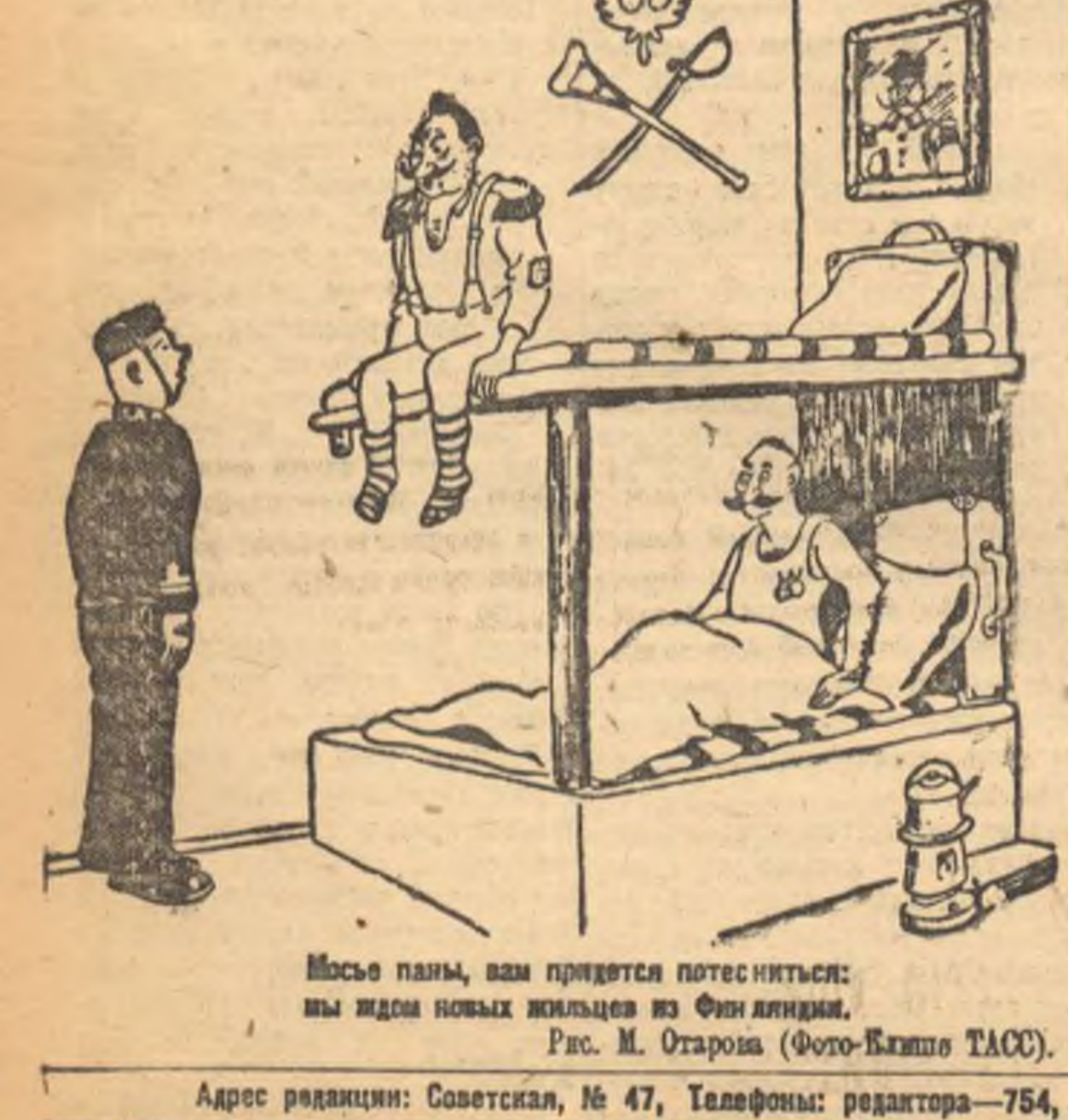
Мосье пань, вам придется потесниться: ны идом новых жильцов из Финляндии. Рис. М. Старова.