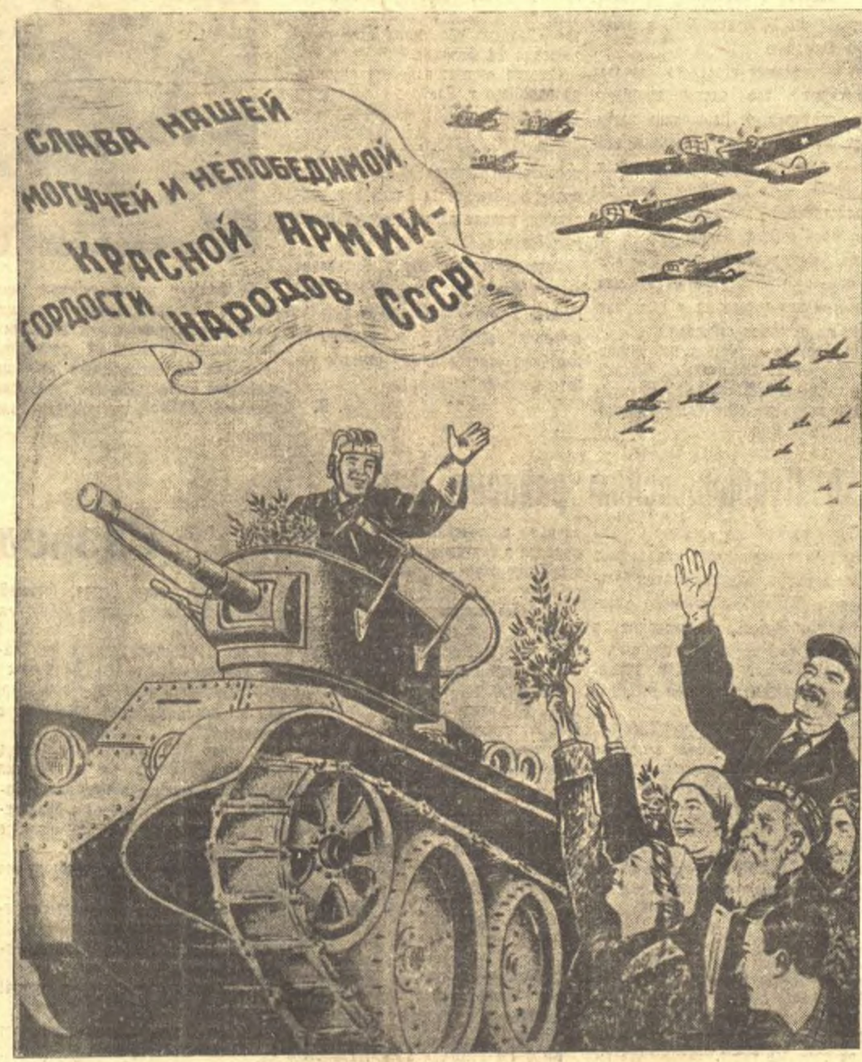
Рис. В. Баркова и В. Лисовца.

В течение 13 февраля на фронте продолжались бои разведчиков и в ряде районов продолжались ожесточенные действия некоторых частей и артеллерии. На Карельском перешейке усиленно действуют наши войска развивают. Противник, пытаясь крупными силами перейти в контрата-