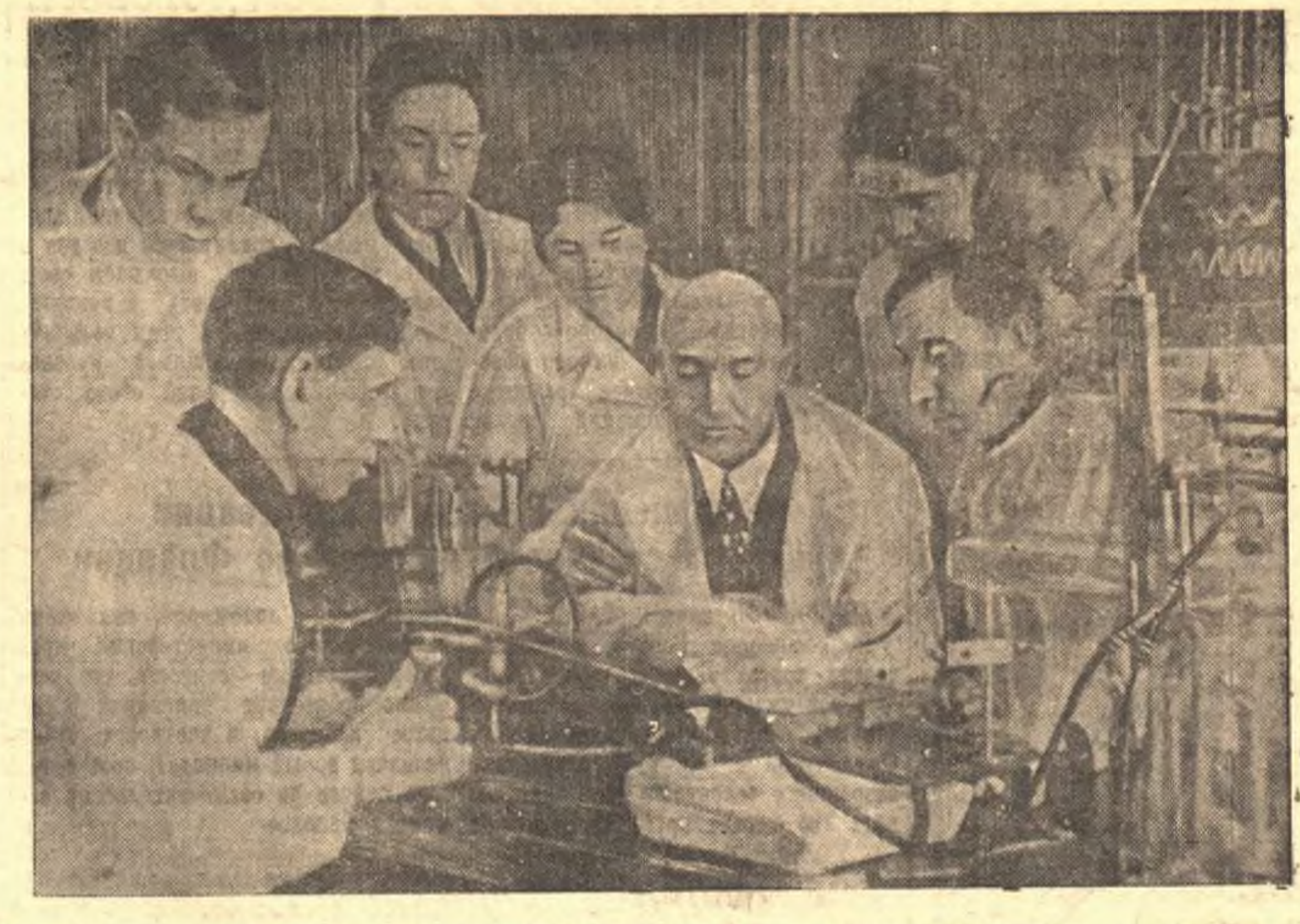
Большую научно-исследовательскую работу по нервной трофики и высшей нервной деятельности ведут студенты медицинского института в научно-исследовательском кружке имени И. М. Сеченова.