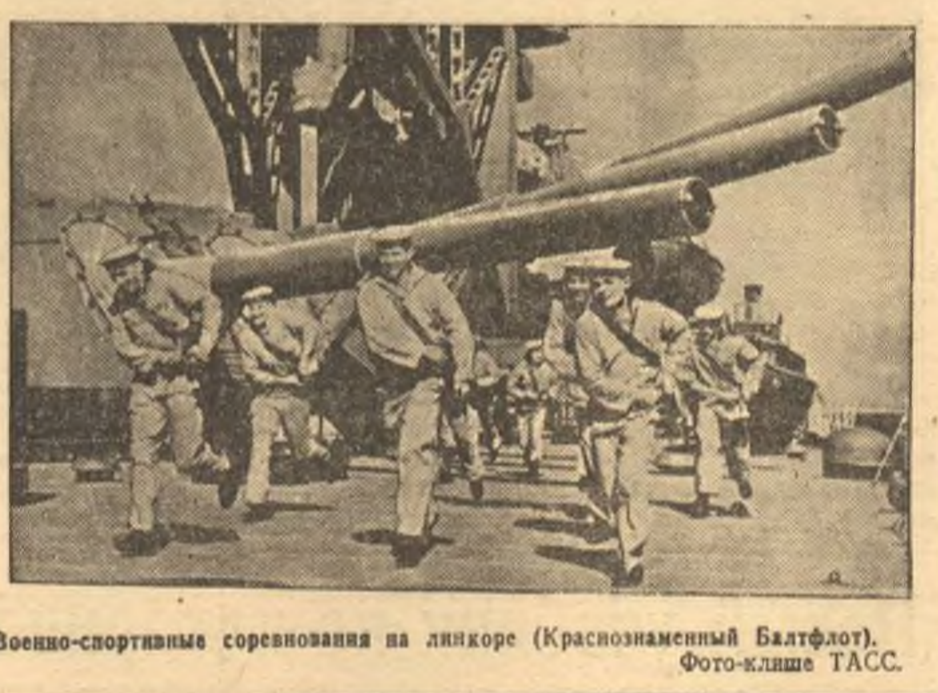
Военно-спортивные соревнования на лыжне (Краснознаменный Балтфлот).